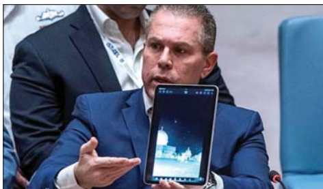
مندوب إسرائيل في مجلس الأمن يعرض مسليرة إيرانية فوق الأقصى

كما دانت ممثلة بريطانيا في الأمم المتحدة باربرا وودوارد الهجوم الإيراني على إسرائيل، وعدته متهوراً «لأنه هدد حياة آلاف المدنيين».