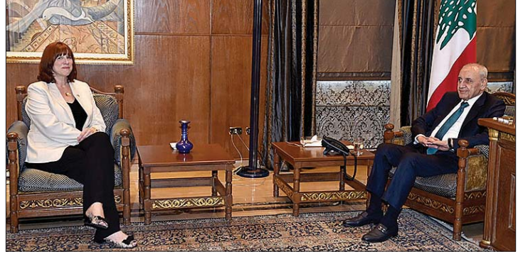
السفيرة الكندية في عين التينة

استقبل رئيس مجلس النواب نبيه بري في مقر الرئاسة الثانية في عين التينة سفيرة كندا في لبنان ستيفاني ماكولوم وعرض معها الأوضاع العامة والتطورات في لبنان والمنطقة والمستجدات الميدانية والسياسية جراء مواصلة إسرائيل لعدوانها على قطاع غزة وجنوب لبنان. وبحث بري مع وزير الدفاع في حكومة تصريف الاعمال موريس سليم في الأوضاع العامة لاسيما الامنية منها. كذلك عرض بري مع سفيرة الولايات المتحدة الاميركية لدى لبنان ليزا جونسون التطورات في لبنان والمنطقة. على صعيد آخر، دعا رئيس مجلس النواب نبيه بري هيئة مكتب المجلس إلى إجتماع نهار الأربعاء المقبل الواقع فيه 17 نيسان 2024 الساعة الاولى بعد الظهر.