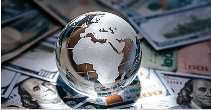
ترقب دولي لهذه التبعات

الشرق - تشهد منطقة الشرق الأوسط تصاعداً دراماتيكياً في الأحداث، مع تصاعد الاضطرابات والتوترات الجيوسياسية في الفترة الأخيرة، وأخرها الهجوم الإيراني على إسرائيل، رداً على الغارة التي استهدفت مقر القنصلية الإيرانية في دمشق، وما يرتبط به من سيناريوات قادمة بشأن مستقبل الصراع وأي تصعيد محتمل في هذا السياق. وبالنظر إلى أهمية المنطقة بالنسبة للاقتصاد العالمي، فإن ما توجع به من اضطرابات متزايدة وما تشهده من عواصف مختلفة على عديد من الصُعد، فإن ثمة مخاوف أوسع بشأن ارتدادات تلك التطورات على حركة التجارة العالمية واقتصاد العالم بشكل عام، وبالنظر إلى أن تصاعد تلك الاضطرابات يأتي تزامناً مع تطورات جيوسياسية مختلفة يشهدها العالم، وما في ذلك الحرب في أوكرانيا الممتدة منذ أكثر من عامين.