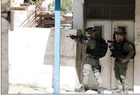
جنود الاحتلال يطلقون النار على فلسطينيين في الضفة

ولفتت إلى أن «قوات الاحتلال خلالها الأعمرة النارية وقنابل الغاز السام باتجاههم». وكان الجيش الإسرائيلي قد أعلن أمس سقوط مسيرة تابعة له قرب نابلس شمالي الضفة، مشيراً إلى إجراء تحقيق لتحديد بسبب سقوطها.