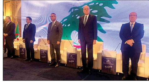
ميقاتي في الملتقى

عادلاً للقضية الفلسطينية. فلا يمكن الحديث عن أمن وتنمية اقتصادية عربية من دون وقف الحروب وتحقيق إستقرار مستدام، كذلك عبر إنهاء التوتر في المنطقة. وهنا لا بد من التنويه بما قامت به السعودية وإيران ببدء مرحلة جديدة من التعاون، الذي نأمل أن يمتد إلى باقي دول المنطقة. لذلك، وإذا كنا نسعى لتحقيق الأمن الاقتصادي العربي فبالإأكيد فإن الدول الخليجية تشكل مرتكزاً أساسياً لهذا الهدف السامي، وعلينا جميعاً أن نكون قلباً وقلباً معها، والعمل على تشبيك القطاع الخاص العربي مع كل المشاريع الكبرى التي يتم تنفيذها في هذه الدول. أختتم كلمتي بتوجيه الشكر لإتحاد المصارف العربية، لرئيسه ومجلس إدارته وأمينه العام، على كل ما يقومون به، وبشكل خاص مؤتمرنا اليوم أو المؤتمرات الأخرى، التي ما زلنا من خلالها نشعر بوجود إهتمام بالعمل العربي المشترك». من جهته، اعتبر حاكم مصرف لبنان بالإنابة وسيم منصور أن «أهم مفاعيل وقف تمويل الدولة من الاحتياطات إرساء استقلالية المصرف المركزي وإعادة عمله الأساسي ولدوره في تأمين الاستقرار النقدي». ورأى أن «لتحقيق هذا الاستقرار يستخدم مصرف لبنان الأداة الوحيدة المنبغية لديه وهي السيطرة على الكتلة النقدية باليرة اللبنانية وعدم ضخ الدولار إلا من خلال الدولة وخلق نوع من التوازن بين الاقتصاد المدولر والاقتصاد باليرة اللبنانية»، مشيراً إلى أنه «بهذه الآليات استطاع المصرف النقدي أن يزيد احتياطاته بالعملة الأجنبي مليار دولار أميركي». وأكد أن «خروج لبنان من أزمتته الاقتصادية العميقة يتطلب المحاسبة من خلال القضاء ووضع خطة واضحة لمعالجة أموال المودعين وإعادة بناء الاقتصاد من خلال إعادة تثبيت القطاع المصرفي وأخيراً إعادة هيكلة الدولة وبناء أجهزتها».