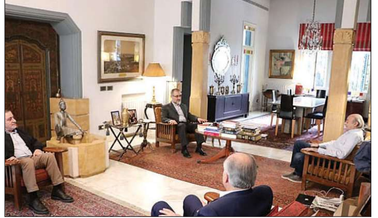
لقاء جنبلات ووفد الحزب

الشرق - استقبل الرئيس السابق للحزب التقدمي الاشتراكي وليد جنبلاط، في كليمنصو، وفداً من حزب الله ضم كل من المعاون السياسي لأمين عام حزب الله حسين الخليل ومسؤول وحدة الإرتباط والتنسيق وفتوح صفا، بحضور النائبين وائل أبو فاعور وهادي أبو الحسن. وقد جرى خلال اللقاء البحث في آخر المستجدات السياسية المحلية والإقليمية، لا سيما التطورات الميدانية في الجنوب واستمرار العدوان الإسرائيلي على لبنان كما تم البحث في أزمة النزوح السوري وكيفية الوصول إلى موقف لبناني موحد من هذه الأزمة، وكانت مناسبة لإطلاع وفد الحزب على الورقة التي أعدها الحزب التقدمي الاشتراكي بهذا الخصوص والتي تتضمن أفكاراً عملية محددة ستعرض على مختلف القوى السياسية اعتباراً من الأسبوع المقبل.