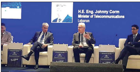
القرم في ملتقى الأمن العربي

شدد وزير الاتصالات في حكومة تصريف الأعمال المهندس جوني القرم على «ضرورة وجود بنى تحتية لقطاع الاتصالات تتمتع بالمرونة وقدرة على التكيف مع القطاعات الحيوية في هذا المجتمع، أي أن هذه البنى التحتية لا يجب أن تكون مجرد أصول واستثمارات تكنولوجية وفنية بل تواكب التطور وتكون أساسية للحفاظ على استمرارية اقتصادات هذه المنطقة وسلامة شعوبها». جاء ذلك في ملتقى «الأمن الاقتصادي العربي» في ظل المتغيرات الجيوسياسية، الذي عُقد برعاية وحضور رئيس مجلس الوزراء نجيب ميقاتي في فندق «فينيسيا» في بيروت.