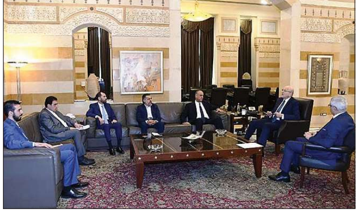
ميقاتي مستقبلا وفد «الاعتدال»

الشرق - استقبل رئيس الحكومة نجيب ميقاتي سفير فرنسا هيرفيه ماغرو امس، وتم البحث في التحضيرات لزيارة وزير خارجية فرنسا ستيفان سيجورنيه للبنان والمحادثات التي سيجريها مع رئيس الحكومة عصر الأحد. كما تم البحث في الاقتراحات الفرنسية لمعالجة الوضع في الجنوب والملف الرئاسي. واجتمع رئيس الحكومة مع حاكم مصرف لبنان بالإنابة والشرق - استقبل رئيس الحكومة نجيب ميقاتي سفير فرنسا هيرفيه ماغرو امس، وتم البحث في التحضيرات لزيارة وزير خارجية فرنسا ستيفان سيجورنيه للبنان والمحادثات التي سيجريها مع رئيس الحكومة عصر الأحد. كما تم البحث في الاقتراحات الفرنسية لمعالجة الوضع في الجنوب والملف الرئاسي. واجتمع رئيس الحكومة مع حاكم مصرف لبنان بالإنابة