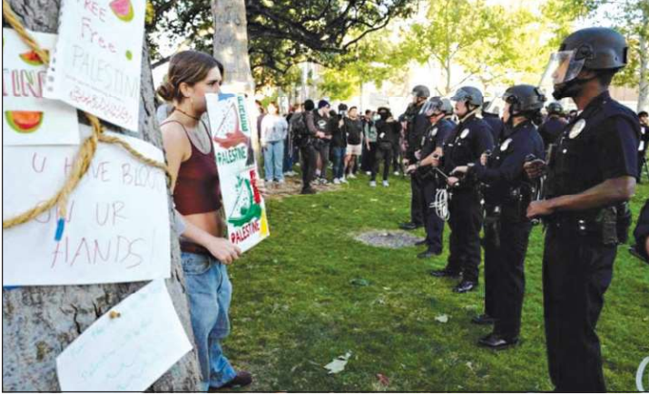
الشرطة الأميركية في مواجهة الطلاب المؤيدين للفلسطينيين في جامعة نيويورك

أدانت منظمة العفو الدولية، الأميركية واجهت الاحتجاجات الدائمة لحقوق الفلسطينيين بعزيمتها وقمعها، بدلا من السماح لطلابها بممارسة حقهم بالاحتجاج وحمائته. وأوضح أن الجامعات "بذلت جهودها لقمع هذا الحق، حتى أنها أشرت السلطات المحلية وطالبت باعتقال المحتجين وأوقفت الطلاب المشاركين في المظاهرات السلمية عن الدراسة". وطالب رئيس مجلس النواب الأمريكي مايك جونسون، رئيسة جامعة كولومبيا، نعمت شفيق، بالاستقالة في حال فشلها بإيقاف تظاهرات الطلاب المؤيدين لفلسطين. كما أكد جونسون ضرورة توقيف الطلاب الراقضين لإنهاء الاحتجاج، مشددا على ضرورة استخدام الرئيس جو بايدن صلاحيته لتحريك الحرس الوطني إذا لم تتم السيطرة على الاحتجاجات في الحرم الجامعي. وكانت شرطة لوس انجلس أعلنت عن اعتقال 93 شخصا خلال احتجاج في جامعة جنوب كاليفورنيا وذلك تنديدا بالحرب على غزة. وبالتزامن، وصف رئيس وزراء إسرائيل التظاهرات المؤيدة للفلسطينيين في جامعات أميركا بـ"المروعة". وعلى غرار الجامعات الأميركية، احتج مئات الطلاب الفرنسيين في ساحة السوربون على الحرب على غزة، وتنديداً بمواقف الحكومة الفرنسية منها.