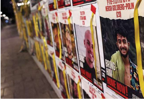
صور لأسرى الإحتلال

وألمانيا والمجر وبولندا والبرتغال ورومانيا وصربيا وإسبانيا وتايلاند وبريطانيا. وجاء في البيان "نؤكد على أن الاتفاق المطروح على الطاولة لإطلاق سراح الرهائن من شأنه أن يفضي لوقف فوري وطويل الأجل لإطلاق النار في غزة، وهو ما سيسهل زيادة في المساعدات الإنسانية الضرورية الإضافية التي سيتم توزيعها في أنحاء القطاع، ويقود إلى نهاية موثوقة للأعمال القتالية". وقال مسؤول أميركي كبير أثناء إطلاع الصحافيين على البيان إن هناك بعض المؤشرات على احتمال وجود سبيل للتوصل إلى اتفاق بشأن أزمة الرهائن لكنه ليس واثقا تماما.