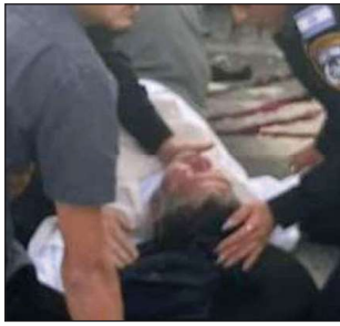
لحظة نقل بن غفير إلى المستشفى

وفي السياق، ذكرت صحيفة "يديعوت" و"القناة 13" الاسرائيليتين حادثة انقلاب سيارة وزير الامن القومي الاسرائيلي يتيمار بن غفير قرب مكان العملية، وأنه تم نقله الى المستشفى اثر اصابته في الحادث.