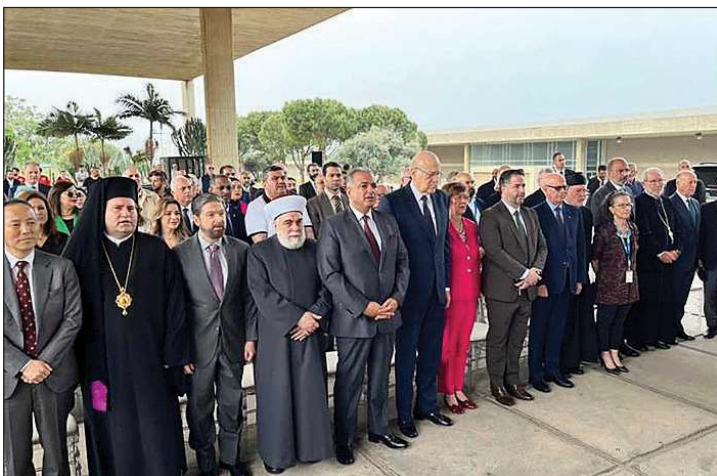
الاحتفال في المعرض

على ما قام به، والشكر الأكيد إلى رئيسة بعثة لبنان لدى الاونسكو السفيرة سحر بعاصري التي قامت بجهد كبير منذ اليوم الأول لتوليها هذا المنصب، فمن اليوم الأول وأنا اتابع معها واتذكر تماما اليوم الذي أدرج فيه هذا المعلم على لائحة التراث العالمي كم شعرت في اتصالها بي بسرورها لهذا الأمر». وختم: «لبنان يقدر الفن ويقدر الهندسة المعمارية، لهذا اختير لهذا العام عضوا في اللجنة الأساسية التابعة للاونسكو لكي تختار المعالم الأساسية في العالم، وهذا دليل على أننا لسنا طارئين على هذا الموضوع بل اساس فيه، فنحن نقدر الفن والثقافة والهندسة المعمارية ولهذا السبب اختير لبنان ليكون له دور كبير في اختيار المعالم الأخرى، ويبقى لنا جميعا الدور لنقوم بما يلزم كي نستثمر هذه المنشأة لتكون حقيقة أسما على مسمى تحمل اسم الرئيس رشيد كرامي الذي أعطى الكثير لهذا البلد وكان قدوة في الوطنية والعروبة».