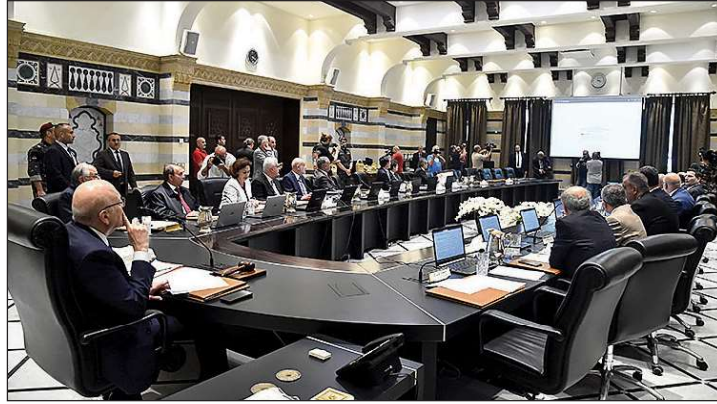
جلسة مجلس الوزراء

وأوضح ردا على سؤال ان «وزير الدفاع هو من قرر عدم المشاركة في جلسات مجلس الوزراء، وهذا امر يعود له». وأعلن وزير المالية يوسف خليل، بعد مغادرته الجلسة، أن «لا تأخير في رواتب موظفي القطاع العام والعسكريين كما أشيع»، وقال: «سيعمل موظفو الوزارة يوم غد السبت. وإذا اضطروا يوم الأحد من أجل تأمين الرواتب في وقتها».