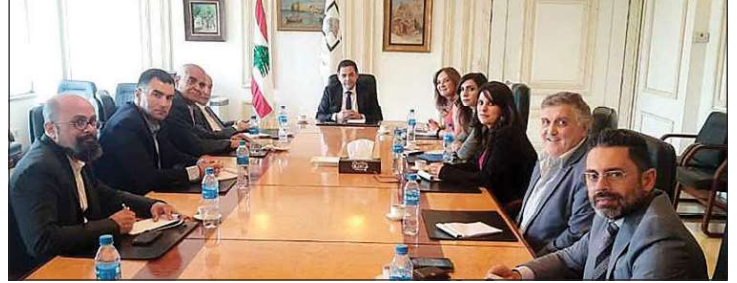
منصوري مع الاعلاميين الاقتصاديين

الشرق - شدد حاكم مصرف لبنان بالإنبابة الدكتور وسيم منصوري على «ضرورة وضع أسس هيكلية القطاع المصرفي لأنه لا يمكن النهوض بالاقتصاد من دون قطاع مصرفي سليم»، مشيراً إلى أن «تحقيق هذا الامر لا يعود لمصرف لبنان، بل على الدولة ان تضع القوانين اللازمة»، معتبرا ان هناك اربعة أسس يجب البناء عليها: المحاسبة في القضاء، إعادة أموال المودعين من خلال خطة واضحة مع رفع السرية المصرفية، بناء الاقتصاد عبر قطاع مصرفي سليم، وإعادة هيكلة مؤسسات الدولة أي إنجاز الإصلاحات المطلوبة». وأكد أنه لن يسمح بأن يكون لقرارات مصرف لبنان أي خلفية سياسية، مشيداً بالموظفين الذين يتعاون معهم في مصرف لبنان فهم يتمتعون بكفاءات وخبرات عالية. وأوضح أن تأخر بعض المصارف في تطبيق التعميم ١٦٦ ربما يعود إلى عدم إنجاز البت بالطلبات، داعياً المواطنين إلى التصريح عن أي تأخير لتتم معالجته. اما استمرار العمل بسعر صرف على أساس ١٥ ألف ليرة في المصارف، فأكد منصوري ان لا علاقة للبنك المركزي بهذا السعر، بعدما أعلن سعر الصرف الرسمي على كل منصاته وتعاملاته. وكانت عويس قد شكرت منصوري على إتاحة الفرصة امام نقاش بناء حول التحديات الاقتصادية والمالية والنقدية، داعية مصرف لبنان إلى مزيد من الضغط من اجل اقرار القوانين الإصلاحية الآيلة إلى إعادة تنشيط القطاع المصرفي، تمهيداً لتأمين عودة الودائع إلى اصحابها في ظل تقاعس السلطة السياسية عن القيام بواجباتها. ثم جرى حوار مع الحاكم ردّ فيه على الأسئلة.