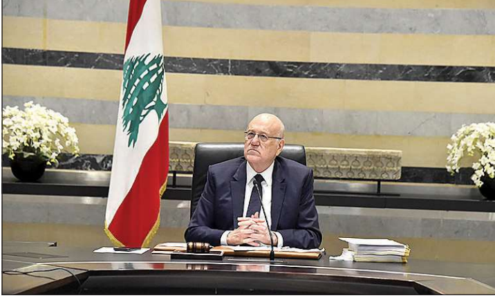
ميفاتي مترئساً الجلسة

خلالها لليوم الباهت سياسياً، تحفل عطلة نهاية الأسبوع بالمحطات ذات الدلالات رئاسياً وأمينياً، مع زيارتي وزير خارجية فرنسا ستيفان سيجورنيه غداً والبحرين عبداللطيف بن راشد الزياني الاحد.