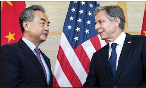
بليكن ونظيره الصيني

تلعب دوراً لردع إيران ووكلائها من تكون إيجابية في محاولة تهدئة تأجيج الصراع في الشرق الأوسط التوترات ومنع التصعيد وتجنب . أعتقد أن علاقات بكين يمكن أن انتشار النزاع.