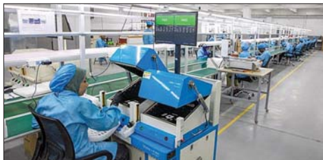
مصنع في المنطقة الصناعية في قناة السويس

معدلات الفائدة. وتشير الفروق الائتمانية المنخفضة وارتفاع إصدار السندات إلى زيادة شهية المستثمرين للاستثمار في سندات الأسواق الناشئة.