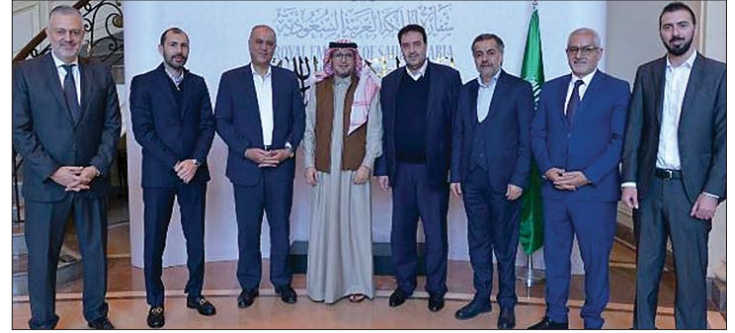
بخاري مستقبلاً نواب «الاعتدال»

الشرق - استقبل سفير المملكة العربية السعودية في لبنان وليد بخاري في مقر إقامته في البرزة، تكتل «الاعتدال الوطني» الذي ضم النواب: وليد البعيني، محمد سليمان، عبد العزيز الصمد، أحمد رستم، سجيح عطية، أحمد الخير وأمين السر التكتل النائب السابق هادي حبيش، وتم البحث في التطورات في لبنان والمنطقة، والجهود الجارية لوقف إطلاق النار، وسبل تحريك ملف انتخاب رئيس للجمهورية. ووجه التكتل «تحية شكر وتقدير للمملكة العربية السعودية على وقوفها الدائم إلى جانب لبنان وشعبه، وحرصها على استقراره، ومساعدتها، بتوجيهات من خادم الحرمين الشريفين الملك سلمان بن عبد العزيز وولي عهده الأمير محمد بن سلمان، إلى نصرته لبنان واللبنانيين في مواجهة العدوان وتداعياته، وذلك من خلال الجسر الجوي المفتوح للعمل الاغاثي والانساني، والقمة العربية - الإسلامية التي انعقدت في الرياض دعماً لغزة ولبنان، تأكيداً من مملكة الخير على أن لبنان كان وسيبقى مسؤولية عربية لا يمكن أن تتخلى عنها».