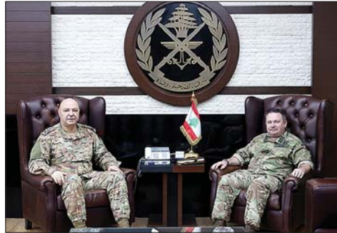
لقاء عون والادميرال البريطاني

الشرق - استقبل رئيس مجلس النواب نبيه بري في مقر الرئاسة الثانية في عين التينة كبير مستشاري وزارة الدفاع البريطانية لمنطقة الشرق الأوسط وشمال إفريقيا الأدميرال إدوارد أغرين والوفد العسكري المرافق بحضور السفير البريطاني في لبنان هاميش كاول، وجرى البحث في تطورات الاوضاع السياسية والمجديانية في لبنان والمنطقة. بعد اللقاء، قال السفير البريطاني: «أريد فقط أن أقول إننا عقدنا اجتماعاً جيداً جداً مع دولة الرئيس نبيه بري لتو وقد قمت بهذه الزيارة لأسباب خاصة تتعلق بالشرق الأوسط، ونحن رسمياً نعمل جنباً إلى جنب مع لبنان للقيام بكل شيء يمكننا في هذه اللحظة الحرجة أن نساعد ونتابع جهود وقف إطلاق النار عن كثر في لبنان وعلى رأس ذلك دعمنا لقوى الجيش اللبناني وعقدنا اجتماعاً جيداً للغاية مع قائد الجيش».