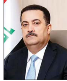
محمد شيعان السوداني

يُجري العراق الأربعة والخميس تعداداً شاملاً للسكان والمساكن على كامل أراضيه للمرة الأولى منذ أربعة عقود بعدما حالت حروب وخلافات سياسية شهدها البلد المتعدد الإثنيات والطوائف من دون ذلك.