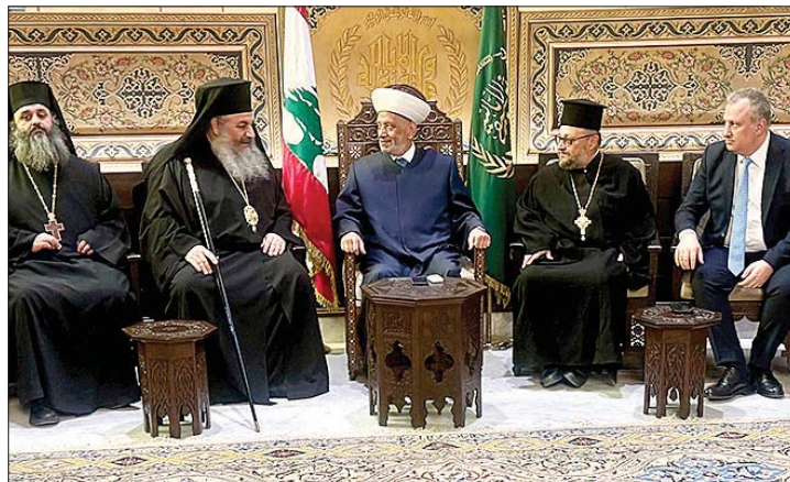
دريان مستقبلاً المطرانين

الجميع وإرشاد القادة الروحيين، يسير هذا البلد نحو الاستقرار وبناء دولة القانون والمؤسسات التي لديها فرصة كبيرة اليوم بأن تبني بوجود المسؤولين الحاليين من فخامة الرئيس جوزف عون إلى دولة الرئيس نواف سلام»، وقال: «رجاؤنا كبير بأن زمن النهضة وبنيان الدولة آتٍ (...)».