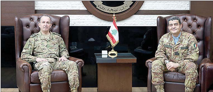
لقاء هيكل وقائد اليونيفيل

استقبل قائد الجيش العماد رودولف هيكل، في مكتبه في البرزة، قائد قوة الأمم المتحدة الموقفة في لبنان - «اليونيفيل» اللواء ديوداتو أبانيارا، وتم التداول في سبل التعاون والتنسيق بين الجيش و «اليونيفيل».