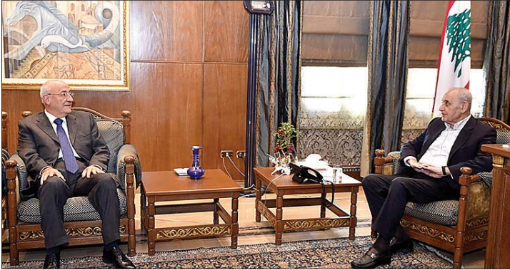
بري مستقبلاً العريضي

استقبل رئيس مجلس النواب نبيه بري في مقر الرئاسة الثانية في عين التينة، الوزير السابق غازي العريضي حيث تم عرض لتطورات الأوضاع العامة واستقبل بري النائب الاول لحاكم مصرف لبنان وسيم منصوري.