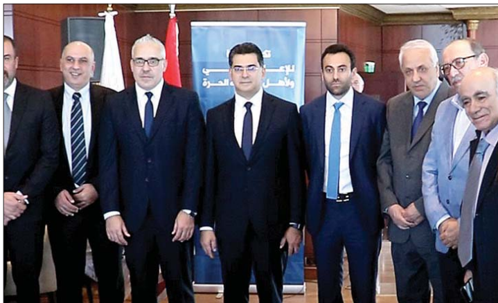
مرقص في الاحتفال التكريمي

الى ان «الغرافيك لم يعد فئاً مكمل بل لغة اعلامية كاملة التأثير». واكد «دعم وزارة الاعلام كل المبادرات التي تحمي حرية التعبير وتنظم المهنة دون تقييدها».