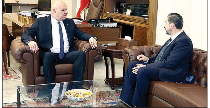
لقاء عون وكرامي

شهد قصر بعثا أمس، لقاءات سياسية ودبلوماسية وتعليمية. وفي السياق استقبل رئيس الجمهورية العماد جوزاف عون رئيس حزب الكتائب اللبنانية النائب سامي الجميل الذي هنأه «على الخطوة التي اتخذها بتعيين السفير سيمون كرم كرأس التفاوض اللبناني في هذه الازمة الكبيرة التي نمر به (...)»، معتبرا انه «لن يكون هناك استقرار ما لم نقفل بشكل نهائي جبهة جنوب لبنان، وهذا الامر لن يتحقق الا بالتفاوض». وشدد الجميل ان «على الجميع ان يواكب خطوة فخامة الرئيس، ويقف الى جانب الدولة اللبنانية بكل أركانها من رئاسة الجمهورية الى رئاسة الحكومة والمجلس النيابي. علينا جميعا ان نكون يدا واحدة وندفع باتجاه انتهاء حالة الحرب الموجودة في لبنان وعلى حدوده منذ أكثر من خمسين سنة (...)». واستقبل عون النائب فيصل كرامي، الذي أكد «أن الزيارة هي لتجديد التأييد والدعم لمواقف الرئيس عون، خصوصا في هذه الظروف ولمناقشة آخر المستجدات. ومن زوار الرئيس عون: سفير اليابان في لبنان Maghoshi Masayuki في زيارة وداعية، رئيس جامعة رفيق الحريري الدكتور سعيد لادقي ومجموعة من خريجي الجامعة الأميركية والأمين العام المساعد للأمم المتحدة سابقا السيد جان بول لابورد وتداول معه في الأوضاع العامة في لبنان والمنطقة. على صعيد آخر، تلقى الرئيس عون المزيد من برقيات التهنية بالاستقلال، أبرزها من سلطان عمان هيثم بن طارق، وأمير دولة الكويت مشعل الأحمد الجابر الصباح، وملك اسبانيا فيليب السادس وولي عهد الكويت صباح خالد الحمد الصباح.