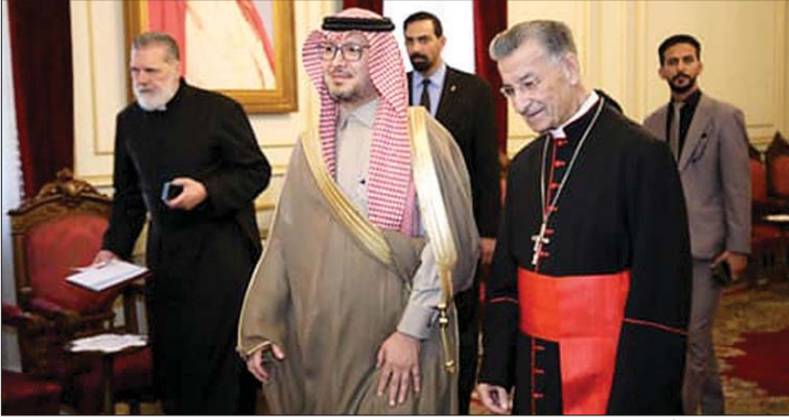
الرابع مستقبلاً بخاري

إحدى الجهات. يهم قيادة الجيش أن تنفي صحة هذه المعلومات نفياً قاطعاً، وتؤكد أن جميع عناصرها يملكون عقيدة عسكرية واضحة وثابتة، ويدينون بالولاء الكامل للمؤسسة العسكرية والوطن. كما تدعو إلى عدم تناقل الأخبار المشبوهة التي تهدف إلى النيل من سمعة الجيش، خاصة خلال المرحلة الحالية الدقيقة التي يشهدها وطننا".