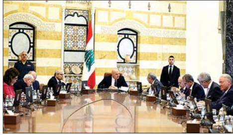
عون مترئسا جلسة مجلس الوزراء

والتعليم العالي مسألة تفرغ الأساتذة المتقاعدين في الجامعة اللبنانية، فوافق المجلس على الآلية والمعايير للتفرغ، وطلب منها الاجتماع مع وزير المال لدراسة الكلفة المالية لهذا التفرغ والعودة إلى مجلس الوزراء مع بيان سبل تأمين الاعتمادات المطلوبة، كي يأخذ المجلس قراره بهذا الخصوص. ودار حوار مع وزير الإعلام المحامي د. بول مرقس الذي تلا المقررات الرسمية، فأشار رداً على سؤال «أن قائد الجيش ملتزم بالمهل التي وضعتها الحكومة وبالمرحلة التي كان قد أشار إليها والتي لا تزال ماثلة وأولها ما يتعلق بالاعتداءات الإسرائيلية واستمرار الاحتلال، وبعض الحاجات الموضوعية للجيش لتمكينه من أداء هذه المهام الكبيرة الملقة عليه. وقد اتنى مجلس الوزراء على جهود الجيش، خصوصاً عند إشارة قائده إلى كل المهام التي يقوم بها وليس فقط في جنوب الليطاني (...)». وقال: «اما في موضوع القوات الدولية وولاية اليونيفيل، فسيتم بحث هذا الامر في اجتماع دولة الرئيس مع وفد مجلس الامن الدولي، وقد يؤدي ذلك الى اعتماد خيارات معينة تتعلق بطبيعة وجود قوات دولية وعددها، يمكن ان يشابه القوات الموجودة في الجولان، وقد طرح ذلك ضمن الخيارات». وردا على سؤال، عما اذا كانت الحكومة ستفاوض الحكومة، بعد تعيين السفير سيمون كرم، باستراتيجية معينة ام فقط استجابة للوساطة الأميركية؟ قال مرقس: «هناك استراتيجية قائمة على الانسحاب الاسرائيلي، وإعادة الاسرى، ووقف الاعتداءات وصولاً الى الخط الذي يفصلنا، وعلى الحشد الدبلوماسي وإبراز احقية مصلحة لبنان العليا في تحرير أراضيه والاستقرار المنشود بناء لما ذكرته، وهناك شكوى جديدة تقدمنا بها الى مجلس الامن، ونحن لا نوفر سبلاً مع الأصدقاء والأشقاء لحشد الدعم للموقف اللبناني، ولكن يهدف الوصول الى الاستقرار المنشود».