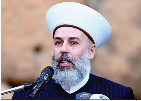
الشيخ بكر الرفاعي

أكد مفتي محافظة بعلبك الهرمل الشيخ الدكتور بكر الرفاعي أن «الإسلام يدعو إلى السلم الأهلي والتعايش القائم على العدل والاحترام المتبادل، حيث تُضامن الكرامة الإنسانية ويشعر الناس بالأمان على أنفسهم وأموالهم وحقوقهم». ولفت في خطبة الجمعة إلى أن «التعايش لا يقوم على الذوبان أو تجميع الثوابت، بل على إدارة الاختلاف بوعي ومسؤولية، مما يحفظ استقرار المجتمعات ومنع تحول التنوع إلى صراع». وتطرق إلى التحديات الإقليمية، مشدداً على أن «الخطر الصهيوني يبرز بوصفه تهديداً شاملاً لأهل المنطقة بمختلف طوائفهم ومذاهبهم، دون تمييز بين مسلم ومسيحي. وقد كان مسيحيو فلسطين من المتضررين من الاحتلال، حيث تعرضوا للتهجير والتضييق على وجودهم وحرّيتهم وكنائسهم،