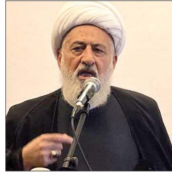
الشيخ علي الخطيب