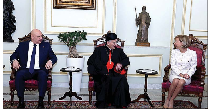
الراعي مستقبلا عون وعقيلته

اعتداءات آخرها اليوم في الجنوب والبقاع. ان شاء الله نشهد ولادة لبنان الجديد وننتهي من الحروب ونعيش السلام.»