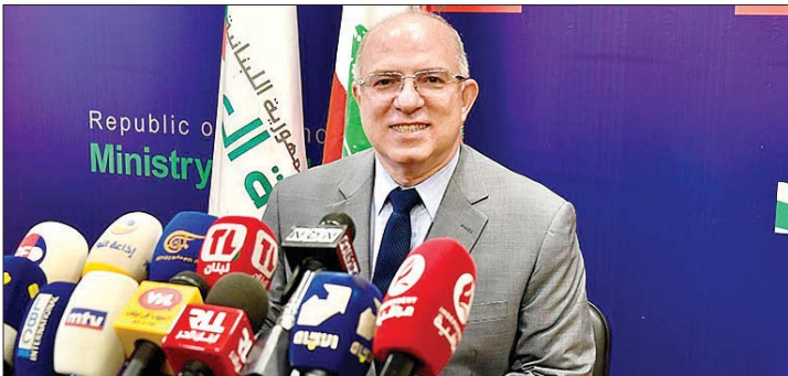
وزير العمل محمد حيدر

استناداً الى مقتضيات المصلحة العامة، وتأكيداً على ما ورد في المادة ١٢ من القرار رقم ١/٧٤ تاريخ ٢٠٢٥/٠٧/٠١ (تنظيم عمل مكاتب استقدام العمالات الاجانب في الخدمة المنزلية) وحرصاً على التزام لبنان بمعايير العمل التي نصت عليها المواثيق العربية والدولية، اصدر وزير العمل الدكتور محمد حيدر مذكرة تتعلق بحظر الاعلان والترويج للمكاتب وجاء فيها: أولاً: يحظر على اصحاب مكاتب استقدام العمالات