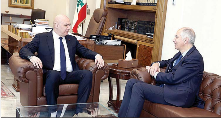
لقاء عون والسفير الفرنسي