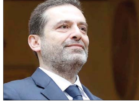
الرئيس سعد الحريري

وأن لهم أن يرتاحوا وينعموا بوضع لبنان أولاً قبل أي اعتبار بالاستقرار وأن يقتنع الجميع آخر».