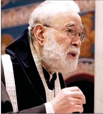
المطران الياس عودة

يقود الكنيسة اليوم، وسيقود حياتنا، إذا سلمناه ذواتنا بتواضع وإيمان وطاعة.