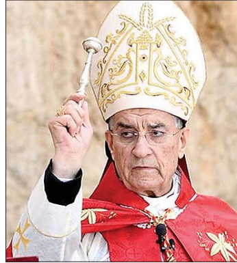
البطريرك بشارة الراعي

وأن تجمع. أما حين تُفَرَّغ من الحقيقة، وتُسَـمَل لتضليل أو التحريض، فإنها تهدم وتُقسّم». وقال: «لبنان اليوم بحاجة إلى كلمة تتجسد: كلمة حق تتحول فعلاً، كلمة مصالحة تتحول قراراً، وكلمة وعد تتحول التزاماً». وأكد الراعي «أن وطننا لا يحتاج فقط إلى خطابات، بل إلى كلمات تعاش، تُترجم سياسات عادلة، وخيارات وطنية صادقة. إنجيل التجسد يمكن أن يُقرأ كدعوة وطنية: إلى أن نُنزِل المبادئ إلى أرض الواقع، وأن تتحول القيم إلى مؤسسات، وأن يصبح الكلام مسؤولية، بكلمة صادقة يمكن أن يبدأ خلاص وطن، وبكلمة جامعة يمكن أن يُبنى وطن يجمع الكل، لا يُقصي أحداً، بل يحمي كرامة الجميع (...)».