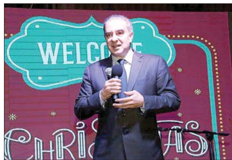
الوزير ميشال فرعون

على الأهالي للمساهمة في إضفاء أجواء من البهجة على موائد العيد، بما يعزز روح التعاون بين أفراد المجتمع ويزرع الفرحة في قلوب الأطفال، ليكون العيد مساحة جميلة من الفرحة والأمل.