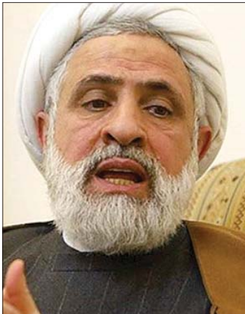
الشيخ نعيم قاسم

يُريدونها من هذا المسار الذي عنوانه الأساس نزع السلاح؟ النتيجة يُريدون إنهاء المقاومة ومعها ضم جزء من لبنان وتحويل باقي لبنان إلى أداة تديرها أميركا وإسرائيل.