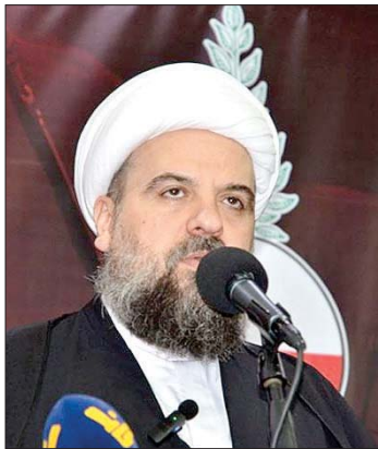
الشيخ أحمد قبلان

البلد، ويجب أن نتذكر جميعاً أنّ إسرائيل ضد الأرض والتاريخ والجغرافيا والتراث ولا تملك إلا صهيونية القتل والاحتلال والإرهاب، ولا يمكن إلا أن نكون بالموقع الذي يحمي لبنان ووجوده وقدرته السيادية والإستقلالية».