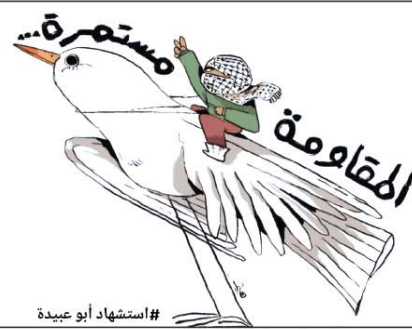
رسم توينز كرتون (مصر) 2025