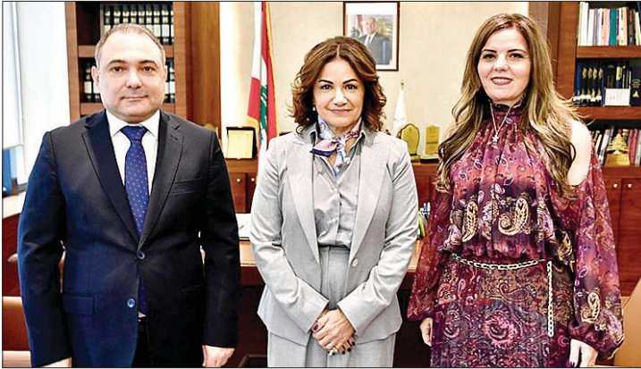
الوزيرة السيد والسيد

لواقع الحدود تاريخياً وما أدى إلى تداخل الأراضي بين البلدين ولا سيما في المناطق الممتدة من القاع إلى الهرمل وأكروم. كما لفتت إلى تبعات الأحداث الأخيرة وما نجم عنها من معاناة لسكان ٣٤ قرية داخل الحدود السورية يعيش فيها أكثر من ٣٥ ألف شخص لبناني وما يجعلهم ضحايا للأزمات الطارئة التي لم يكن لهم فيها أي رأي أو مسؤولية بقدر ما كانوا من ضحاياها، ولا سيما أولئك الذين اضطروا إلى ترك منازلهم وأعمالهم، وتوقف الأطفال عن الدراسة، وارتفاع البطالة القسرية والتشرد والفقر. وهي أزمة اضيف إليها وجود ما يقارب ٨٠ ألف نازح سوري جديد معظمهم من الشيعة إلى لبنان، ما خلق ضغطاً هائلاً على مناطق صغيرة غير مجهزة لتلبية الاحتياجات المعيشية والصحية. وقدمت المذكرة مجموعة الاقتراحات العملية متمنية على الوزارة السيد بنقل مضمونها إلى رئيس الحكومة وزملائها المعنيين بمختلف وجوه حياة هؤلاء والمرامح المعنية لمعالجتها.