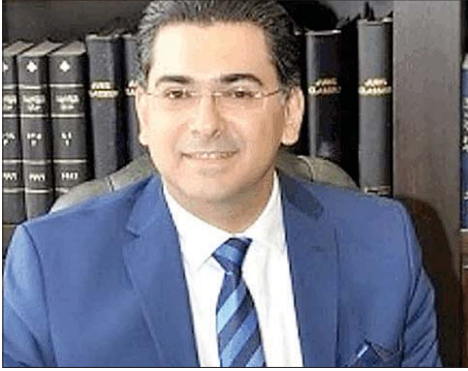
الوزير بول مرقص

استقبل وزير الإعلام المحامي د. بول مرقص، في مكتبه بالوزارة، سفيرة مملكة السويد جيسيكا سفارستروم، التي نوهت بجهوده في الوزارة ودوره في تطوير الإعلام اللبناني بشكل عام. وأكدت السفيرة خلال اللقاء «أهمية تعزيز وتعميق العلاقات المشتركة بين لبنان والسويد في مختلف المجالات». والتقى أيضاً، وفداً من «حركة التلاقي والتواصل» ووفود وشخصيات قدمت له التهاني لمناسبة الأعياد.