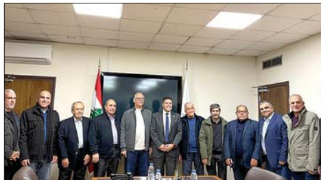
وفد المختاير في المرفأ

تبادل وجهات النظر حول قضايا وهم أبناء المدينة، انطلاقاً من دور المرفأ التاريخي والاقتصادي كقلب نابض لبيروت ورافعة أساسية لصمودها ونهوضها. من جهته، رحب النفي بالوفد، معرباً عن تقديره لهذه الزيارة، مؤكداً حرصه على تعزيز التواصل والتعاون مع مختاير بيروت وسائر المجاليات المحلية، بما يخدم مصلحة المدينة وأهلها، ويُعيد لمرفأ بيروت مكانته الطبيعية كجزء لا يتجزأ من هوية العاصمة ومستقبلها.