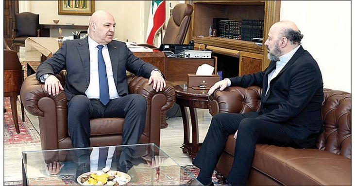
عون مستقبلاً الرياشي

الفجوة المالية الذي أحيل إلى مجلس النواب. علينا مقاربة هذا الملف بين حدين، الأول هو أنه يجب إقرار مشروع قانون بهذا الخصوص، والعودة إلى الانتظام المالي، لنتمكن من إعادة الثقة بلبنان، وبناء القطاع المصرفي، وإعادة الاستثمار، ووضع حد للاقتصاد الأسود، واقتصاد الكاش، الذي يربط جزء منه بملف السيادة. والحد الثاني، هو إصرارنا على أن أي مشروع قانون يجب أن يكون عادلاً، وركيزته الأساسية رد الأموال المشروعة للمودعين، ولو بطريقة تدريجية، لأنه من الواضح أنه لا يمكن رد الأموال في فترة قصيرة.