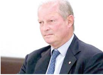
النائب كميل شمعون