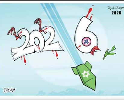
رسم خالد صلاح (مصر) 2025