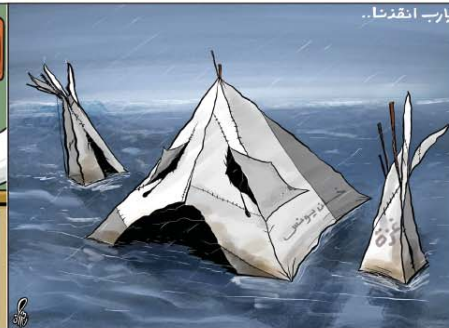
رسم حمزة حجاج (الأردن) 2025