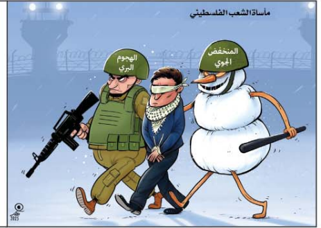
رسم فهد البهادي (سوريا) 2025