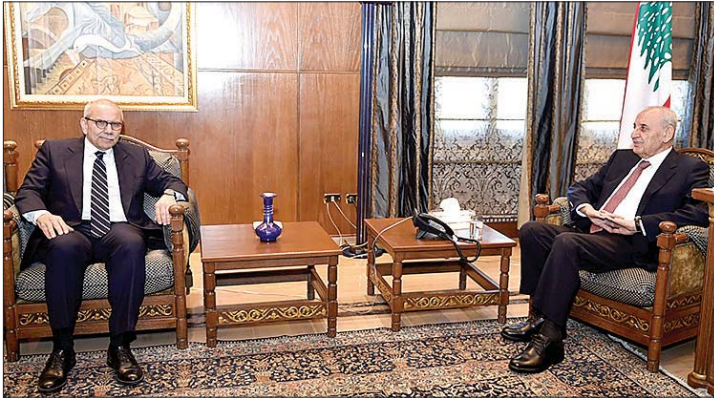
لقاء بري وسلام

مشروع لديه وكيف يريد تنفيذه وما هي الميزانية والامكانية وفق جدول زمني واضح. وقد كان الرئيس عون مستمعاً ومؤيداً، ودأبها نحب اللقاء معه. ونحن فخورون بهكذا رئيس للجمهورية وبأداء مميز بالفعل، على أمل ان تكون السنة المقبلة افضل، وسنة إنتاجية ورخاء وازدهار للبنان.