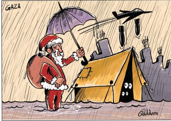
رسم أحمد قدورة (فلسطين) 2025