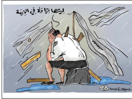
رسم حسين زقوت (فلسطين) 2025