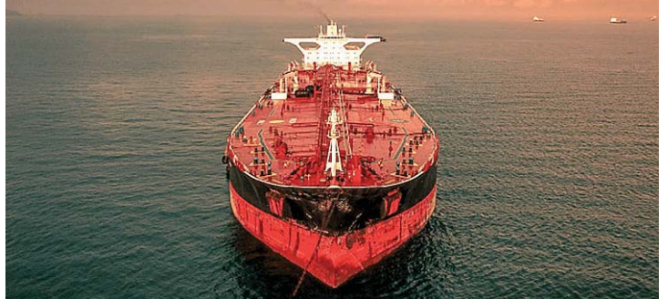
الباحرة Mount mckinney