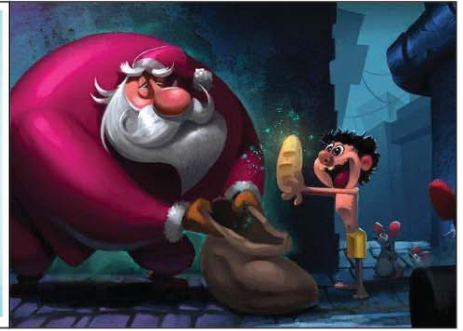
رسم إسلام فكري (مصر) 2025