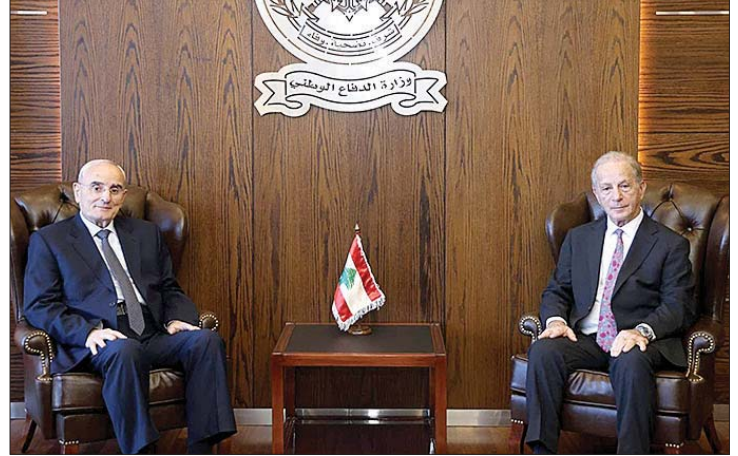
لقاء منسّى والسفير الأميركي

استقبل وزير الدفاع الوطني اللواء ميشال منسى في مكتبه في اليرزة، سفير الولايات المتحدة الأمريكية لدى لبنان ميشال عيسى، في زيارة تعارف ومعايدة. وجرى خلال اللقاء بحث العلاقات الثنائية بين البلدين.