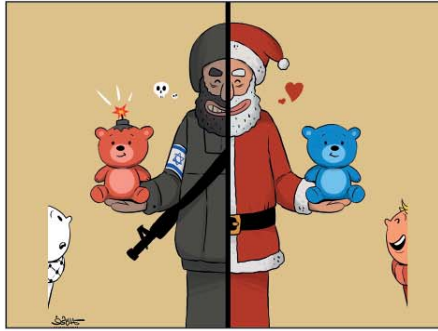
رسم كمال شرف (اليمن) 2025