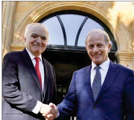
لقاء سلامة وعيسى

استقبل وزير الثقافة غسان سلامة في مكتبه في المكتبة الوطنية - الصنائع، سفير الولايات المتحدة الأميركية في لبنان ميشال عيسى في زيارة بروتوكولية، لم تخل من التطرق إلى الأوضاع العامة في لبنان والمنطقة، إضافة إلى العلاقات الثنائية بين البلدين على مختلف الأصعدة لا سيما الثقافية منها وأهمية تفعيل التعاون في إطار دعم التبادل الثقافي وتعزيز العلاقات الثنائية.