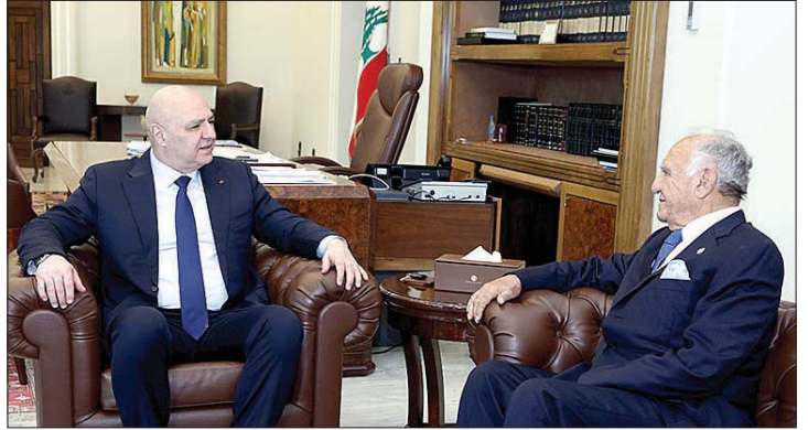
لقاء عون وإيلي سالم

عرض رئيس الجمهورية العماد جوزاف عون مع وزير الدفاع الوطني اللواء ميشال منسى الأوضاع الامنية في البلاد عموماً وفي منطقة الجنوب خصوصاً في ضوء المهام التي يتولاها الجيش في منطقة جنوب الليطاني. كما تناول البحث نجاح الاجراءات التي اتخذها الجيش والقوى الامنية الاخرى لحفظ الامن ليلة رأس السنة، إضافة الى مهام امنية اخرى نفذها