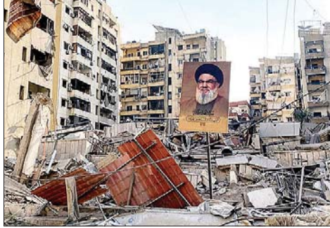
الدمار في لبنان

الهيكلية، مثل إصلاح القطاع العام ومحاربة الفساد، وإعادة هيكلة الدين العام: لإعادة التوازن إلى الاقتصاد، وتطوير البنية التحتية للطاقة والاعتماد على موارد مستدامة، والعمل على تحفيز القطاع الخاص، خاصة ريادة الأعمال والصناعات الصغيرة والمتوسطة. ولعل الأبرز والأهم هو استعادة الثقة الدولية لضمان تدفق المساعدات والاستثمارات الأجنبية للنهوض الاقتصادي. لبنان بحاجة إلى دعم دولي وإقليمي مستدام، ولكن هذا الدعم مشروط بالإصلاحات الحقيقية. المجتمع الدولي لن يدعم لبنان ما لم يَرِ التزاماً واضحاً بالشفافية وتحقيق العدالة الاجتماعية. الحكومة الجديدة، إذا رأت النور دون مناكفات سياسية وعراقيل - وهي معهودة في لبنان - أمام فرصة لإعادة رسم المسار الاقتصادي وإظهار نيات جادة للإصلاح. دعم الشعب واضح، لكن النجاح يعتمد على قدرة الحكومة على الاستفادة من هذه اللحظة التاريخية لإطلاق مشاريع جذرية بدلاً من حلول ترقيعية.