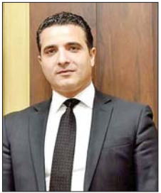
النائب إيهاب مطر

كتب النائب إيهاب مطر عبر منصة «اكس»: «يبدو أن العام ٢٠٢٦ سيكون مزدهراً بالأحداث الكبيرة على بلدنا الصغير. وإذ كنا أمام الإحتمالات المندرة بالشؤم لموضوع «السلح غير الشرعي» فإننا الآن أمام خطر «الفلول» الذي يهدد أمن لبنان مثلما يهدد أمن سوريا الجديدة. ونحن لا نشك بناتاً بنية السلطات الجديدة، في البلدين الشقيقين، فإننا نتمنى إيلاء قضية الفلول المزيد من المتابعة والتنبه والتنسيق على كل المستويات بين بيروت ودمشق لأن الخطر مشترك، مع الدعوة الى إبقاء العين الأمنية مفتوحة على الشمال وعكار، حيث التماس مع الحدود السورية، وسط خشية الأهالي من أي فتنة تحرك اضطراباً أمنياً جديداً».