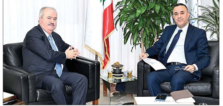
لقاء جابر وبيضون

أكد وزير المالية ياسين جابر الحرص والاهتمام الخاصين على تطوير التعليم المهني والتقني في لبنان، والسعي لتعزيز كل ما يرفع مستواه إلى ما تقتضيه الاستجابة للحاجات التي تتماشى مع التقدم والتحديث العالمي المتنامي. وقال أمام وفد من ممثلي اساتذة التعليم المهني حضر برفقة النائب أشرف بيضون إننا نتطلع إلى التعليم المهني كواحد من ركائز البنية التعليمية القادر على رفد القطاعات الاقتصادية بالطاقات والكادرات المنتجة.