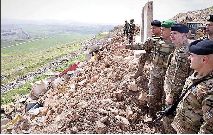
العماد هيكل خلال جولة تفقدية سابقة جنوب الليطاني