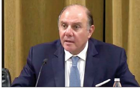
سعيد يتحدث في المؤتمر

إن مصرف لبنان لا يسعى إلا إلى استرداد أموال من أشخاص أسأوا استعمال وظيفتهم وخالفوا واجب الأمانة والعناية والولاء لمهامهم أكانوا في مصرف لبنان أو كانوا شاغلين مناصب في مصارف خاصة أو في مكاتب إستشارية وانتهكوا القوانين والأنظمة التي تحكم عمل المصرف المركزي، بهدف وحيد وهو الإثراء غير المشروع. ومن هنا، فإن مهمتنا تتمثل في ملاحقة هؤلاء الأشخاص والجهات، وطلب إدانتهم قضائياً، وحجز أموالهم المنقولة وغير المنقولة وعائدات أفعالهم غير المشروعة، لتأمين السيولة لأصحاب الحقوق، وفي مقدمتهم المودعون.