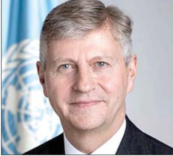
جان بيير لاكروا

ظروف خطيرة. وقال: «يستمر عملهم اليومي لدعم الأمن والاستقرار الإقليميين رغم المخاطر المستمرة التي تهدد سلامتهم وأمنهم». وغادر لاكروا لبنان صباح أمس متوجهاً إلى سوريا لزيارة قوة الأمم المتحدة لمراقبة فض الاشتباك (أندوف) ومواصلة جولته في المنطقة.