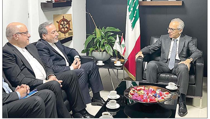
لقاء البساط وعراقجي

أدلى وزير الخارجية الإيراني عباس عراقجي الذي بدأ زيارة الى لبنان امس بتصريحات من أمام مرقد الامين العام لحزب الله السابق الشهيد السيد حسن نصر الله، شدد فيها على دعم بلاده لسيادة لبنان ووحدته اراضيها، مؤكداً استمرار دعم إيران لما وصفه بالمقاومة في مواجهة إسرائيل. وقال عراقجي: «أحيي وأسلم على أرواح الشهداء