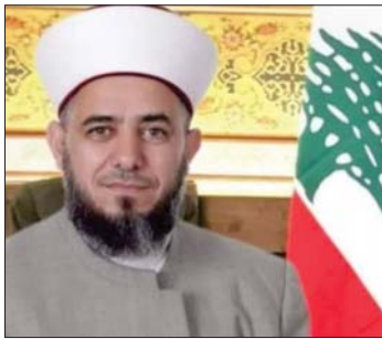
الشيخ وفيق حجازي

الإسلاميين وعدم تسييس الملف»، مؤكداً «وجوب إطلاق سراحهم»، معتبراً ان «قضية العفو العام حق أريد به باطل فلا يقبل ان ندين بريئاً ونبرئ مجرماً لنساوي بينهما فهذا ظلم بحد ذاته، بل يلزم التعويض على من سجن دون محاكمة وثبتت براءته لإعادة الاعتبار له وتعويضه عن ظلم لحق به».