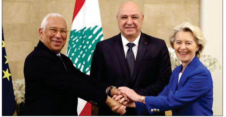
عون ودير لاين وكوستا

بعض الدول الأوروبية ببقاء قوات منها في الجنوب اللبناني بعد انتهاء عمل قوات اليونيفيل»، اعتبر الرئيس عون انه «أن الأوان لعودة النازحين السوريين الى بلدهم، بمساعدة الحكومة السورية وأوروبا أيضاً».