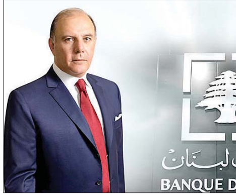
كريم سعيد حاكم مصرف لبنان