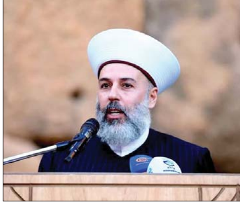
الشيخ بكر الرفاعي

في واقع الدولة لا سيما الواقع الاقتصادي»، لافتاً إلى أن «دار الفتوى هي بمثابة الوالدين، تُصان وتُحترم، ولا يكون الإصلاح فيها بالكسر أو التشهير، بل بالنصح الحكيم من داخل البيت وبأساليب التي تحفظ المقام ولا تضر بالطائفة، فالإصلاح الحقيقي يجمع ولا يفرق، وأما التطاول والتجريح فليس إصلاحاً بل عقوقاً يفتح أبواب الفتنة ويضعف الجمع».