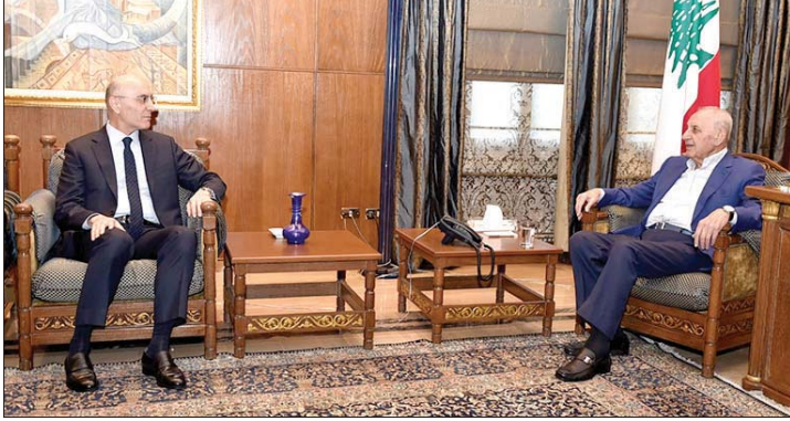
بري مستقبلاً الحجار

بهذا العام طبعاً دولة الرئيس كما فخامة رئيس الجمهورية ودولة رئيس الحكومة وأنا أكدت مراراً على كل التحضيرات التي نقوم بها لإجرائها إن شاء الله في مواعيدها.