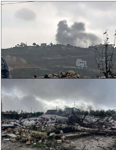
وصباحا، ألقي العدو قذيفة مارون الراس ما أدى إلى اندلاع ضوئية حارقة قرب حديقة حريق في المكان.

نفذ الطيران الحربي الاسرائيلي امس سلسلة غارات جوية عنيفة مستهدفة المنطقة الواقعة بين بلدتي كفريليا وعين قانا في منطقة اقليم التفاح، كما أغار الطيران الحربي الاسرائيلي على واد بين دير الزهراني وحومين الفوقا، واستهدفت غارة اسرائيلية بلدة البيسارية - صيدا، وبقاعا، استهدفت غارة جرد بريتال منطقة النبي اسماعيل. وشن الطيران الحربي المعادي سلسلة غارات استهدفت وادي جهنم في كفرحتي، كما اغار على تبنيا، وعلى المنطقة الواقعة بين العدوسية ومعمرية الخراب، واغار الطيران المعادي على المنطقة الواقعة بين الريحان وسجد بمنطقة جزين. وتسلسلت قوة معادية فجرا، الى حي البيادر في بلدة يارون في قضاء بنت جبيل، وعمدت الى تفخيخ وتفجير مبنى وتدميره.