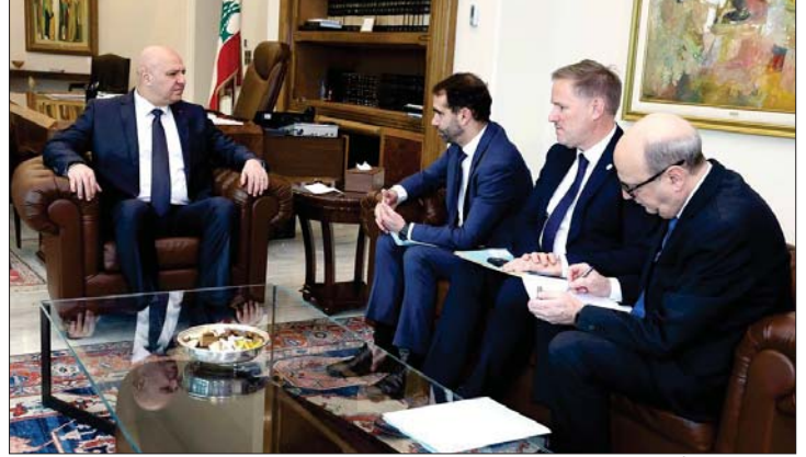
عون مستقبلاً وفد توتال

قدم الوفد عرضاً للرئيس عون حول مضمون الاتفاقية والمراحل التي تلي توقيعها، لا سيما ما يتصل بأعمال الاستكشاف، بما في ذلك التحضيرات التقنية واللوجستية، والجدول الزمني المتوقع لبدء الدراسات الزلزالية تمهيداً لتقييم الإمكانات البترولية في «البلوك». من جهته، شدد الرئيس عون على الأهمية الاستراتيجية والاقتصادية لهذا الملف بالنسبة للبنان، مؤكداً ضرورة المضي قدماً في تنفيذ الاتفاقية ضمن أطر زمنية واضحة، ومع احترام القوانين اللبنانية والمعايير المعمدة، ومجدداً استعداد الدولة اللبنانية لتقديم كل ما يلزم لتسهيل سير الأعمال بالتنسيق مع الجهات المعنية. كما تطرّق الاجتماع إلى ملف وحدة التخزين وإعادة التوزيع