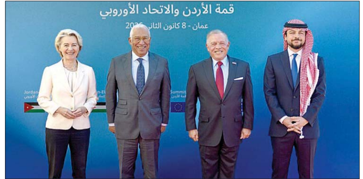
قمة الأردن والاتحاد الأوروبي