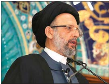
السيد علي فضل الله

من نزيه الدم والدمار ويعيد إليه حقوقه المشروعة وحقه بالسيادة على أرضه». ونوه بـ «الحكمة التي عبر عنها مجلس الوزراء في منع الفتنة التي كان يمكن أن تحصل بين اللبنانيين»، مشدداً على القوى السياسية «تجميد خلافاتها وصراعاتها والخروج من الخطاب المتشنج الذي لا يزال يعصف بالساحة الداخلية رغم كل التحذيرات التي تواجه هذا البلد من الداخل أو مما يعصف به من الخارج (...)». ودعا الدول العربية والإسلامية، إلى «دفع العدو للوفاء بالتزاماته في غزة وحفظ الوجود الفلسطيني داخل الضفة ومنع العدو من تنفيذ سياسته بتجريد أهلها منها»، معتبراً «أن ما حصل في فنزويلا لن تقف تداعياته على هذا البلد واستقلاله وحرية بل هو يشير إلى مرحلة جديدة دخل إليها العالم ويخشى من تداعياتها على الاستقرار الدولي ويجعل هذا العالم مستباحاً لمن يملك القوة (...)».