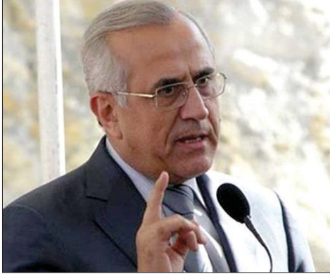
الرئيس ميشال سليمان

أو توتير». وبأتي هذا اللقاء في سياق حراك سياسي متصاعد يسبق الاستحقاق الانتخابي، ويعكس تقاطعاً على ثوابت وطنية جامعة، عنوانها الدولة، الدستور، والجيش.