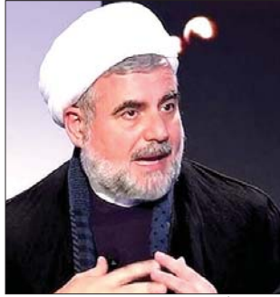
المفتي أحمد طالب

وخلص بتأكيد أن «المسؤولية تقع على عاتق الجميع في ترسيخ الوحدة الداخلية والمضي في ملف الإصلاح والنهوض وتهينة الساحة الداخلية لمواجهة العدوان الاسرائيلي ومخاطر توسعه واستمراره».