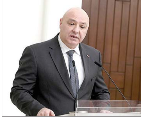
الرئيس جوزيف عون

إراثاً وطنياً ثميناً نعتز به ونستلهم العظيم هو أن نسير على نهجه في منه في مسيرتنا نحو بناء لبنان تغليب المصلحة الوطنية، واحترام الدولة القوية العادلة. إن التنوع، والعمل بواقعية من أجل أفضل تكريم لذكرى هذا الرجل لبنان حر وسيد ومستقل».