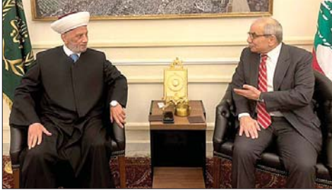
لقاء سلام والمفتي

الصخب السياسي والديبلوماسي الذي ملأ الفضاء اللبناني طوال الأسبوع بفعل المواقف الحكومية في شأن خطة الجيش لحصر السلاح معطوفة على الزيارات الإيرانية والأوروبية لاستطلاع آفاق المرحلة. هذا فجأة في نهاية الأسبوع حتى كاد ينعدم، فيما استمرت وتيرة التهديدات الاسرائيلية بشن عملية على لبنان على حالها.