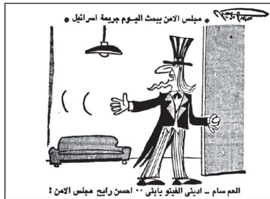
رسم صلاح جاهين (مصر) 1980 - 1980 By Salah Jahin (Egypt)