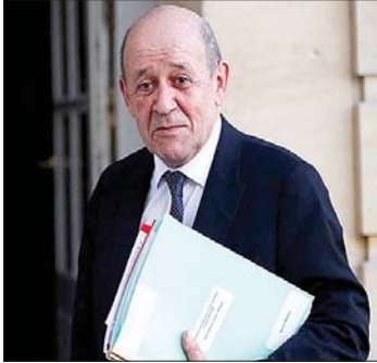
الموفد الفرنسي لودريان

مجموعة الخمسة الذين التقوا رئيس الحكومة نواف سلام في السراي الحكومي، وطالبوه بهذا الامر. وأشار المرجع اعلاه ان الحركة الدبلوماسية اللاتية الى لبنان خلال الايام المقبلة ستكشف مدى النوايا اللبنانية الصادقة والجديّة لانعقاد هذا المؤتمر، والسير فعلياً في تنفيذ المساعدات المطلوبة للجيش اللبناني. وأكد ان الكرة اليوم في الملعب الحكومي، وان اي خطوات عملية قد تساهم في تعزيز الامن والاستقرار في لبنان، وابعاد اي تهديدات اسرائيلية على لبنان. وفي النهاية تمّنت المصادر الدبلوماسية في باريس ما اعلنه رئيس الجمهورية العماد جوزف عون بعد مرور عام على توليه الرئاسة. وقالت كان خطاباً موزوناً، واضحاً، شفافاً وصريحاً. لم يخرج عن خطاب القسم، لكن كلامه اليوم طمان المجتمع الدولي والعربي ان لبنان سيسير على السكة الصحيحة، وان الإهمال والفساد الذي استشرى في ضلوع المؤسسات بات اليوم في عهدة الدولة على الرغم من الصعوبات الكبيرة من تطهيره نهائياً.