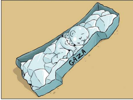
رسم كمال شرف (اليمن) 2026