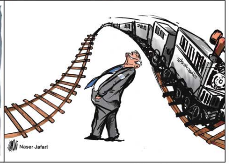
رسم ناصر الجعفري (الأردن) 2026