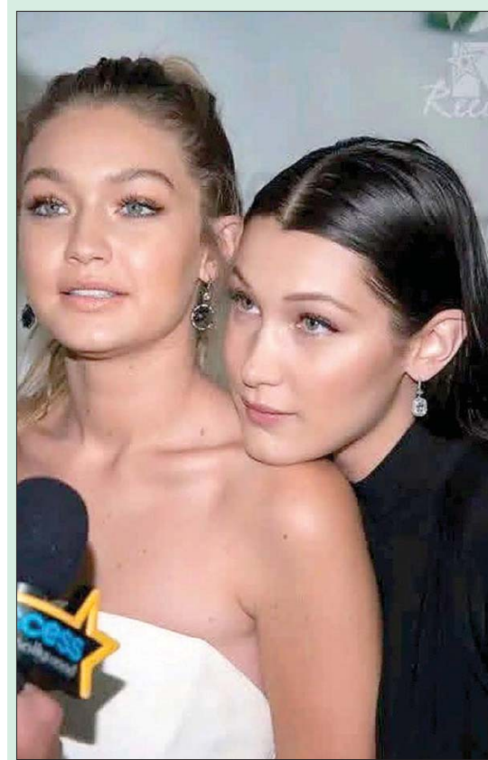
المجدد والتقدير لهذا الصحفي الذي استطاع الصمود أمام هذه النظرات.