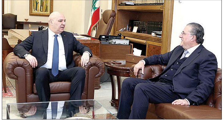
عون مستقبلاً شقير

المرجع اعلاه عرض معهما الواقع الراهن في البلاد، واطلعه على المبادرة التي يقوم بها «نادي الشرق لحوار الحضارات في لبنان» مع «المؤسسة الاجتماعية لحوار الحضارات في أستراليا»، التي تقضي بزراعة غابة أرز على مساحة ١٠٠ الف متر مربع في منطقة اويرون في سيدني قدمها المغترب اللبناني جورج سركيس، وسيتم نقل غرسات الأرز من لبنان، وبينها شجرة أرز سوف تحمل إسم رئيس الجمهورية العماد جوزاف عون. واعتبر النائب مطر ان هذا الحدث مهم للجالية اللبنانية في أستراليا، ومحطة أساسية للتأكيد على الرابط القائم بين لبنانيي أستراليا والمتحدرين من اصل لبناني والدولة الأسترالية التي استضافت على ارضها اعداداً كبيرة من اللبنانيين والمتحدرين من أصل لبناني. دبلوماسياً، إستقبل الرئيس عون ثلاثة سفراء لبنانيين معيّنين في الخارج هم: نديم صوري (السنتغال)، خليل محمد (العراق)، وسلام الأشقر (اندونيسيا)، وزوّدهم بتوجيهاته، متمنيا لهم العمل من اجل تعزيز العلاقات بين لبنان والدول المعتمدين فيها، والإهتمام بأوضاع الجاليات اللبنانية في هذه الدول. كما استقبل رئيس الجمهورية، رئيس الهيئات الاقتصادية الوزير السابق محمد شقير الذي قدم له التهنئة بالاعباد المجيدة وبالانجازات التي تحققت في السنة الأولى من عهده. وبعد