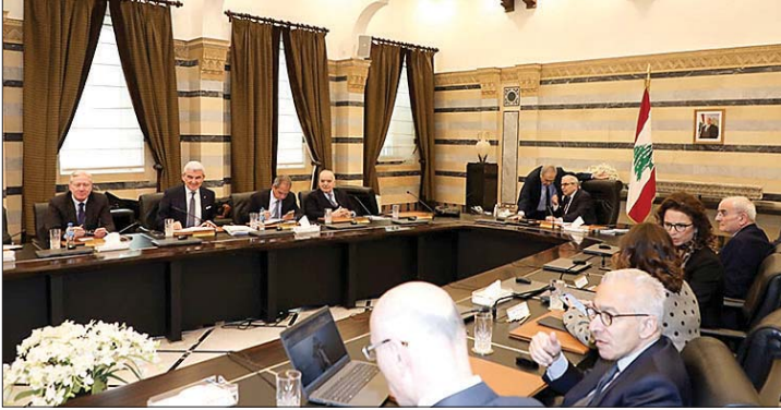
مجلس الوزراء في السراي

ورحب "بإنهاء المرحلة الأولى من خطة حصر السلاح جنوب الليطاني ويدعو إلى المباشرة السريعة بالمرحلة الثانية شماله واستكمالها بوتيرة سريعة بما يؤمن الأمن والاستقرار والسلام لأهالي الجنوب وسائر اللبنانيين". وأكد المكتب السياسي أنّ "حصر السلاح وبسط سلطة الدولة عبر تفريغ الساحة من أي جماعة مسلحة خارج الشرعية هو واجب لبناني ودستوري لا يخضع لأي اعتبارات سياسية أو فتوية، وهو مطلب ثابت لحزب الكتائب وحاجة وطنية ملحة، يعزل عن أي مطالب خارجية أو ضغوط من المجتمع الدولي". وشدد المكتب السياسي على أنّ "لا يمكن دعوة الهيئات الناجية في ظل القانون الانتخابي الحالي الذي تعتبره الحكومة غير قابل للتطبيق بصيغته الراهنة. ومن هنا، ندعو رئيس مجلس النواب إلى فتح جلسة عامة لمناقشة هذا الملف، بما يتيح تعديل القانون بصورة تُمكن المغتربين من الاقتراع لكامل أعضاء المجلس النيابي الـ 128 من مكان إقامتهم، احتراماً للمساواة الدستورية ولحقهم في المشاركة في الحياة السياسية في بلدهم الأم".