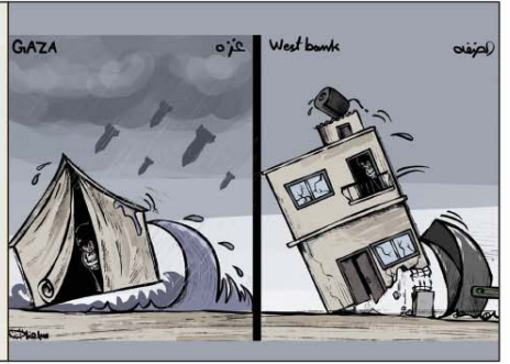
رسم محمد سباغة (فلسطين) 2026