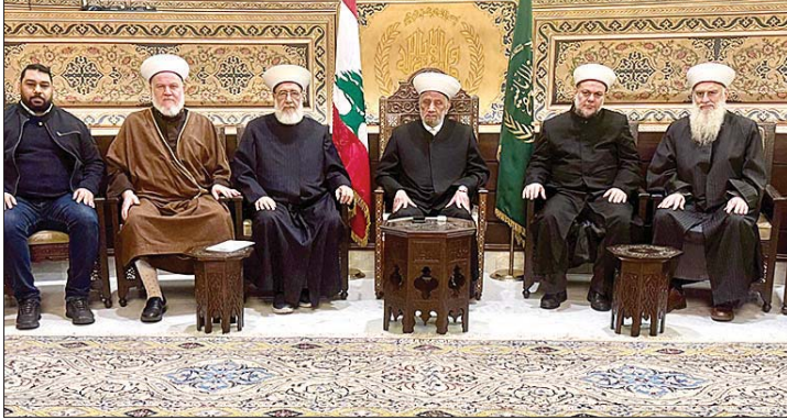
دريان بين زواره

الوطني الجامع ومساعيه الرشيدة في ترسيخ الاعتدال وصون الوحدة (...))، معلنا «موقفنا الواضح والصريح في التأييد الكامل والوقوف الثابت إلى جانب سماحته في وجه ما تعرض له مؤخراً من مواقف مؤسفة لا تخدم الدين ولا الوطن».