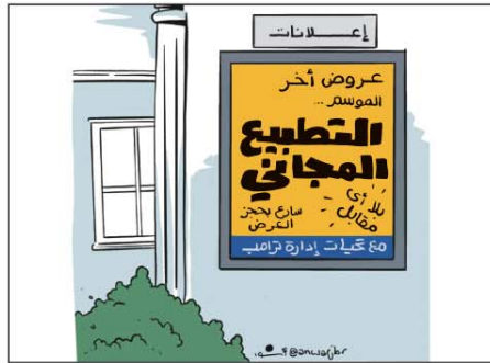
رسم محمد أنور (مصر) 2026