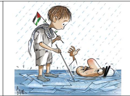
رسم خيرى الشريف (البحرين) 2025