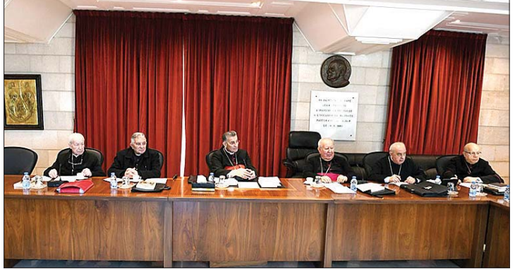
الراعي مترئساً الاجتماع

مسيطراً على أكثر من جبهة في لبنان». ولفت البيان إلى أن «الآباء يراقبون تعاطي السلطات المختصة مع الحلول المالية المقترحة، ولا سيما مصرير الودائع المصرفية. ويلفتون الانتباه إلى أن المعالجة الصحيحة لهذا الملف الشائك ينبغي أن تتصدى لكل جوانبه، بما في ذلك المستقبل المصرفي ودون الإغفال عن حقوق الأفراد والمؤسسات والنقابات». ورحبوا «باستئناف عملية التفاهم اللبناني - الفلسطيني على تسليم سلاح المخيمات الفلسطينية إلى الدولة، لما لذلك من انعكاس إيجابي على مواصلة تنفيذ القرار 1701، وعودة المسؤولية العسكرية والأمنية إلى الشرعية اللبنانية ومؤسساتها ذات الصلة». وحذروا من «الأنباء المتواترة عن محاولات نقل النزاعات المزمّنة في سوريا إلى لبنان، سواء عبر الأصوليات أو المطامع السلطاوية السالفة. ويأملون بصدق التعاون بين بيروت ودمشق لوأد تلك الفتن التي تُهدّد البلدين، وللعمل معاً من أجل غدٍ أفضل لهما».