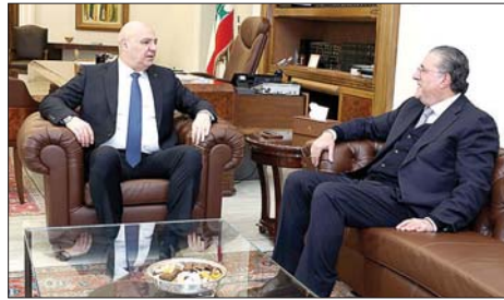
رئيس الجمهورية والوزير السابق محمد شقير

مسلسل أبو عمر يتوسّع ليشمل شخصيات جديدة ص 7