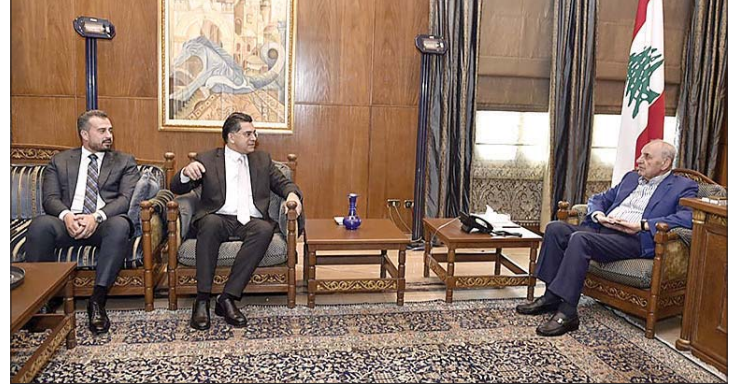
بري مستقبلاً مرقص

استقبل رئيس مجلس النواب نبيه بري في مقر الرئاسة الثانية في عين التينة رئيس لجنة التربية النيابية النائب حسن مراد حيث جرى بحث تطورات الأوضاع العامة والمستجدات السياسية وشؤون تشريعية.