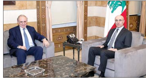
لقاء الحجار والبستاني

رائد عبدالله، قائد الدرك العميد جان عواد، قائد شرطة بيروت العميد عماد الجمل، أعضاء اللجنة المختصة متابعة ملف الدراجات النارية وعدد من الضباط المعنيين بشؤون السير. وخلال الاجتماع، تم البحث في الإجراءات التنفيذية لتطبيق القرارين الصادرين عن الوزير الحجار بمنع الشركات والمؤسسات والمعارض والتجار من تسليم أي دراجة قبل تسجيلها أصولاً، وتنظيم عمل راكبي السيارات (Valets parking).