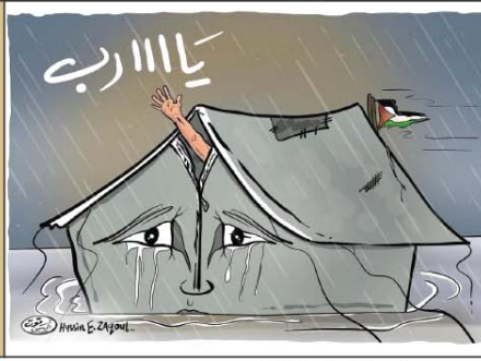
رسم حسين زقوت (فلسطين) 2026