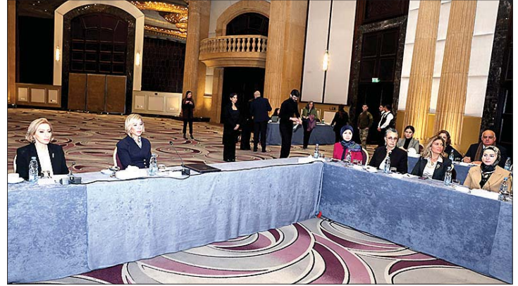
السيدة عون ترأس الاجتماع

توحيد الجهود. صوت واحد قد يسمع، لكن الأصوات الموحدة تحدث تغييراً فعلياً. ولذلك، نطلق اليوم هذا العمل المشترك بين المجتمع المدني والهيئة الوطنية، وكل من يؤمن بحق النساء بالمشاركة السياسية الكاملة». ولفتت الى ان «الواقع اليوم أليم في انتخابات ٢٠٢٢، تم انتخاب ٨ نائبات فقط. أي ٦,٢٥٪ المجلس النيابي في بلد يشكل النساء فيه أكثر من نصف المجتمع، هذه الأرقام مرفوضة / مغلوطة ولا تعكس الواقع. لهذا، نبدأ اليوم حملة جريئة، متواصلة، وموحدة، مع كقوى مدنية، ووطنية وإعلام، ومواطنين ومواطنات، نعيد تشكيل صورة البرلمان ليشبه شعبه... بنسائه ورجاله». بعدها قام الباحث في الدولية للمعلومات الاستاذ محمد شمس الدين، بعرض اقتراح القانون الرامي الى تعديل قانون انتخاب أعضاء /عضوات مجلس النواب رقم ٤٤ تاريخ ١٧ حزيران ٢٠١٧، بما يضمن «تخصيص نسبة ٤٠٪ من الترشيحات في اللوائح للنساء، وحجز ٢٣٪ من مقاعد مجلس النواب لهن». بعد ذلك، دار نقاش وتبادل للأراء بين المشاركين والمشاركات. وفي ختام المناقشات، تم التوافق على استكمال إعداد الصيغة النهائية لمشروع القانون ومواصلة جهود المناصرة لإقراره.