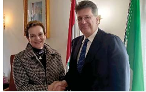
بورسليانو في زيارة جزار

بدورها، شكرت جزار بورسليانو مبدية استعدادها للتعاون من أجل «تحقيق كل ما يساهم في على استعداده للتعاون مع لبنان ومع «الوكالة الوطنية للإعلام» تطوير العلاقة بين البلدين».