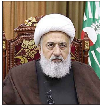
الشيخ علي الخطيب

للرغبات الإسرائيلية، على الرغم من التزام لبنان لتنفيذ بنود اتفاق وقف النار والقرار ١٧٠١ وعدم إلزام العدو قيد أملة لهذا الاتفاق (...). وأكد الخطيب «الالتزام بالتدابير الأساسية»، مشدداً على «ضرورة انسحاب قوات العدو من الأراضي اللبنانية وعودة النازحين إلى أرضهم وبلداتهم، وإطلاق مسيرة الإعمار والإفراج عن الأسرى اللبنانيين في السجون الإسرائيلية، بمن فيهم الأسير الأخير النقيب أحمد شكر الذي اختطف من الأراضي اللبنانية، وذلك قبل أي شيء آخر، وإلا لا فائدة ولا رهان على أي مفاوضات عبر لجنة الميكانيزم».