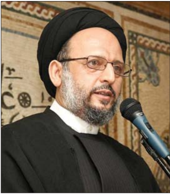
السيد علي فضل الله

حقه بالسيادة على أرضه وأمن مواطنيه التبريرات للعدو في عدوانه على هذا البلد. وهنا ندعو الحكومة إلى موقف موحد لا سيما في القضايا التي تتعلق بسيادة البلد وأمنه وفي مواجهة أعدائه، وبما يظهر الحكومة كتلة متراصة يطمئن إليها اللبنانيون ويتوحدون عليها ولا تكون مصدر انقسام بينهم (...)».