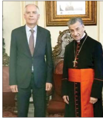
لقاء الراعي وماغرو

استقبل البطريرك الماروني الكاردينال مار بشارة بطرس الراعي امس في الصرح البطريركي في بكري سفير فرنسا في لبنان هيرفيه ماغرو وعرض معه المستندات. وكان الراعي التقى اول امس الدكتور أدونيس العكر، على رأس مجموعة من المجتمع المدني لتقديم مشروع مفضل عن آلية قيام الدولة المدنية في لبنان، التي بحسب العكر «لا ترفضها الدولة ولا يرفضها الدين»، وفضلاً كتاب «المصالحة بين الدين والمواطنة».