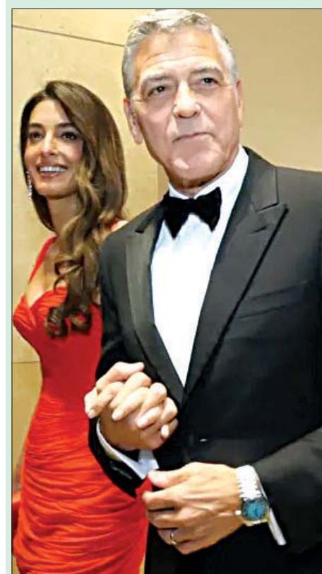
جورج وأمل كلوني ضمن آخر الحضور على السجادة الحمراء لحفل غولدن غلوب ٢٠٢٦.