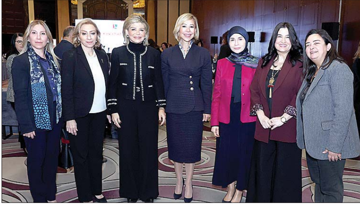
وتوسط عدد من المشاركات