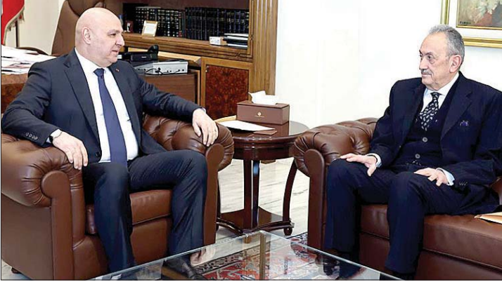
لقاء عون وكرم

هدأت الحركة الدبلوماسية التي ملأت الساحة اللبنانية على مدى اسبوع، وانكفأت نسبياً زيارات الموفدين وسفراء اللجنة الخماسية بعدما ادت غرضها بتحديد موعد مؤتمر دعم الجيش وبعض القطاعات الحيوية لا سيما الكهرباء والمرفأ وقد خصهما السفير الأميركي ميشال عيسى بزيارتين لافتتين اكدتا اهتمام واشنطن بالمرفقين وتقديم الدعم حيث يلزم.