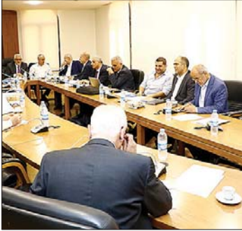
اجتماع لجنة الأشغال

ما أتاح نقاشاً مباشراً وتفاعلياً حول الأولويات والتحديات»، مشدداً على أن «تحقيق الأهداف يتطلب تشريعاً متجدداً وقوانين حديثة تواكب متطلبات المرحلة». وفي ما يتعلق بالمطارات، أكد رسامني «التزام الحكومة بأن يشهد مطار القليعات انطلاقة جديدة قبل الموسم الصيفي»، مشيراً إلى أن «العمل جارٍ على أكثر من مشروع، بعضها سيظهر أثره في المدى القريب، فيما يمتد بعضها الآخر على المدى الطويل». كما تطرق إلى ملف مطار رفيق الحريري الدولي باعتباره من «الملفات التي تهم شريحة واسعة من اللبنانيين». وفي موضوع النقل المشترك، أعلن أن «ما يحصل من أعمال شغب على بعض الباصات غير مقبول»، كاشفاً أنه أجرى «اتصالات مع وزير الداخلية وقادة الأجهزة الأمنية المعنية، خصوصاً أن هذه الباصات مجهزة بكاميرات، وقد باتت صور المتسببين بالمخالفات متوفرة، وطلب اتخاذ إجراءات فورية بحقهم»، مؤكداً أن «النقل المشترك خدمة أساسية تهم جميع اللبنانيين وتسهل وصولهم إلى مدينة بيروت من مختلف المناطق».