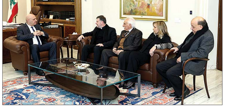
عون مستقبلاً الوفد