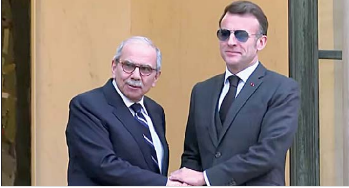
ماكرون مستقبلاً سلام

بأن الشخصية المستهدفة في غارات بعلمك هو مسؤول عسكري تابع لإحدى التنظيمات الفلسطينية وهذه المرة الثالثة التي تحاول إسرائيل استهدافه منذ سنة حتى الآن وفي مناطق مختلفة.