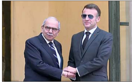
ماكرون مستقبلاً سلام في الإليزية

ترامب: "قوة كبيرة" تتجه نحو إيران تقديرات بهجوم "سريع" وواسع منظمة الحظر الكيميائية: نظام الأسد هاجم بغاز الكلور بلدة كفرزيتا