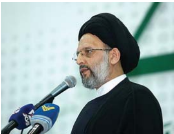
السيّد علي فضل الله

دعا العلامة السيد علي فضل الله، في خطبة الجمعة، «الدولة اللبنانية المعنية بالسيادة على أرضها وحماية حدودها ومواطنيها، إلى أن يكون خطابها معبرا عن حقيقة ما يجري على أرض الجنوب والبقاع والبقاع الغربي والانتهاك الدائم لسيادة الوطن في جوه وبحره وأرضه وعن مدى آلام اللبنانيين الذين يقتل كل يوم شبابهم ويعانون الخوف والرعب والقلق والتشريد من بيوتهم والتضحيات الجسام التي قدموها لحساب هذا الوطن». ولفت الى اننا «نعي جيда حجم الضغوط التي تتعرض لها الدولة اللبنانية وحجم القدرات التي يمتلكها هذا العدو والمساندة الدولية والتي تجعله قادرا على أن يضرب ويدمر ويقتل حيث يشاء كما يفعل، ولكننا نريد مع كل اللبنانيين أن يروا دولتهم تبذل أقصى ما لديها لإيقاف نزيف الدم والدمار وتفعل دورها بما تمتلكه من رصيد على الصعيد السياسي والدبلوماسي وفي المحافل الدولية لإزالة الاحتلال ووقف العدوان (...)». ودعا اللبنانيين إلى «التلاقي، دولة ومواقع سياسية واجتماعية وثقافية ودينية للعمل معا لدراسة كل السبل التي تضمن إخراج البلد من آلامه ومواجهة المخططات التي تستهدفه وأن تكون اللغة التي