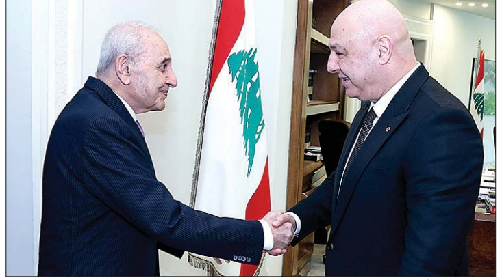
عون مستقبلاً بري

حريصاً، وليس لدينا خيار آخر. فالحرب ليست خياراً لنا، وكذلك هي ليست خيار أهل الجنوب الذين عانوا وخسروا الكثير منذ العام ١٩٦٩. ولبنان لا يمكن أن يتحمل وحده تبعات الدفاع عن القضية الفلسطينية مع انها قضية محقة».