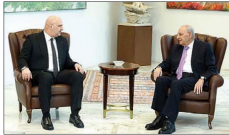
لقاء رئيسي الجمهورية والمجلس في بعيدا