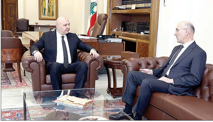
... ووزير الداخلية