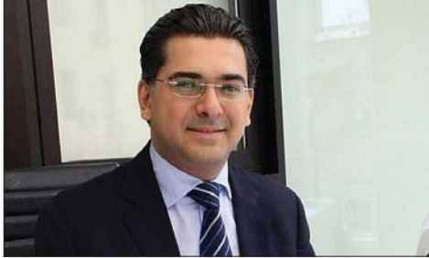
الوزير بول مرقص

أكد وزير الإعلام المحامي د. بول مرقص، في حديث إلى «إذاعة لبنان»، أن «الاعتداءات الإسرائيلية المتواصلة على لبنان لا تستهدف الأراضي اللبنانية فحسب، بل تهدف أيضاً إلى زعزعة الاستقرار الداخلي وإحداث شرخ وانقسام بين اللبنانيين»، مشدداً على أن «الوعي والوحدة الوطنية يبقيان خط الدفاع الأول في مواجهة هذه المحاولات». وقال الوزير مرقص: «إن حرية التعبير وحرية الصحافة في لبنان مصونتان بموجب الدستور والقوانين مرعية الإجراء، وهما من ركائز النظام الديمقراطي»، مؤكداً في الوقت عينه، أن «هذه الحرية لا تعني التعرض لمقام رئاسة الجمهورية أو أي من المقامات الدستورية، بل تُمارَس ضمن الأطر القانونية والمناخية المهنية». وشدد وزير الإعلام على «ضرورة الابتعاد عن لغة الشتائم والإساءات الشخصية وخطاب الكراهية»، داعياً الإعلاميين إلى «التزام أخلاقيات المهنة واعتماد النقد المسؤول للسياسات العامة والمبني على الوقائع، لما لذلك من دور أساسي في حماية النقاش العام والسلم الأهلي». وجواباً على سؤال، أكد الوزير مرقص ثقته بالقضاء، طالباً «احترام أصول التعاطي مع الصحافيين والإعلاميين».