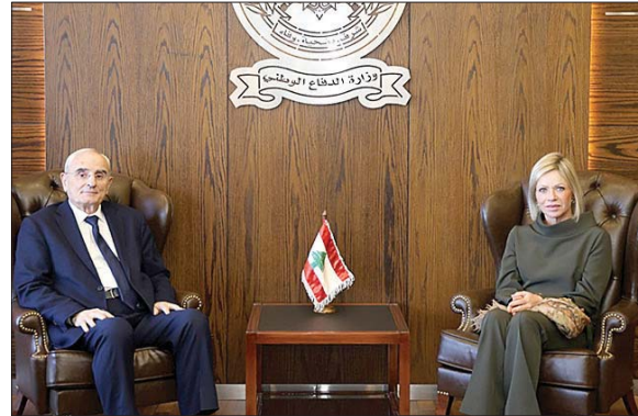
لقاء منسى وبلاسخارت

«اليونيفيل» في جنوب لبنان، والبداية والهادي سعيد، وتم البحث في الأوضاع المقترحة لوجود دولي بهدف متابعة تطبيق القرار ١٧٠١». ومن الزوار: وزير الدفاع النائب نقولا صحنوي المشترك.