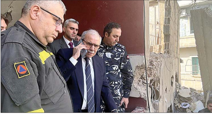
سلام يتفقد المبنى المنهار

بقي التصعيد العسكري الإسرائيلي عدا عن ملف سلاح حزب الله في الواجهة، بعثت وزارة الخارجية والمغتربين، بواسطة بعثة لبنان الدائمة لدى الأمم المتحدة في نيويورك، برسالة الى مجلس الأمن والأمن العام للأمم المتحدة، تضمنت شكوى بشأن استمرار الخروقات الإسرائيلية للسيادة اللبنانية خلال الأشهر الماضية.