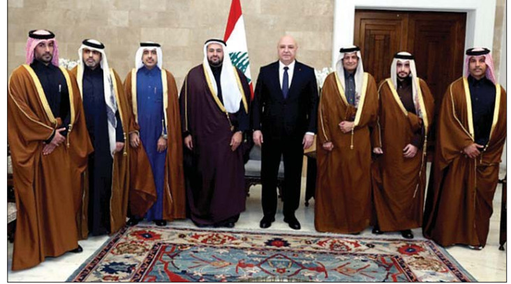
عون مستقبلاً الوفد القطري

في ظل تعليق الدعم السعودي في انتظار تنفيذ لبنان الشروط المفروضة في مجالي حصر السلاح والاصلاحيات بعدما سلكت قضية تهريب المخدرات طريقها نحو الضبط، جاء الدعم القطري اللامحدود ليُعوّض نسبياً غياب الرياض عن الدعم المعتاد وتقديم رزمة مساعدات سبوعية، تمتد من السياسة الى العسكر ومن التعليم الى الصحة والاقتصاد من دون إغفال أزمة النازحين السوريين مع إطلاق مشروع دعم العودة الطوعية والأمن للسوريين من لبنان إلى سوريا، بالتعاون مع المنظمة الدولية للهجرة. التزام قطر مساعدة لبنان ودعم مؤسساته عبر عنه وزير الدولة في وزارة الخارجية القطرية محمد بن عبد العزيز الخليفى، الذي حضر الى لبنان واجرى محادثات مثمرة مع كبار المسؤولين معلناً عن حزمة واسعة من المساعدات والمشاريع ومؤكداً أن قطر تقف إلى جانب لبنان إيماناً منها بأهمية استقراره وتعافيه كركيزة أساسية لاستقرار المنطقة.