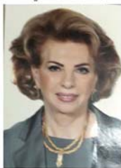
"العش الواحد في لبنان"