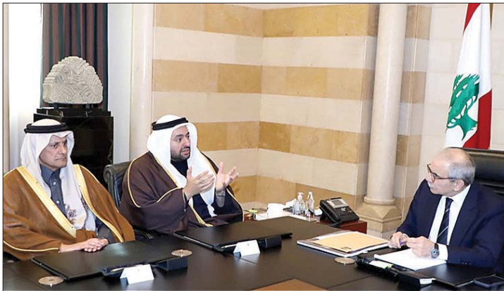
محادثات سلام والخليفى

اما متري فأشار الى ان «قطر تدعم لبنان في