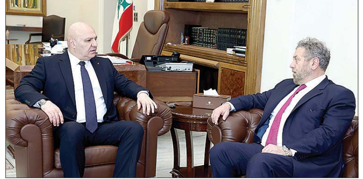
عون مستقبلاً افرام