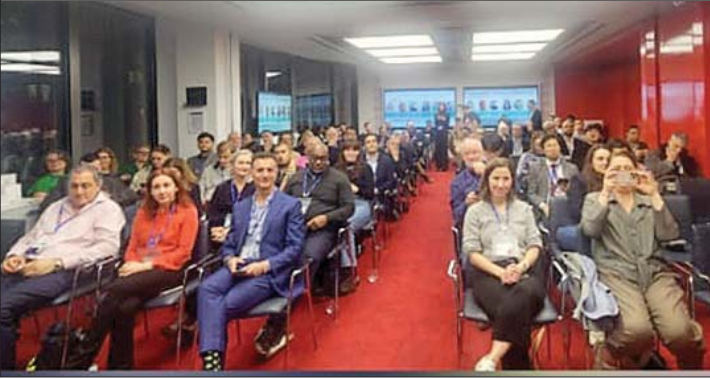
لبنان في جلسات الرؤى الاستراتيجية

التربية على الابتكار للجمع والتعاون الدولي لبناء شراكات استراتيجية تتيح للتلامذة بيئة حاضنة للابتكار، مستشهدا بمعرض BETT الذي لعب دورا هاما على مدار أكثر من ٤٢ عاماً وجمعية موردي حلول تكنولوجيا التعليم البريطانية BESA (٩٢ عاماً) والتي اقامت اهم المبادرات العالمية وقامت بتشبيك الموردين والمستفيدين والمستثمرين في الذكاء الاصطناعي المسؤول والمبنية على الثقة مثل مؤسسة سرتفاي Certify البريطانية التي تتيح العمل والاختبار الأكاديمي الموثوق وإدخال برامج تعليمية مرنة في سبيل الوصول الرقمي والمساواة وتحقيق العدالة الرقمية الى جانب كبرى المؤسسات التكنولوجية التي زودت العالم بمنظومات تعزز بيئة الابتكار وتجهيزات مختبرات الابتكار في المدارس مثل اوتديسك وادوبي وميكروسوفت وغوجل وريزبري واردينو وميكروبيت وكواري المفتوحة المصادر والمجانية لقطاع التعليم.