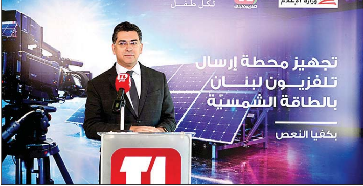
مرقص يلقي كلمته