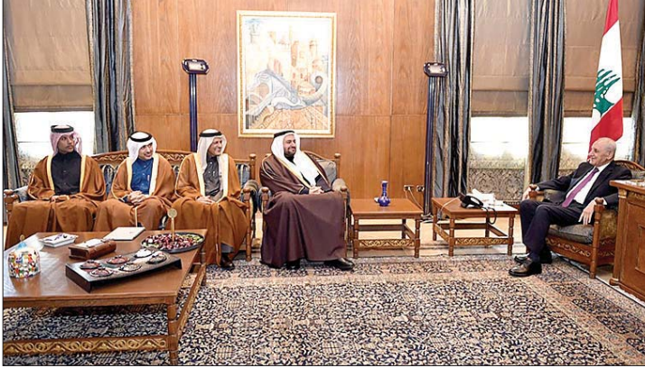
لقاء بري والوفد القطري