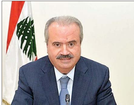
الوزير ياسين جابر

بالليرة اللبنانية وليس بالعملة الصعبة، علماً أن هناك ديونا عديدة مستحقة ومن الواجب على الدولة تسديدها». اضاف: «تدرك الحكومة جيداً أن تحسين الأوضاع المعيشية للعاملين في القطاع العام، وتحفيز الانتاجية داخل الادارات أمر ضروري، ولا نقاش فيه، لكن أي مقارنة جدية يجب أن تتم ضمن إطار مالي متوسط الأجل، يحفظ الاستدامة ولا يغامر باستقرار ما زال هشاً، ورغم ذلك لم تتوان الحكومة عن منح زيادات للعسكريين في الخدمة الفعلية وأيضاً للمتقاعدين منهم. كما تم الاتفاق عليه بالأمس في الاجتماع الذي ضمني الى جانب رئيس الحكومة مع ممثلي قدامى العسكريين، وذلك بالتنسيق مع وزيري الدفاع والداخلية. وما زالت الحكومة ملتزمة بهذه الزيادات رغم قرار مجلس شوري الدولة وقف تنفيذ المرسوم المتضمن إيرادات لتغطيتها تبلغ قيمتها حوالي ٤٥٠ مليون دولار اميري، ما دفع مجلس الوزراء إلى التقدم من مجلسكم الكريم بمشروع قانون بهذا الشأن».