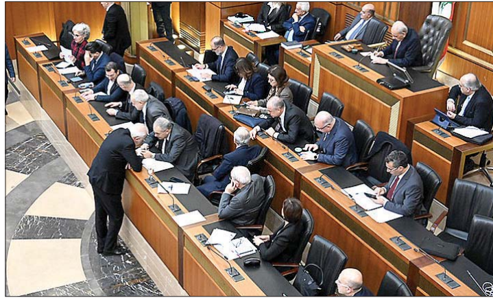
الهيئة العامة لمجلس النواب

وطالب الرئيس بري قطع البث المباشر للتلفزيوني. ثم بدأت الهيئة العامة في مجلس النواب التصويت على الجزء الأول المتعلق بنقفاة وموازنات الوزارات والادارات والمؤسسات العامة.