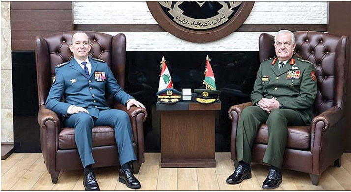
لقاء القاتدين اللبناني والأردني