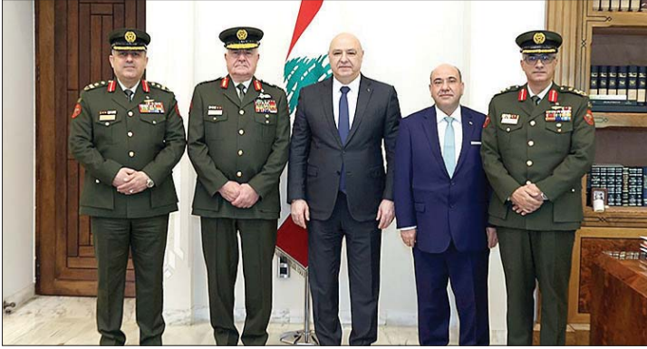
عون مستقبلاً الحنيطي والوفد

استقبل رئيس الجمهورية العماد جوزيف عون، في حضور السفير الأردني في لبنان وليد الحديد، قائد الجيش الأردني اللواء الركن يوسف الحنيطي على رأس وفد ضم العميد هيثم بكر والعميد مجدي الحراسيس وذلك في إطار الزيارة الرسمية التي يقوم بها إلى لبنان، وخلال اللقاء، نقل اللواء الحنيطي إلى الرئيس عون تحيات العاهل الأردني الملك عبد الله الثاني بن الحسين وتأكيداته على استمرار الأردن في دعم لبنان في المجالات كافة.