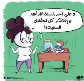
رسم بيكاويات (مصر) 2026 - 2026