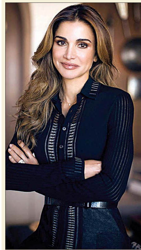
الملكة رانيا تُعاهد الأمير هاشم بعيده الـ 21: «قديش فخورة فيك»