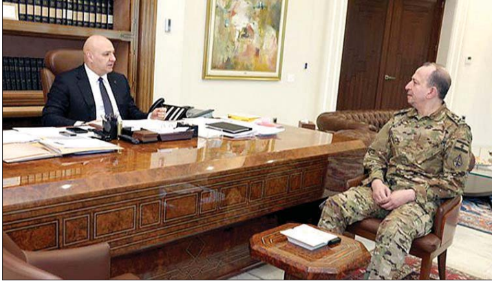
عون مستقبلاً هيكل

اقراص مدمجة تحتوي نسخاً منها إلى البلديات وإلى المختارين وإلى مراكز المحافظات والأقضية وإلى وزارة الخارجية والمغتربين بهدف نشرها وتعميمها تسهياً للتفتيش النهائي. لذلك، يُدعى الناخبون المقيمين وغير المقيمين إلى الاطلاع عليها اعتباراً من الأول من شباط ٢٠٢٦ على الموقع الرسمي الإلكتروني الخاص بالمديرية العامة للأحوال الشخصية www.dges.gov.lb أو على نسخ القوائم الانتخابية الأولية الموجودة في مراكز المحافظات والأقضية ولدى البلديات والمخاتير ومختلف السفارات والقنصليات اللبنانية في الخارج، وبالتالي يُطلب من كل ذي مصلحة أن يتقدم اعتباراً من الأول من شباط ٢٠٢٦ ولغاية الأول من آذار ٢٠٢٦ ضمناً إلى لجنة القيد المختصة بطلب يرمي إلى تصحيح أي خلل يقيه في القوائم الانتخابية، كان يكون سقط قيده أو وقع خطأ في إسمه أو لأي سبب آخر، علماً أن المديرية العامة للأحوال الشخصية قد أصدرت أقرصاً مدمجة تحتوي القوائم الانتخابية الأولية لكل دائرة إنتخابية ويحق لأي شخص أن يستحصل على نسخ عنها لقاء بدل يساوي 1.000.000 (مليون ليرة لبنانية فقط) يستوفي المبلغ بطابع مالي أو بإيصال مالي.