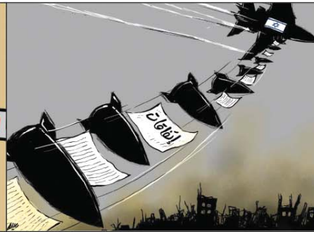
رسم أمجد رسمي (الأردن) 2026