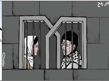
رسم محمد سيانة (فلسطين) 2026