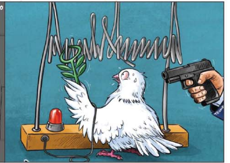
رسم أسامة حجاج (الأردن) 2026