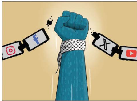
رسم كمال شرف (اليمن) 2026