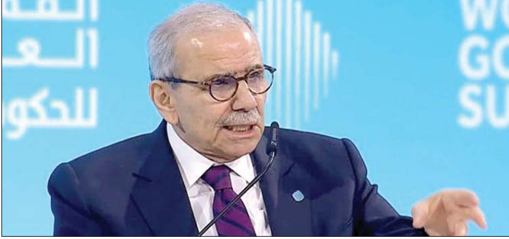
سلام في قمة الحكومات

من مركزية رفض تسليم السلاح شمال اللباني والتهديد بالويل والثبور الى تفاصيل المناكفات الداخلية وإثارة الغرائز الشعبية، نقل أمين عام حزب الله الشيخ نعيم قاسم خطابه. ساءه ان في الحكومة التي يشارك فيها وزراء الحزب ولا ينفك يهاجمها ويعترض على قراراتها الاستراتيجية، ثمة لا يهابه ولا يأبه لتهديداته، فقرر ان يتوجه اليه بالمباشرة: "بعض الوزراء في الحكومة يجرون لبنان إلى الفتنة ويغرقونه في العتمة ويتصرفون بطريقة كأن الحكومة ورقة بيد الحزب الذين يعملون لديه".