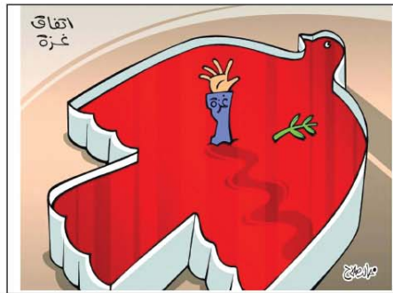
رسم خالد صلاح (مصر) 2026