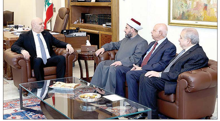
عون مستقبلاً وفد دار الفتوى