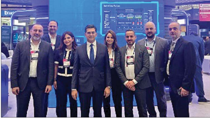
مرقص في قمة قطر

أكد وزير الإعلام المحامي د. بول مرقص، في سلسلة لقاءات إعلامية من الدوحة، على هامش مشاركته كمتحدث رئيسي في Web Summit Qatar ٢٠٢٦ الذي افتتحه رئيس مجلس الوزراء وزير الخارجية القطري محمد بن عبد الرحمن بن جاسم آل ثاني، «أن المستقبل اللبناني واعد في هذا المجال رغم الصعوبات الأمنية والمالية، ولا سيما أن الاستثمارات غالباً ما تتجه نحو الأسواق الناشئة والدول الخارجة من الأزمات، باعتبارها فرصاً استثمارية واعدة، وهو ما يفسر أهمية مشاركة لبنان في هذا الحدث». وأشار مرقص إلى أن «مشاركة وزارة الإعلام اللبنانية تؤكد حضور لبنان وتندرج في إطار التواصل والتعاون والتشبيك، بهدف تفعيل هذا الحضور وتعزيز عودته إلى الساحة العربية»، لافتاً إلى «توافر إمكانيات كبيرة وفرص واعدة لإقامة شراكات مشتركة مع الدول الشقيقة والصديقة، وكذلك مع القطاع الخاص في لبنان والخارج (...)». وفي ما يتعلق بأهداف المشاركة اللبنانية، أوضح أن «لبنان حضوراً حكومياً في المؤتمر إلى جانب مسؤولين من دول أخرى، إلا أن المشاركة تتجاوز هذا الإطار لتشمل بناء شراكات إعلامية