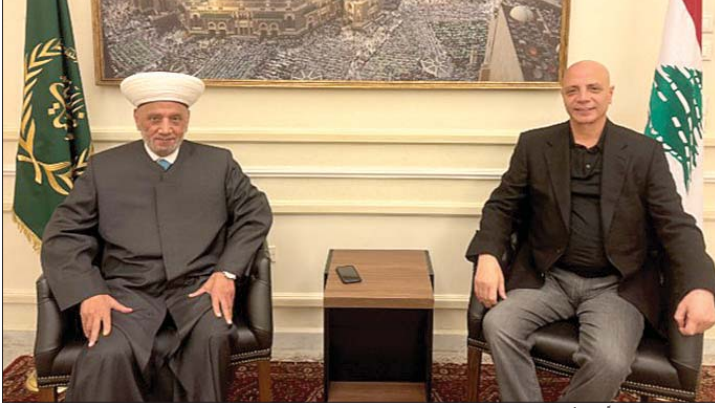
دريان مستقبلاً هاشمية

ووضعا سماحته في إطار التحضيرات والمساعدات التي تقوم بها في هذا المجال وقد استمعنا لكلمة سماحته التي بكل صراحة قد انعشت الكثير من الحضور الذين لم يكونوا قد تعرفوا على سماحته بالشخصي وكان هذا اللقاء مناسبة من قبله لبث هذه الثقافة والشد على أيدينا، لأن ثقافة مريم العذراء التسامح والتلاقي ونشر ثقافة المحبة على صعيد الوطن. والتقى المفتي دريان: ممثل دار الفتوى في القارة الاسترالية الشيخ مالك زيدان وممثل دار الفتوى في ولاية فكتوريا مارلون الشيخ محمد أبو عيد بحضور عضو المجلس الشرعي الشيخ فايز سيف. وتم البحث في الشؤون الإسلامية وأوضاع الجالية اللبنانية في أستراليا.