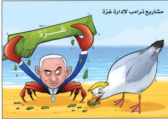
رسم نواف الملا (سوريا) 2026