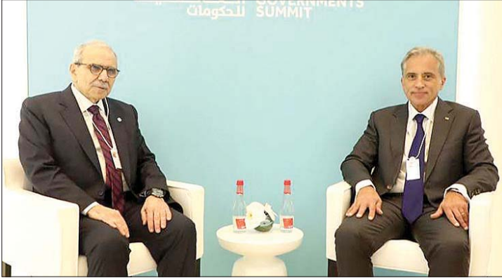
لقاء سلام ونظيره الأردني

كما شدد الرئيس سلام على أهمية الدور الذي يمكن أن يضطلع به صندوق النقد العربي في دعم لبنان ضمن الإطار العربي الأوسع، سواء عبر توفير المشورة الفنية أو المساهمة في تطوير نظم الإحصاءات المالية، وتعزيز الشمول المالي، وتحديث نظم الدفع والتسوية، بما يساهم في دعم الاستقرار الاقتصادي وتحفيز النمو.