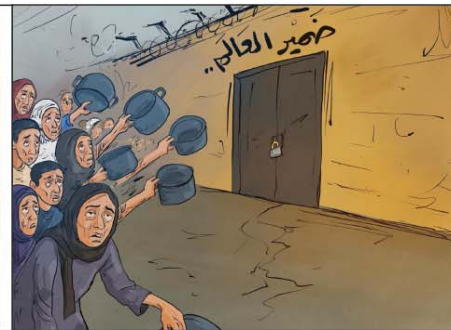
رسم محمود عباس (فلسطين) 2025