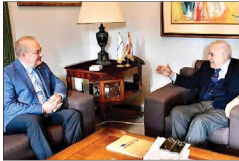
لقاء سلامة وروداكوف

داغماً وقبل أي شيء ومن في موضوع إيران وبرنامجه الأهمية يمكن إجراء مفاوضات وغير ذلك، ونأمل أن تنجح ومناقشات حول الوضع حيث المفاوضات حيث يكون بذلك نتمنى في التوصل إلى حل نجاحاً لكل المنطقة.