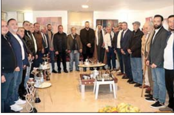
الحريري في زيارة العشائر

قام الأمين العام لـ «تيار المستقبل» أحمد الحريري أمس بجولة على العشائر العربية في الشويفات وخلدة، اختتمها بزيارة رئيس «الحزب الديموقراطي اللبناني» طلال أرسلان، في دارته، في حضور نجله مجيد. وكان قد استهل جولته في إطار التحضيرات لإحياء الذكرى الـ ٢١ لاستشهاد الرئيس رفيق الحريري في ١٤ شباط الجاري، من بلدية الشويفات، فكيبر آل غصن الشيخ أبو مشهور، في ديوانه، في حضور مشايخ وأبناء العائلة، ولبي دعوتهم إلى فطور صباحي أقيم على شرفه. كما زار كبير آل نوفل الشيخ سهيل نوفل، في دارته، فديوانية المرحوم ابو سلطان الشاهين، وشدد على أن «المنطقة تشهد مرحلة جديدة تستوجب من لبنان التقاط الفرص المتاحة وإعادة التوازن إلى الحياة الوطنية»، مؤكداً «أهمية الاستقرار في سوريا وانعكاسه الإيجابي على لبنان ودول المنطقة». وتطرق إلى مسيرة «الحريرية الوطنية»، وما مرت به من مراحل، وصولاً إلى مرحلة تعليق العمل السياسي، مؤكداً أن «إرث الرئيس الشهيد لا يزال حاضراً في وجدان اللبنانيين، وأن الأمل يبقى قائماً بالعودة إلى