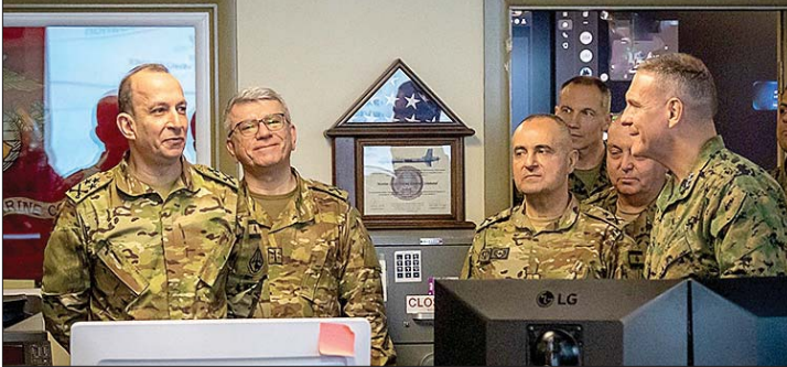
من لقاءات قائد الجيش في واشنطن

بينما يواصل قائد الجيش العماد رودولف هيكمل زيارته واشنطن، عشية عرضه خطة حصر السلاح شمال اللباني أمام مجلس الوزراء وعشية مؤتمر دعم الجيش اللبناني المرتقب في 5 آذار في باريس الذي سيحضر في زيارة وزير الخارجية الفرنسية جان نويل بارو بيروت في الساعات المقبلة، علم ان الرئيس عون سيرأس وفد لبنان الى مؤتمر الدعم الذي سيشارك فيه حشد من الدول العربية والاجنبية، وقد وجه الرئيس الفرنسي إيمانويل ماكرون الدعوة الى 50 دولة بتوقع ان تحضر المؤتمر.