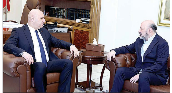
عون مستقبلاً الرياشي