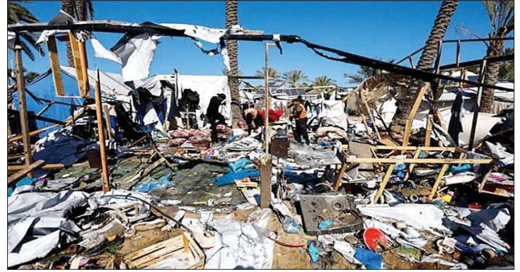
فلسطينيون يبحثون عن ضحايا الغارات في موقع القصف