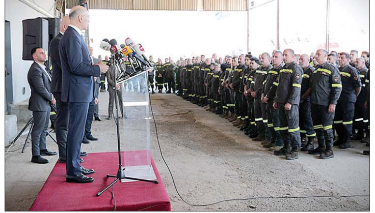
الحجار يتحدث الى عناصر الدفاع المدني