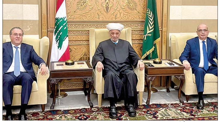
دريان مستقبلاً شقير وسلام

في لبنان وبخاصة الشؤون البيروتية والتأكيد على الدور الإسلامي والوطني الجامع لدار الفتوى، التي شكلت ولا تزال مظلة جامعة لكل اللبنانيين ومرجعية اعتدال وحكمة في أدق المراحل». والتقى المفتي دريان رئيس جمعية «الدعاة» الشيخ محمد أبو القطع مع وفد من الجمعية ورئيس حزب «الوفاء اللبناني» الدكتور احمد علوان.