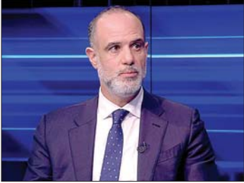
فايز رسامني وزير الأشغال