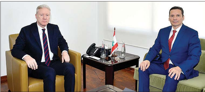
لقاء رجي وسفير كولومبيا

معاً على تطوير هذه العلاقات وترسيخها لما فيه مصلحة البلدين والشعبين». من جهة ثانية، التقى رجي سفير جمهورية كولومبيا أودين أوستوس ألفونسو وعرض معه العلاقات الثنائية بين البلدين وسبل تطويرها. واستقبل الوزير رجي سفير إسبانيا خيسوس سانتوس أغواود في زيارة وداعية، لمناسبة انتهاء مهامه الدبلوماسية في لبنان، وقمى له التوفيق في مهامه المستقبلية.