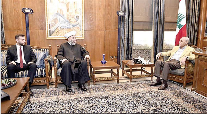
بري مستقبلاً الرافعي

العام وطلبنا من دولة الرئيس المساعدة في هذا الموضوع الملح لأن هناك عدداً كبيراً من الموقوفين لا يزالون ينتظرون النزول إلى الجلسات منذ عدة سنوات ولا يحدث ذلك، ودولة الرئيس أبدى كل تفهم حول هذا الموضوع المتعلق بالعفو العام . وتابع المفتي الرافعي: الأمر الثالث والأخير يتعلق ببعض الشؤون والشجون البقاعية المتعلقة بالجانب الخدمي في البقاع وقد وعد دولة الرئيس بمتابعة الموضوع والوصول إلى خواتيمه السعيدة. وبعد الظهر استقبل رئيس المجلس أمين سر كتلة اللقاء الديمقراطي النيابية النائب هادي أبو الحسن حيث جرى عرض للاوضاع العامة والمستجدات السياسية وشؤون تشريعية.