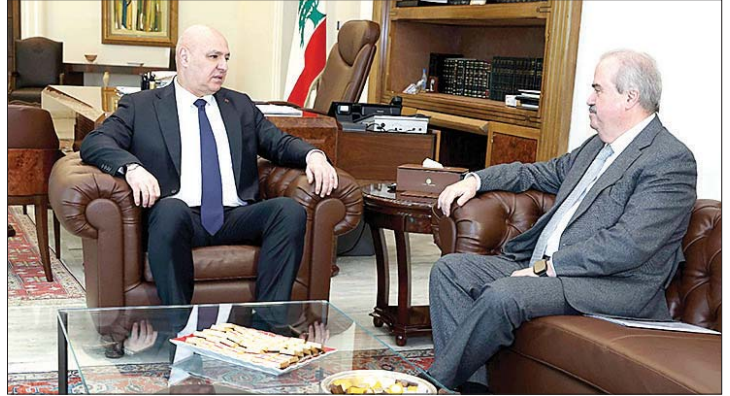
لقاء عون وجابر

النقابة حسن الحسن الذي اطلع رئيس الجمهورية على الظروف الصعبة التي يمرّون بها إضافة إلى أهمية إعادة تشغيل هذا القطاع وتفعيله، وقال في مستهل اللقاء: «نتقدم من فخامتكم بالشكر الجزيل على استقبالكم لنا لإتاحة المجال لعرض قضية قطاع عام وحيوي، جرى إقراره تعسفاً منذ أكثر من أربع سنوات، نتيجة قرار إداري غير مدروس، ما أدى إلى فقدان ما يقارب ٤٥٠ موظفاً وموظفة مصدر رزقهم من دون أي تعويض أو حقوق تذكر بعد أن أمضى معظمهم سنوات طويلة في خدمة هذا المرفق العام».