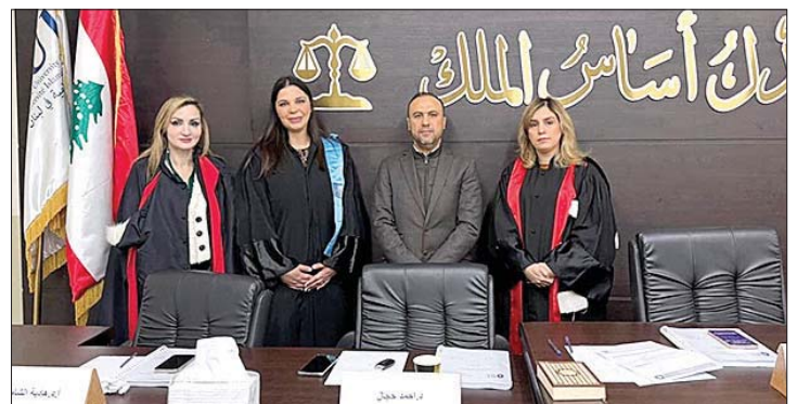
مناقشة اطروحة الماجستير