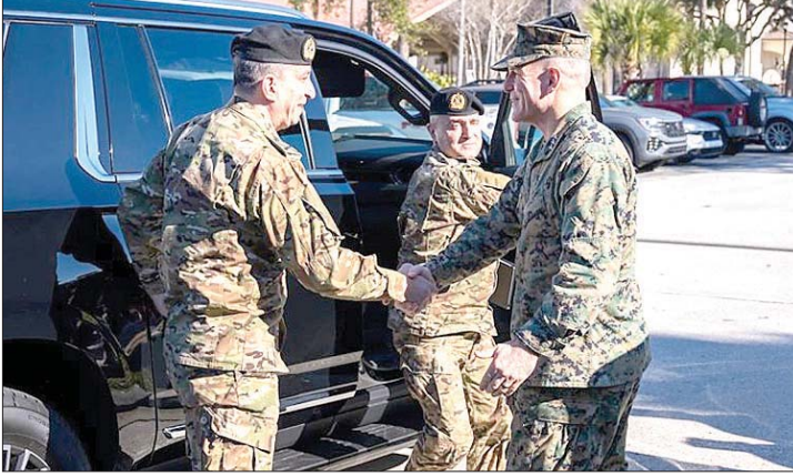
زيارة هيكل لواشنطن

الذي قطعتة للزملاء العسكريين برفع الرواتب والمعاشات إلى 50% مما كانت عليه بالدولار الأمريكي سنة 2019، وتجزئة الباقي إلى خمسة أجزاء تدفع كل ستة أشهر بمعدل 10% من قيمة الراتب أو المعاش، مع تصحيح بالنسب ذاتها للمتقاعدين، وهو ما يشكل مضمون الورقة التي قدمها التجمع إلى رئيس الجمهورية، نأمل أن نلقى جواباً شافياً من فخامتة". وختم داعياً "العاملين في القطاع العام من داهيين ومتقاعدين ومتقاعدين (عسكريين ومدنيين) إلى الاستعداد مجدداً للنزول إلى الشارع، وبكل أشكال النضال التي كفلها الدستور من اعتصام وتظاهر وصولاً إلى الإضراب المفتوح، حين تدعو الحاجة، ولكن شهر شباط شهر غضب تتحقق فيه النتائج المرجوة، فما بعد شباط 2026 لن يكون كما قبله، ولتكن وحدة القطاع العام هي الضوء الذي يوجه طريقنا".