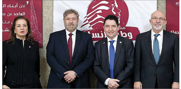
افرام مستقبلا السيناتور الفرنسي

هو حماية لبنان من أن يكون في «عين العاصفة» وضمان استقلالية قراراته وخدمة مصالح اللبنانيين فقط والمصلحة اللبنانية العليا. من ناحيته، أكد كاديك اهتمامه العميق بالشأن اللبناني، مشددا على «دعم فرنسا للبنان لتعزيز سيادته واستقلاله، خصوصا عبر دعم الجيش اللبناني وتمكينه من القيام بدوره بكامل طاقته». كما تطرق إلى متابعة قضية ضحايا انفجار مرفأ بيروت والتعاون مع القضاء اللبناني لضمان تحقيق العدالة للضحايا بشكل عام كما الفرنسيين منهم، مؤكدا «أن هذا الموضوع يشكل أولوية في زيارته للبنان». وأشار إلى أن «زيارته أتاحت له الاطلاع على رؤية مشروع «وطن الإنسان» والمستجدات السياسية والاجتماعية في لبنان»، مؤكدا حرصه على «متابعة التطورات اللبنانية ونقلها إلى زملائه في مجلس الشيوخ الفرنسي». وختم إنه «أثناء زيارته لمدينة جونيه، التقى رئيس البلدية وأعضاء المجلس البلدي، وأشار بالتحسن الكبير الذي شهدته المدينة خلال بضعة أشهر، والدور الذي لعبه المجتمع المحلي في تطويرها وتحسين خدماتها، معتبرا أن هذا دليل على قدرة اللبنانيين على النهوض وإحداث التغيير الإيجابي رغم التحديات الراهنة».