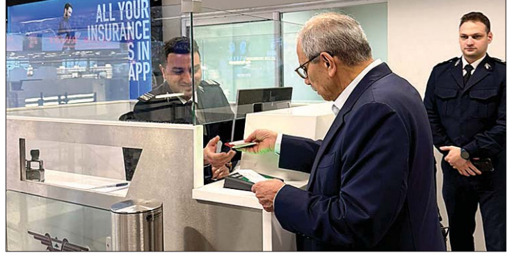
سلام في مبنى المسافرين

غادر رئيس الحكومة نواف صباحاً بيروت متوجهاً إلى ميونيخ للمشاركة في مؤتمر للأمن، الذي سيشارك به أيضاً قائد الجيش العماد رودولف هيكل، على أن يعود الأحد قبل جلسة مجلس الوزراء الاثنين. واللفت أن مغادرة سلام كانت من مبنى المسافرين وليس من صالون الشرف، معانيًا حسن سير العمل والاجراءات المتخذة.