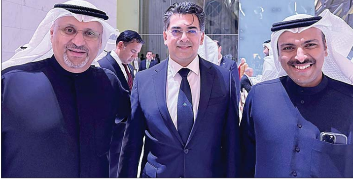
من لقاءات وزير الإعلام