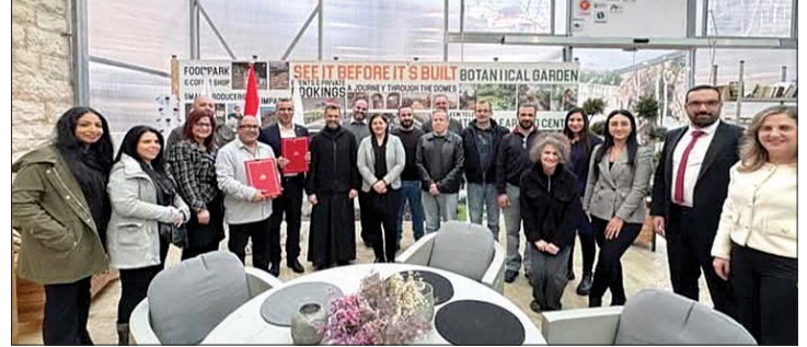
وزير الزراعة في انطلياس

الممارسات الزراعية. • الإعلام الزراعي والتواصل الرقمي: إنتاج ونشر برامج توعوية وبودكاست وفيديوهات من داخل القرية الإيكولوجية والحديقة النباتية، بهدف نقل المعرفة الزراعية إلى شريحة أوسع من المجتمع وتعزيز مفهوم الإرشاد الزراعي الحديث. • الأسواق الريفية والتشبيك: تنظيم أسواق ومعارض موسمية تربط المنتجين مباشرة بالمستهلكين، بما يساهم في دعم سلاسل القيمة للمنتجات اللبنانية، من الزيتون والخروب إلى الحمضيات والمونة التقليدية. • الحديقة النباتية كمنصة تعليمية وطنية: اعتماد الحديقة النباتية في كموقع للزيارات المدرسية والجامعية والأنشطة البيئية والزراعية، مما يعزز التربية البيئية ويرسخ الوعي بأهمية حماية الموارد الطبيعية. وأكد الوزير هاني أن هذه الشراكة تعكس توجه وزارة الزراعة نحو الانفتاح على المبادرات المبتكرة التي تجمع بين العلم والتوعية والاقتصاد المحلي، مشدداً على أن الاستثمار في التعليم البيئي والإرشاد الحديث يشكل ركيزة أساسية لبناء قطاع زراعي أكثر مرونة واستدامة. وتندرج هذه الخطوة ضمن رؤية وطنية متكاملة تهدف إلى بناء مجتمع زراعي أكثر وعياً وقدرة على مواجهة التحديات، من خلال تكامل المعرفة العلمية مع الإعلام المتخصص وتعزيز فرص الإنتاج والتسويق، بما يخدم الإنسان ويحافظ على الأرض.