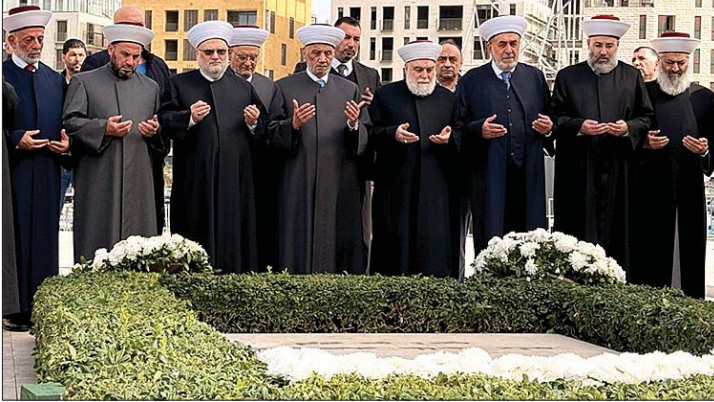
المفتي والوفد امام الضريح

اتفاق مؤقت على خط ازمة العبور حدودياً، وبعد ثلاثة أيام متتالية من التحركات التي نفذتها نقابة الشاحنات المزدرة وإقفال حركة عبور الشاحنات من وإلى لبنان عند معبر المصنع، سجّل اليوم تطوّر لافت على هذا الخط الحدودي، تمثّل بالتوصّل إلى اتفاق لبناني-سوري مؤقت يقضي بإعادة حركة الشاحنات إلى طبيعتها لمدة أسبوع واحد، بانتظار التوافق على آلية دائمة، وتقرر اعتماد آلية تنظيمية انتقالية ومؤقتة، قائمة على مبدأ المعاملة بالمثل، تهدف إلى معالجة الإشكالات القائمة وضمان استمرارية حركة النقل بصورة متوازنة بين لبنان وسوريا، من دون المساس بالمواقف المبدئية أو القانونية لكلا الطرفين. وعجوب هذه الآلية، يُسمح للشاحنات اللبنانية بالدخول إلى البحات الجمركية السورية لتفريغ حمولتها هناك، على أن تعود إلى لبنان محملة بضائع سورية، فيما تُطبّق الآلية نفسها على الشاحنات السورية الداخلة إلى الأراضي اللبنانية خلال فترة سريان الاتفاق.