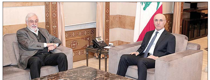
لقاء الحجار والصمد

إلى التحضيرات الإدارية واللوجستية التي تقوم بها وزارة الداخلية والبلديات، استعدادا للانتخابات النيابية في أيار ٢٠٢٦.