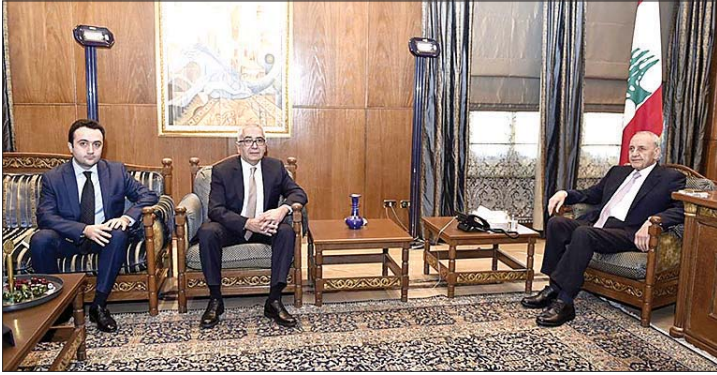
لقاء بري وسفير أرمينيا

استقبل رئيس مجلس النواب نبيه بري في مقر الرئاسة الثانية في عين التينة سفير أرمينيا سارمن باغداساريان في زيارة بروتوكولية بمناسبة توليه مهامه الجديدة كسفير لبلاده لدى لبنان، الزيارة كانت مناسبة أيضاً جرى خلالها عرض للاوضاع العامة في لبنان والمنطقة والعلاقات الثنائية بين البلدين. كما استقبل رئيس المجلس رئيس البلدية. كما استقبل رئيس المجلس رئيس البلدية. كما استقبل رئيس المجلس رئيس البلدية.