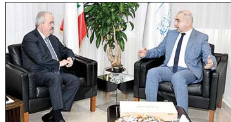
وزير المال جابر ويدران

أبواب خطوة أساسية تتمثل للإساتذة المتعاقدين والذي تعد في اقرار الحكومة ملف التفرغ لوضعه موضع التنفيذ.