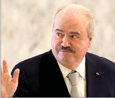
وزير المال ياسين جابر

عقد وزير المال ياسين جابر مؤتمر صحفي بعد قرارات مجلس الوزراء امس اعتبر فيه «اننا وصلنا إلى أزمة متصاعدة وكان لا بد من قرار فجري تفاوض مع العسكريين مع التأكيد أنّ إقرار الزيادة من دون مداخل سيعرض البلد لأزمة». ورأى جابر ان «أكثر من ٥٠ بالمئة من الموازنة العامة تذهب للرواتب وكان لا بد من اتخاذ خطوات لتأمين أموال». وكشف ان «٣٠٪ من البضاعة المستوردة معفاة من القيمة المضافة». وشدد جابر على ان «صندوق النقد الدولي كان واضحاً بعدم وجوب اتجاه لبنان إلى إقرار زيادات من دون تأمين مداخل كي لا نعود إلى الأزمة السابقة». وتابع: «اتخذنا القرار تطبيق الزيادة على البنزين فوراً لمنع السوق السوداء أما تنفيذ الزيادة على TVA فيحتاج إلى قانون ولن يتم بشكل فوري».