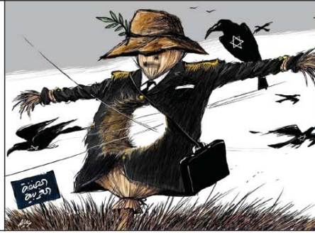
رسم أمجد رسمي (الأردن) 2026