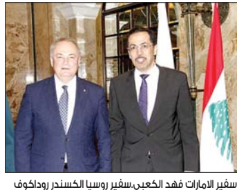
سفير الامارات فهد الكعبي. سفير روسيا الكسندر روداكوف