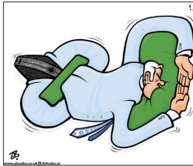
رسم عماد حجاج (الأردن) 2026