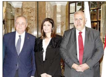
الحافظ مروان عبود وعقيلته. سفير روسيا الكسندر روداكوف