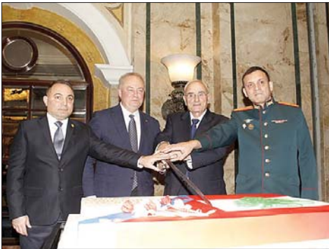
قطع قالب الحلوى

إضافة إلى شخصيات سياسية وعسكرية وأمنية وقضائية وديبلوماسية وإعلامية وثقافية واجتماعية واقتصادية.