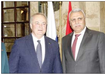
اللواء حسن شقير. سفير روسيا الكسندر روداكوف

إضافة إلى شخصيات سياسية وعسكرية وأمنية وقضائية وديبلوماسية وإعلامية وثقافية واجتماعية واقتصادية.