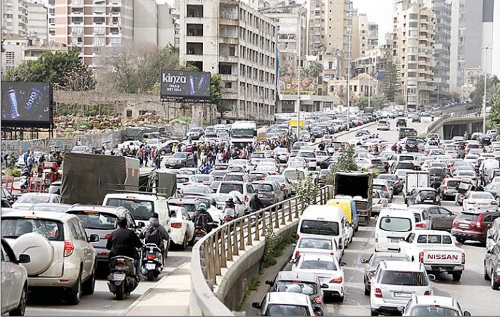
قطع جسر الرينغ