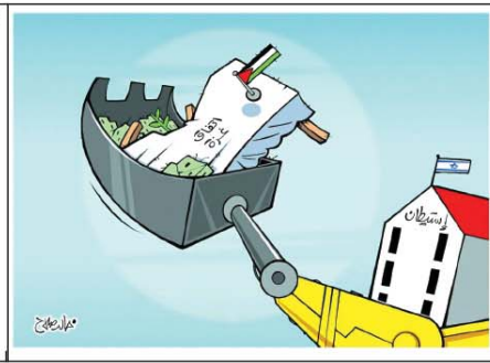
رسم خالد صلاح (مصر) 2026