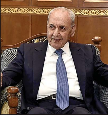
الرئيس نبيه بري

بإستهداف المدنيين وخاصة الأطفال منهم وآخرهم ملاك الجنوب وقمره الطفل الشهيد علي حسن جابر، إن صومكم وحياءكم لأعمال شهر رمضان في هذه الأمكنة وصمودكم وصبركم هو قمة الإيمان بالله والأرض والإنسان وتضحياتكم هي مقياس الإنتماء الوطني الأصيل وهي فعل لا بد أن يثمر عودة وتحريراً وقيامه وأملًا للبنان».