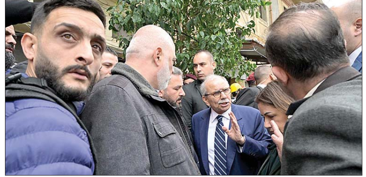
سلام خلال الجولة