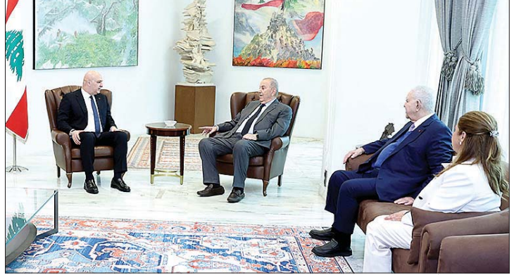
عون مستقبلاً علاوي

توفير مسارات مهنية للشباب اللبناني الساعين الى بدء حياتهم المهنية وتحقيق الهدف الاسمي المتمثل في تصدير المنتجات لا الأشخاص من لبنان. واستقبل الرئيس عون الرئيس السابق للحكومة العراقية اياد علاوي واجرى معه جولة افق تناولت الأوضاع الراهنة على الساحة العربية. وخلال اللقاء الذي حضره صباح علاوي ومنى علوش، تناول البحث العلاقات اللبنانية- العراقية والتعاون القائم بين البلدين من خلال الدعم الذي يقدمه العراق للبنان في الظروف الراهنة.