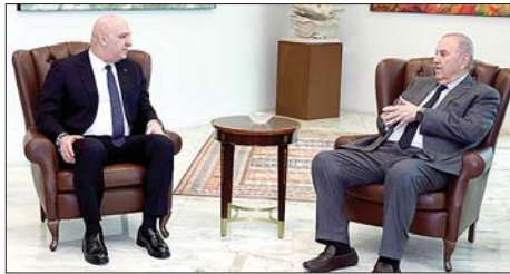
عون عرض المستحقات العربية مع ابياد علاوي