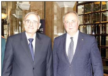
الوزير ميشال منسى. سفير روسيا الكسندر روداكوف