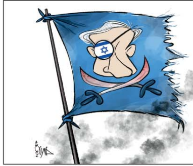
رسم خالد الهاشمي (البحرين) 2025