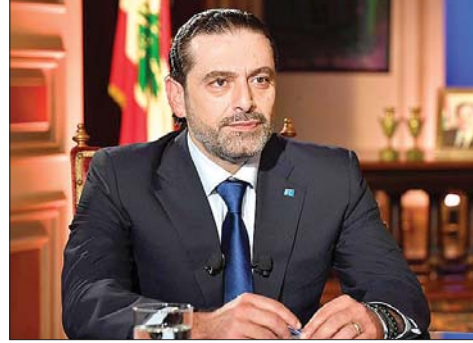
الرئيس سعد الحريري

أتحدث عن الفراغ السني، بل عن الفراغ على مستوى الوطن، الذي يحتاج إلى رجال ومشروع أرسى قواعده والده الشهيد الكبير رفيق الحريري، وحمل رايته بعد ذلك ولده البار الشيخ سعد الحريري، أدامه الله بصحة وعافية. كررت عليه الإلهام الذي حُمّلت، وليس رغبة ذاتية فحسب، وإيها كثيرون هم الذين حملوني رغبتهم وعواطفهم بضرورة عودته، وأن يستعيد تيار المستقبل نشاطه. وأمل كبير، كما لمست منه، أن يعود «المستقبل» إلى الحضور السياسي. وأمل أن تكون المشاركة في الانتخابات على قدم وساق».