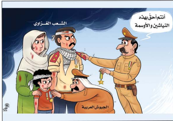
رسم فهد البجادي (سوريا) 2026