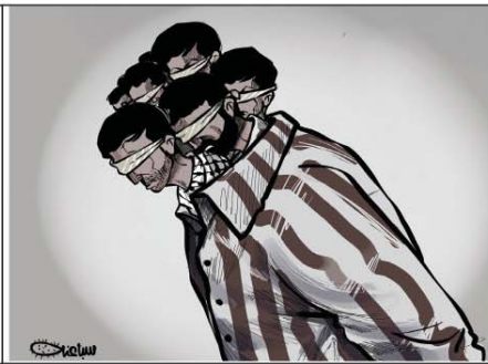
رسم محمد سباعنة (فلسطين) 2026