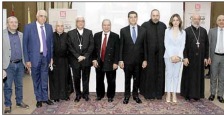
«كاريتاس» أطلقت حملة الصوم السنوية