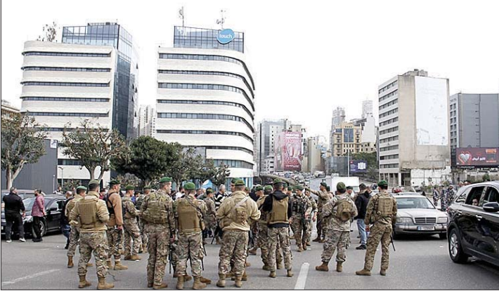
والقوى الأمنية تتصدى

خرجت الحكومة السّلامية "سالم" من قطوع زيادة الاجور للقطاع العام والمرحلة الثانية من حصر السلاح شمال البطاني. لكن غضب الشارع والرأي العام الشعبي والسياسي سيحاصرها ولو ظرفياً، رفضاً لقراراتها التمويلية للزيادات، وفي مقدمها فرض 300 ألف ليرة على صفحة البنزين، وقد سارع اصحاب المحطات الى اصدار جدول الاسعار مع طلوع الفجر، حاملاً زيادة 361 الف ليرة على الصفحة، اضافة الى رفع الضريبة على القيمة المضافة 1 في المئة.