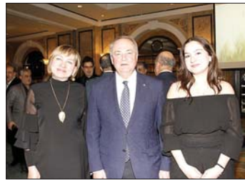
الغيا. سفير روسيا الكسندر روداكوف. زوليفيا