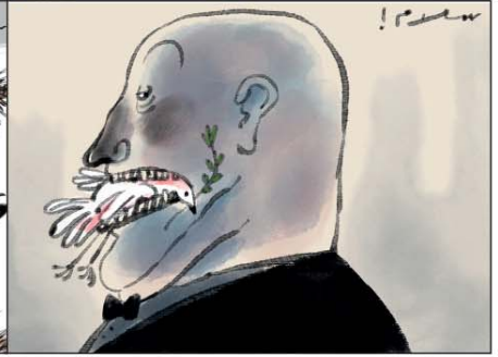
رسم حماد العدل (مصر) 2026