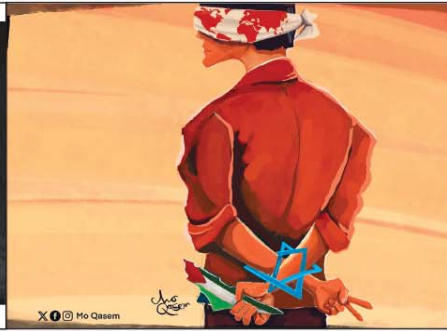
رسم مو قاسم (فلسطين) 2023