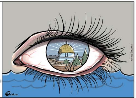
رسم أحمد قدورة (فلسطين) 2026