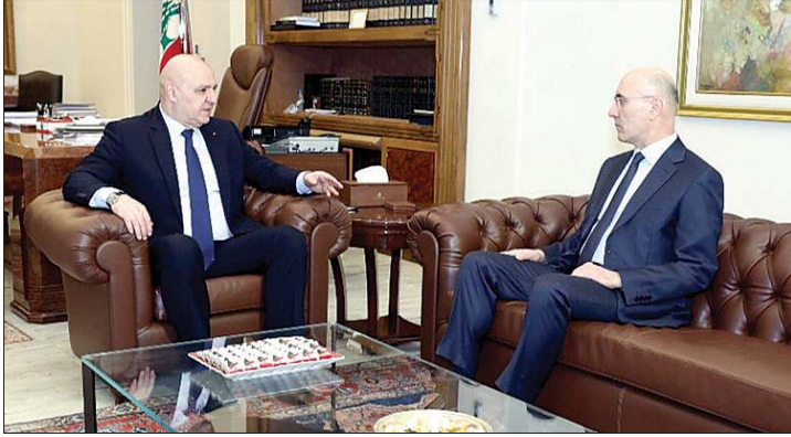
عون مستقبلاً الحجار

على وقع تهديدات الرئيس الأمريكي دونالد ترامب بـ"اندثار حضارة بأكملها" الليلة، وتأكيد هذه الليلة ستكون واحدة من أهم اللحظات في التاريخ الطويل والمعقد للعالم، وأن 47 عاما من الابتذال والفساد والموت سنتهي أخيراً، يعيش العالم متربحاً بطبيعة "المفاجأة" المتوقعة خلال ساعات. فيما يعيش اللبنانيون كل يوم مفاجأة من نوع المأساة تحل بهم من صاروخ إسرائيلي يتسبب به مواطن يفترض انه لبناني، فيقتل اخوة له في المواطنة لا علاقة لهم بالحرب.