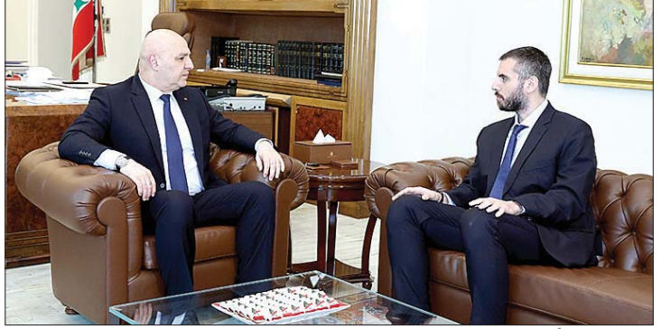
عون مستقبلاً المر