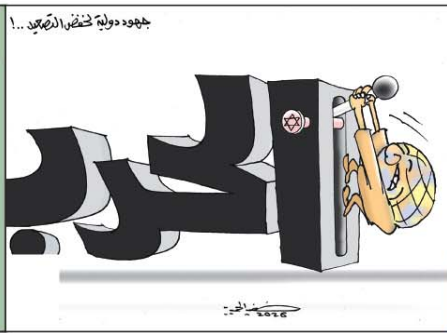
رسم حضير الحميري (العراق) 2026