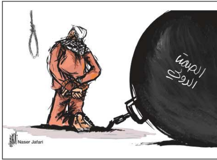
رسم ناصر الجعفري (الأردن) 2026