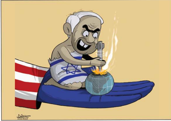
رسم كمال شرف (اليمن) 2026