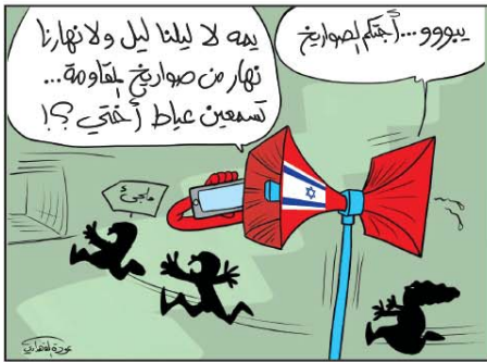
رسم عودة الفهداوي (العراق) 2026