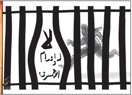
رسم دعاء العدل (مصر) 2026