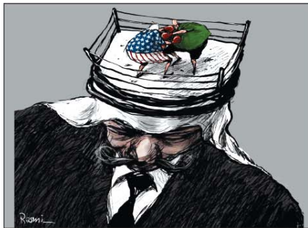
رسم أمجد رسمي (الأردن) 2026