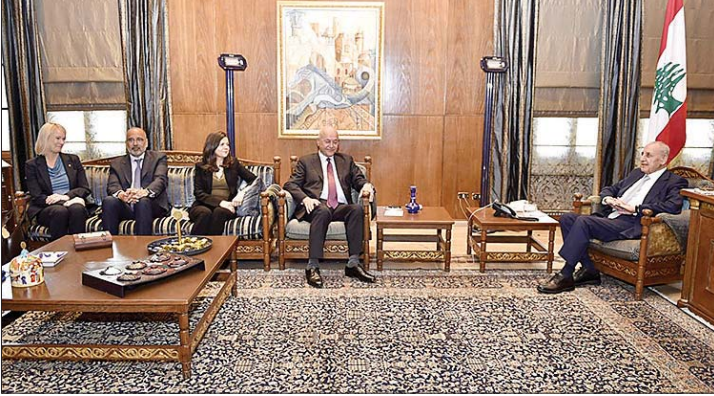
بري مستقبلاً الوفد الأممي

عدد القتلى 303، بينهم 30 طفلاً و71 امرأة، فيما بلغ عدد الجرحى 1150، من بينهم 143 طفلاً و358 امرأة. كما توقفت الرسالة عند ما تعرّضت له المؤسسات الطبية والإسعافية من اعتداءات منذ 2 آذار 2026، منها 17 اعتداءً على مستشفيات و101 اعتداءً على الجهات الإسعافية، أدت إلى مقتل 73 مسعفاً وجرح 176 آخرين.