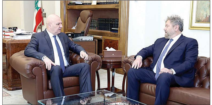
لقاء عون وافرام

نحو مستقبل جديد، لا دمار فيه، ولا حرب، ولا وجع. نشاهد ما تخلفه الحرب، واذا كان بإمكاننا الوصول الى مرحلة وقف العدوان، ضمن مسار نحو السلام مبني على العدالة وحماية لبنان، وعلى غد افضل لأبنائه، فهذه أمنيتنا. أتجنى ان ندخل المفاوضات في اسرع وقت بطريقة بناءة، وجميع اللبنانيين يجب ان يفكروا ان لديهم مصلحة في ذلك، وينظروا الى المفاوضات كمصلحة لهم، خيمة الشرعية اللبنانية هي لجمع اللبنانيين، وتحميمهم جميعا. ونحن اليوم لانفك إلا بالموجود في لبنان، وبالأراضي التي لا نريد خسارتها».