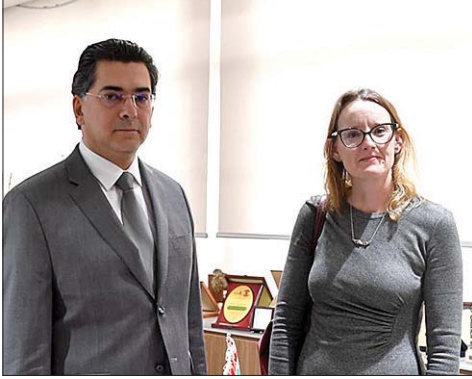
مرقص مستقبلاً ارديل

وتوفير الحماية لهم. لذلك نؤكد ضرورة احترام هذه القواعد وتطبيقها. من جهتها ارديل، أبدت «قلق اليونيفيل الشديد إزاء الوضع في جنوب لبنان، خصوصاً ما يتعلق بالمدنيين»، وقالت: «نحن نعمل بشكل وثيق لإعادة الاستقرار الأمني الذي كان قائماً سابقاً، لكن من الواضح أن الوضع الآن مختلف جداً». من جهة ثانية وجّه وزير الإعلام امس بواسطة وزارة الخارجية والمغتربين كتابين إلى كل من الدكتور موريس تيدبول-بنز (Morris Tidball Binz)، المقرر الخاص المعني بحالات الإعدام خارج القضاء أو بإجراءات موجزة أو تعسفاً، والسفيرة كارولين زيادة، المندوبة الدائمة ورئيسة بعثة لبنان لدى الأمم المتحدة في جنيف للاحتجاج أمام المجلس لتقديم الاجراءات اللازمة. وتضمن الكتابان عرضاً مفصلاً للاعتداءات الإسرائيلية التي استهدفت الجسم الإعلامي، والتي تُعدّ خرقاً لاتفاقيات جنيف، كما أشار إلى أن عدد الإعلاميين الشهداء منذ بدء الاعتداءات الإسرائيلية عام ٢٠٢٣ وحتى تاريخه بلغ ٢٨ شهيداً، إضافة إلى عدد من الجرحى. وطالب الكتابان بالتحرك على الصعيد الدولي، وضمان توفير الحماية اللازمة للصحافيين أثناء تأدية واجبه المهني.