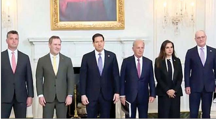
المباحثات اللبنانية - الإسرائيلية

يجب أن يتم التوصل إليه بين الحكومتين، بوساطة أميركية، لا عبر أي مسار منفصل. كما أوضحت أن هذه المفاوضات قد تفتح الباب أمام مساعدات كبيرة لإعادة الإعمار والتعافي الاقتصادي في لبنان، وتوسيع فرص الاستثمار لكلا البلدين. وأعربت إسرائيل عن دعمها لنزع سلاح جميع الجماعات غير التابعة للدولة، وتفكيك كل البنى التحتية لها في لبنان، مؤكدة التزامها بالعمل مع الحكومة اللبنانية لتحقيق هذا الهدف، بما يضمن أمن شعبي البلدين. كما أكدت إسرائيل التزامها بالانخراط في مفاوضات مباشرة لتسوية جميع القضايا العالقة والتوصل إلى سلام دائم يعزز الأمن والاستقرار والازدهار في المنطقة. من جانبه، جدد لبنان التأكيد على الحاجة الملحة إلى التنفيذ الكامل لإعلان وقف الأعمال العدائية الصادر في نوفمبر 2024، مشدداً على مبادئ سلامة الأراضي والسيادة الكاملة للدولة، وداعياً في الوقت نفسه إلى وقف إطلاق النار واتخاذ إجراءات ملموسة لمعالجة الأزمة الإنسانية الحادة التي لا يزال البلد يعاني منها نتيجة النزاع المستمر والتخفيف من تداعياتها. واتفقت جميع الأطراف على إطلاق مفاوضات مباشرة في زمان ومكان يتم التوافق عليهما».