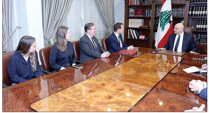
عون مستقبلاً الوفد البريطاني

لا سيما تلك المتعلقة بحصرية السلاح ستندف ما فيه مصلحة لبنان وتأميناً لحماية جميع اللبنانيين التواقين الى رؤية دولتهم مسؤولة وحدها عن حفظ الامن والاستقرار والسلامة العامة في البلاد». وشكر الرئيس عون الوزير فالكونر على «الدعم الذي قدمته بريطانيا ولا تزال في مختلف المجالات، لا سيما دعم الجيش وإقامة الأبراج على الحدود، والمساعدات الإنسانية والاغاثية التي تنوي تقديمها لتخفيف من معاناة اللبنانيين عموماً والنازحين منهم خصوصاً».