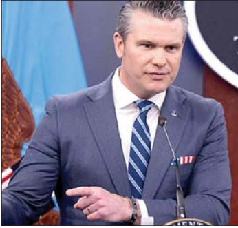
وزير الدفاع الأميركي

سيتم داخل المياه الإقليمية الإيرانية وفي المياه الدولية. وتوعد وزير دفاع إسرائيل كاتس الخميس إيران بضربات «أشد إيلاماً» إذا رفضت المقترح الأميركي الذي يركز على التخلي عن «التسلح النووي»، وذلك في مباحثات تجري بوساطة باكستانية. وقال كاتس «تقف إيران عند مفترق طرق تاريخي، أحد الطرفين هو التخلي عن نهج الإرهاب والتسلح النووي... بما يتماشى مع المقترح الأميركي، أما الطريق الآخر فيؤدي إلى الهاوية». وأضاف «إذا اختار النظام الإيراني الطريق الثاني، فسيكتشف وبشكل سريع أن هناك أهدافاً أكثر إيلاماً من تلك التي قمنا بضربها» في الحرب المشتركة التي بدأت في ٢٨ شباط/فبراير. وأكد رئيس هيئة الأركان الأميركي الجنرال دان كين ان الحصار على إيران يشمل قمع السفن بصرف النظر عن العلم الذي ترفعه، مشيراً إلى «ان قواتنا لا تزال مستعدة لاستئناف القتال».