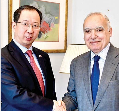
سلامة وسفير الصين

استقبل وزير الثقافة الدكتور غسان سلامة في مكتبه في المكنبة الوطنية - الصنائع السفير الصيني في لبنان تشن تشواندنج حيث جرى البحث في المستجدات والتطورات الحاصلة والعلاقات الثنائية على مختلف الاصعدة ومن ضمنها القطاع الثقافي وتعزيزه وفق ما اوضح السفير اثر اللقاء حيث قال: «تشرفت بقاء الوزير سلامة وكانت مناسبة عرضنا خلالها اهمية تعزيز التبادل الثقافي بين بلدينا واكدت على المضي قدما في استكمال بناء الكونسرفتوار الوطني في منطقة ضبية الممول من الحكومة الصينية واهمية افتتاحه لما يشكل من صرح ثقافي له دلالات كثيرة للبنان البلد الذي يعتبر المركز الثقافي الرئيس في المنطقة».