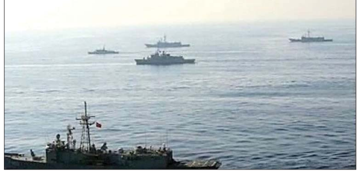
البحرية الأميركية وحصار الصين والهند من خلال إيران

تتفرق إلى النزاع الراهن على أنه «معركة بقاء» لا تقبل المساومة. وفي تضارب للأبناء حول اختراق طهران للحصار وفعاليتها من طرف القوات الأميركية، أوضحت شبكة «سي إن إن»، وفقاً لمصادرها، بأن الولايات المتحدة تفرض حصاراً على الموانئ الإيرانية وليس على مضيق هرمز نفسه، وبالتالي لا يمكن اعتبار التقارير التي تتحدث عن عبور سفن عبر المضيق انتهاكاً للحصار المعلن. وتعكس هذه التحليلات التعقيدات الجيوسياسية المحيطة بالحصار الأميركي، حيث توازن واشنطن بين رغبتها في عزل إيران اقتصادياً، وحاجتها إلى تجنب تصعيد غير محسوب مع قوى كبرى مثل الصين، في وقت تشهد فيه المنطقة توتراً متصاعداً قد تكون له تداعيات واسعة على أسواق الطاقة والأمن الدولي.