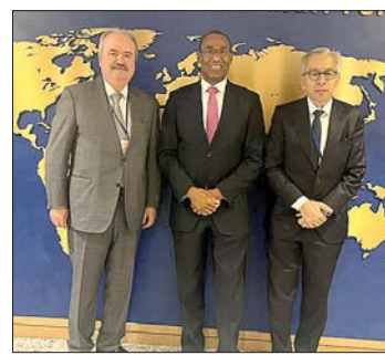
جابر والبساط في واشنطن

يواصل الوفد اللبناني مشاركته في اجتماعات الربيع للبنك الدولي و صندوق النقد الدولي في واشنطن، وفي هذا الإطار أجرى وزير المال ياسين جابر الذي يرأس الوفد اللبناني، مباحثات مع مسؤولين كبار في البنك الدولي وآخرين من مؤسسات نروحية داعمة، وذلك بغية المساهمة في معالجة تداعيات الحرب القائمة وتأثيراتها السلبية على العديد من المجالات الاقتصادية والانسانية، إضافة إلى متابعة المشاريع الإنمائية القائمة وتعزيز التعاون مع الدول الصديقة.