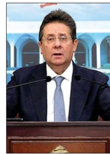
النائب ابراهيم كنعان

هو الاستقرار الداخلي وعماده الشرعية اللبنانية، والخط الثاني الذي لا يجب ان نتجاوزه هو حضورنا على الساحة الدولية، ديبلوماسيا، حتى لا نبكي على الاطلاق في ما بعد ونعدد الحالات التي مررنا بها على مر التاريخ ونقول ان الاتفاق جاء على حسابنا ولم تكن موجودين على الطاولة. لذلك، فان القضية لا تتعلق بأحد متشبهت برأيه او بوجود خيار آخر. لدينا ممر الزامي هو من جهة تعزيز استقرارنا الداخلي وبواسطة الدولة ومؤسساتها وعلى رأسها الجيش، والثاني هو تعزيز حضورنا واستعمال كل الظروف واستخدام وتوظيف كل السياسات لمصلحة إيصال حقوق لبنان وحمائته مع شعبه».