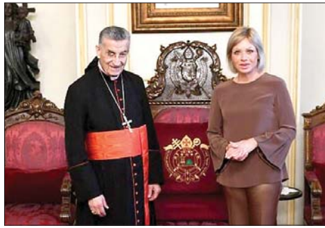
لقاء الراعي وبلاسخارت

الزيارة في سياق وضعه بتفاصيل القرى الجنوبية الحدودية في ظل الحرب الدائرة، وشدد على «ضرورة تأمين الحماية والدعم لأهالي القرى الصامدة»، فالنائب الدويهي حيث قدم مع الوفد المرافق ملف عجيبة الشفاء سيدة المطران جوزيف نفاع، بعد عودته من روما. وقد كانت القديسين في الفاتيكان.