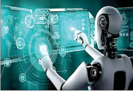
نماذج ذكاء اصطناعي

مع استخراج النماذج باعتباره تجسساً صناعياً، وفرض عقوبات صارمة.