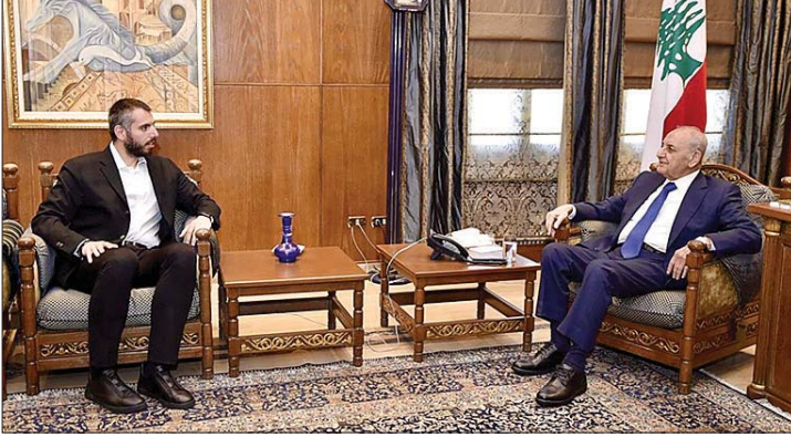
لقاء بري والمر

مجلس الشورى في الجمهورية الإسلامية الإيرانية محمد باقر قاليباف تداولوا في خلاله في آخر تطورات الأوضاع في المنطقة ولبنان ولا سيما في الجنوب حيث الذي يجري هناك جراء العدوان الإسرائيلي المتواصل كما جرى في قطاع غزة، وتم التأكيد على «وجوب أن يشمل وقف إطلاق النار لبنان قبل أي أمر آخر».