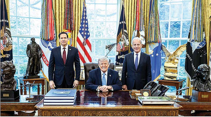
ترايب مستقبلاً روبيو ويعيسى

كتب رئيس الولايات المتحدة الأمريكية دونالد ترامب، أمس عبر منصة "تروث سوشل"، "أجريت للتو محادثات ممتازة مع الرئيس اللبناني جوزاف عون ورئيس الوزراء الإسرائيلي بنيامين نتنياهو. واتفق الرئيسان على بدء وقف إطلاق النار لمدة عشرة أيام، ابتداءً من الخامسة مساءً بتوقيت شرق الولايات المتحدة، (أي بدءاً من منتصف هذه ليل أمس، بتوقيت بيروت)، وذلك لتحقيق السلام بين بلديهما.