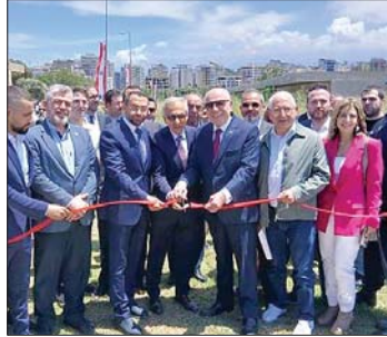
البساط مفتحاً المحطة

والنساء، وعلى الرغم من أن ما يحصل ليس عادياً، لكننا نؤمن في الوقت عينه انه بتعاوننا وبوضع يدنا بيد بعض يمكننا ان ننطق، وفي طرابلس أيضاً يمكننا ان نحول هذا المعلم الى مركز محوري وان يلعب دوره في المرتبة الأولى، ونتطلع كي تكون مشاريع معرض رشيد كرامي الدولي محطة، وان تستقطب الرموز التي بنت الاقتصادات في كبريات الدول العربية، وان نحول معهم هذه المساحة الى مجموعة مشاريع استثمارية اقتصادية ذكية.