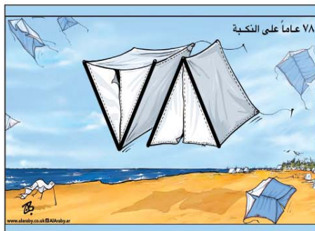
رسم عماد حجاج (الأردن) 2026