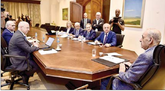
بري مترئساً اجتماع مكتب المجلس

الصادر ٢٠١١ واعتبرت احكامه نافذة. وأفيد ان تم ربط تنفيذ أحكام العفو بالحق الشخصي أي انه لن يستفيد أي محكوم من العفو إلا إذا أسقط الحق الشخصي. كما ان الإدغام أقر باعتدال الحكم الأعلى مع حق القاضي بالجمع بسقف ربع العقوبة الأشد. وتم اقرار العفو عن التعاطي وترويج المخدرات غير المنظم واستثناء الترويج للمنظم والتجارة. وفي