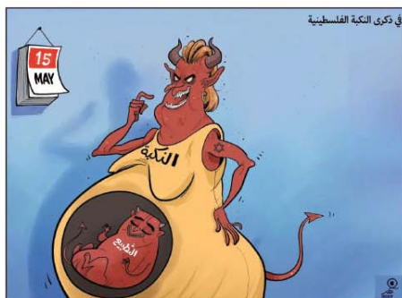
رسم فهد البجادي (سوريا) 2026