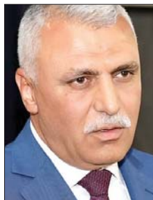
اللواء حسن شقير

اعلن مكتب شؤون الإعلام في المديرية العامة للأمن العام في بيان ان «المدير العام للأمن العام اللواء حسن شقير زار العراق حيث اجتمع مع رئيس مجلس الوزراء علي فالح الزبيدي متمنياً له التوفيق في مهامه على رأس الحكومة العراقية الجديدة، وأكد سبل تطوير العلاقات في مجالات عديدة، وشاكراً له وللعراق الشقيق الموقف الإنساني والأخوي تجاه لبنان. كما وعد الرئيس الزبيدي استمرار وتطوير العمل في مختلف المجالات بين البلدين، وواعداً بزيارة لبنان قريباً، كما زار الرئيس محمد شياح السوداني شاكراً له مواقفه تجاه لبنان من مساعدات ومواقف مؤيدة للبنان في المرحلة الماضية».