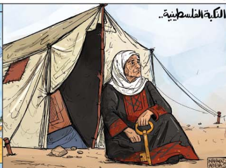
رسم محمود عباس (فلسطين) 2026