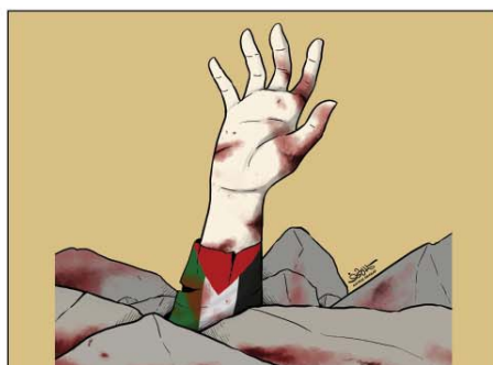
رسم كمال شرف (اليمن) 2026