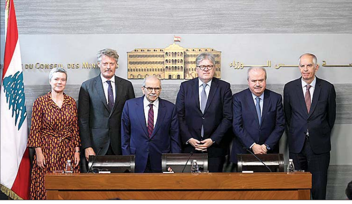
احتفال التوقيع في السراي

أطلقت امس الحكومة اللبنانية والاتحاد الأوروبي والدنمارك وفرنسا، من خلال الوكالة الفرنسية للتنمية، برنامجاً بقيمة ٣٢ مليون يورو يهدف إلى دعم المناطق المتضررة من النزاع في جنوب لبنان والبقاع. ووُضع البرنامج في الأصل عقب وقف إطلاق النار في تشرين الثاني ٢٠٢٤. ويتم الآن إطلاقه في وقت عصيب يمر به لبنان، وقد جرى تعديله وفقاً لذلك لدعم المؤسسات الوطنية في الاستعداد للتعافي، مع دعم الاستجابة للاحتياجات العاجلة على الأرض. وبمجرد أن تسمح الظروف، سيدعم البرنامج التعافي في المدى الطويل من خلال تعزيز قدرات السلطات المحلية، ومساعدة المؤسسات المحلية على استئناف أعمالها، ودعم الزراعة المستدامة، وإيجاد فرص عمل للفئات الأكثر ضعفاً. وأقيم حفل الإطلاق في السراي الكبير بحضور رئيس مجلس الوزراء الدكتور نواف سلام، ووزير المالية ياسين جابر، والمدير العام بالإناة لمنطقة الشرق الأوسط وشمال إفريقيا والخليج في المفوضية الأوروبية مايكل كارنيتشنيغ، وسفيرة الاتحاد الأوروبي في لبنان ساندر دو وال، والسفير الفرنسي في لبنان هيرفيه ماغرو، والسفير الدنماركي في لبنان كريستوفر فيفيك، إلى جانب ممثلين عن المؤسسات اللبنانية، والوكالة الفرنسية للتنمية، والمنظمات الشريكة. يُنفذ البرنامج على مدى أربع سنوات (٢٠٢٦-٢٠٢٩)، وسيدعم جهود التعافي في المناطق المتضررة بشدة من تداعيات النزاع، في جنوب لبنان والبقاع. وتبلغ ميزانية البرنامج الإجمالية ٣٢ مليون يورو، ممولة بمنحة من الاتحاد الأوروبي مقدارها ٢٤,٨ مليون يورو، وقبول مشترك من وزارة الخارجية الدنماركية بنحو ٥,٣٥ مليون يورو، ومساهمة من الوكالة الفرنسية للتنمية بقيمة مليوني يورو.