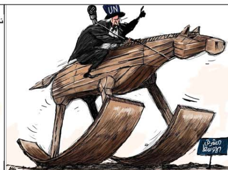
رسم أمجد رسامي (الأردن) 2026