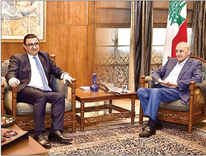
لقاء بري والحاج

استقبل رئيس مجلس النواب نبيه بري في مقر الرئاسة الثانية في عين التينة، رئيس هيئة الشراء العام الدكتور جان العلية. على صعيد آخر، دعا الرئيس بري الى عقد جلسة عامة في الحادية عشرة من من قبل وبعد ظهر يوم الخميس الواقع في ٢١ ايار الحالي وذلك لدرس مشاريع وإقتراحات القوانين المدرجة على جدول الأعمال.