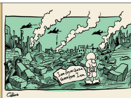
رسم أحمد قدورة (فلسطين) 2026