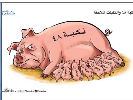
رسم علاء اللقطة (فلسطين) 2026