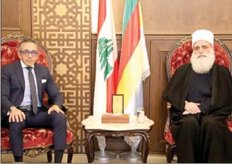
أبي المنى وسفير مصر

التقى شيخ العقل لطائفة الموحدين الدروز الشيخ الدكتور سامي ابي المنى في دار الطائفة - فردان، سفير جمهورية مصر العربية في لبنان علاء موسى، وتناول اللقاء الأوضاع العامة على مستوى لبنان والمنطقة ومسار المفاوضات الحاصلة، وقضايا عدة مطروحة. وأشار موسى بعد اللقاء الى اننا: «تحدثنا عن الوضع الإقليمي والمنطقة، وتمنيينا هدوء الأمور سريعاً، يقينا بان ما يجري في المنطقة يؤثر على لبنان والدول الأخرى، والوصول الى نهاية مقبولة في الفترة القليلة القادمة، كي يستطيع لبنان ان يركز بشكل أكبر على استقراره وأمنه وهو المطلوب بالنسبة