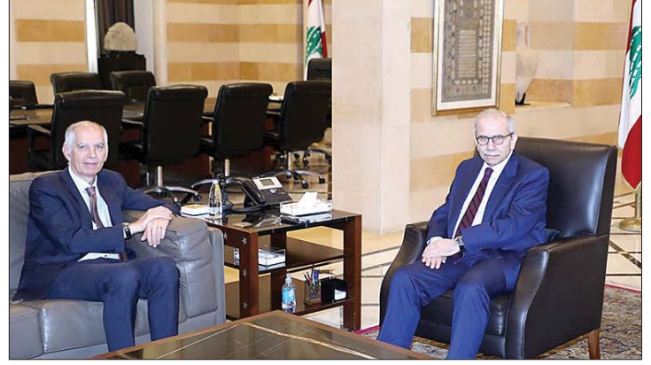
لقاء سلام وماغرو

استقبل رئيس مجلس الوزراء الدكتور نواف سلام، السفير الفرنسي هيرفيه ماغرو، وتم البحث في والاقتصادية.