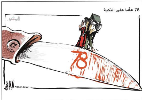
رسم ناصر الجعفري (الأردن) 2026