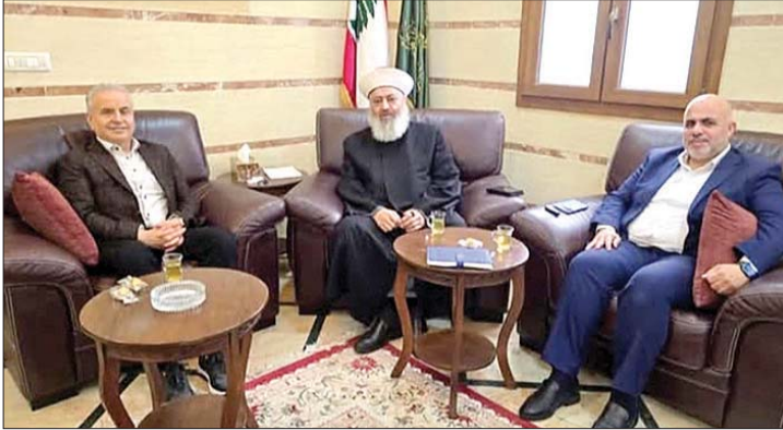
درغام في زيارة زكريا

وأكد المفتي زكريا أهمية تعزيز التعاون والتلقي بين مختلف المكونات الوطنية، والعمل بروح المسؤولية لما فيه مصلحة لبنان واللبنانيين، مشدداً على ضرورة مواصلة الجهود لمعالجة القضايا المعيشية والإنمائية التي تلامس حياة المواطنين بشكل مباشر.