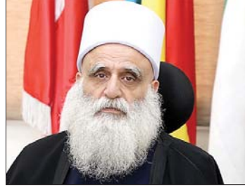
الشيخ سامي أبي المنى

الشعور بالمسؤولية التي يجب أن تتحملها المرجعيات الروحية إلى جانب رؤساء الدولة والقيادات السياسية»، مؤكداً أن «الجميع مسؤول ولا يمكن لأي طرف أن يتنصل من دوره، بل إن كل شخص، من موقعه وبطريقته، مطالب بالمساهمة في تخفيف وطأة الأزمة والعمل على الخروج من المحنة». وأوضح أبي المنى أن «الرؤساء الروحيين ليسوا قادة سياسيين، إلا أنهم يتمتعون بحضور وتأثير في الساحة اللبنانية، وأن رسالتهم الأساسية هي رسالة أخلاقية وروحية ووطنية»، مشدداً على «ضرورة مقاربة القضايا بعقلانية ووعي وحكمة، واعتماد الخطاب الهادئ والكلمة الطيبة بما يخفف من حدة الانقسام والحرب، لا أن يزيد التشنج والانقسام (...)».