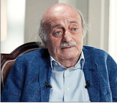
الوزير السابق وليد جنبلاط

ومستحيل. وأكد أن الجيش جنوداً من الطائفة الشيعية في اللبناني لن يخوض مواجهة صفوفه لن يقبلوا بشن حرب مع «حزب الله» نظراً لتكوينه ضد الحزب استجابةً لأوامر أو إمدادات أميركية وإسرائيلية.