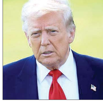
الرئيس دونالد ترامب

مضيفاً: «وهو رئيس وزراء في زمن الحرب». وتمسك ترامب بنبرته المتفائلة، مؤكداً أن المحادثات مع إيران «تتطور بسرعة»، وأن «لن يكون هناك سلاح نووي، وستحدث أشياء جيدة كثيرة أخرى». وقال ترامب إنه يعتقد أن المرشد الإيراني مجتبي خامنئي «منخرط في الأمر، بالتاكيد»، في اتخاذ القرارات المتعلقة بكيفية إنهاء الحرب، مضيفاً أن «لديهم احتراماً كبيراً له».