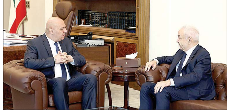
عون مستقبلاً المر