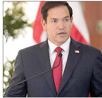
الوزير ماركو روبيو

روبيو: «نحن في مرحلة تفاوض على الكثير من النقاط مع إيران، ولن نسمح لإيران بالحصول على سلاح نووي تختبئ خلفه». وأشار إلى أن إيران رفضت كثيراً التفاوض على البرنامج النووي والآن تراجع وتوافقت. وأعرب روبيو عن أمه في التوصل لنتيجة مقبولة بشأن مضيق هرمز، مؤكداً أن الردع الإيراني التقليدي تأكل بشكل كبير. وأضاف روبيو أن النظام الإيراني متصدع، والحصول على رد من قيادته يتطلب أياماً، مشيراً إلى أن الإيرانيين وافقوا على التفاوض بشأن التخلي عن البرنامج النووي. وقال وزير الخارجية الأمريكي إن أي تخفيف للعقوبات ضد إيران سيكون مشروطاً بالتزامات نووية حقيقية، مشدداً بالقول: «لن نخفف العقوبات على إيران لمجرد فتح مضيق