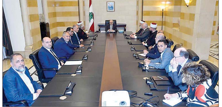
الوفد الشمالي في السرايا

استقبل رئيس مجلس الوزراء الدكتور نواف سلام امس في السرايا، سفير دولة قطر لدى لبنان الشيخ سعود بن عبد الرحمن آل ثاني، وتناول البحث الأوضاع في لبنان والمنطقة. وشكر الرئيس سلام دولة قطر على دعمها المستمر للبنان. والتقى سلام، وفدا من طرابلس والشمال، ضم مفتي طرابلس الشيخ محمد إمام، مفتي عكار الشيخ زيد زكريا، رئيس غرفة التجارة والصناعة والزراعة في طرابلس والشمال توفيق دبوسي، وأعضاء لجنة متابعة مطار الرئيس الشهيد رينيه معوض. وأوضح دبوسي، في تصريح بعد اللقاء «نحن على توافق مع دولة الرئيس والحكومة على أن طرابلس الكبرى، الممتدة من البترون إلى عكار، قادرة على أن تكون العاصمة الاقتصادية للبنان. كما أنها مؤهلة لتشكيل مركزا إقليميا على مستوى المنطقة وشرق المتوسط (...).» ورأى دبوسي اننا «أمام فرصة للسلام في المنطقة، وهذه المرحلة تتطلب إطلاق مشاريع كبرى تعيد إلى لبنان دوره الاقتصادي والاستثماري (...).» ومن زوار السرايا، وفد من مجلس التنسيق المسيحي برئاسة فؤاد أبو ناضر، وضمّ نائب الرئيس نعيم فرح وروي حداد. وأكد فرح في تصريح «تأييدنا المطلق والقوي للقرارات الشجاعة وغير المسبوقة التي اتخذتها السلطة التنفيذية، ممثلة بفخامة رئيس الجمهورية العماد جوزاف عون ودولة رئيس مجلس الوزراء الدكتور نواف سلام. فالقرارات السيادية التي اتخذت لأول مرة منذ نصف قرن، وما نتج عنها من خطوات وإجراءات تؤمن سيادة الدولة في الداخل والخارج، تشكل المسار الصحيح والوحيد للوصول إلى الاستقرار (...).»