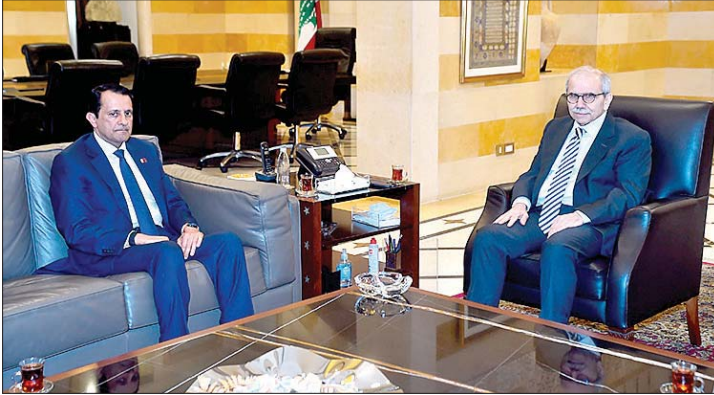
سلام مستقبلاً سفير قطر

كاملة. وأكدت خلال ترؤسها اجتماع الهيئة الإدارية لـ"مؤسسة جبل الأرز"، في معرأب، أن حصر السلاح بيد الدولة اللبنانية لم يعد مطلباً سياسياً لفريق دون آخر، بل أصبح ضرورة وطنية ملحة لحماية اللبنانيين ومنع تكرار المأساة التي عاشها الجنوب وسائر المناطق اللبنانية خلال السنوات الماضية. وختمت جعجع بالتأكيد أن مستقبل لبنان لا يمكن أن يُبنى إلا على قاعدة الدولة ومؤسساتها الشرعية، واحترام الدستور والقانون، والالتزام إلى الإرادة الشعبية عبر المؤسسات الدستورية، بعيداً من منطلق السلاح والشارع والفرص والإكراه.