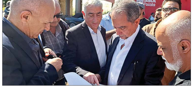
الصدى في جولته التفقدية

على أن يعود لاحقاً للاطلاع على ما تم إنجازه ومتابعة تنفيذ الخطط المقررة.