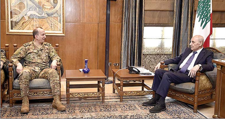
بري مستقبلاً قائد الجيش