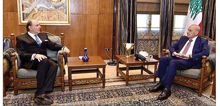
بري مستقبلاً سعيد

بو صعب ان الرئيس بري «طلب أن نجهز الأجواء وتحضير الأرضية الملائمة بهدوء و«رواق» لإقامة هيئة عامة من أجل التشريع واستكمال جدول الأعمال الذي وضع من قبل هيئة مكتب المجلس في آخر اجتماع، والجميع يعرف أنه تم تأجيل الجلسة لأسباب صارت خارج إرادتنا، وهي التوترات التي كانت تحصل والتحريض الذي يتم في الشارع». واستقبل الرئيس بري حاكم مصرف لبنان كريم سعيد وبحث معه في الأوضاع العامة، خصوصا المالية منها. وعرض بري مع قائد الجيش رودولف هيكل، لآخر المستجدات السياسية والميدانية على ضوء مواصلة إسرائيل عدوانها على لبنان وأوضاع المؤسسة العسكرية.