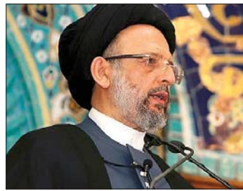
السيد علي فضل الله

يختلف اللبنانيون في طوائفهم ومذاهبهم ومواقفهم السياسية وأطهرهم الحزبية، ولكنهم لا ينبغي أن يختلفوا فيما يهدد هذا الوطن بعدما أصبح واضحا للجميع أن العدو لا يستهدف طائفة أو مذهباً أو موقفاً سياسياً بل يمس الوطن كله».