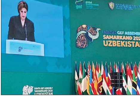
الزین تتحدث في المؤتمر

أعلنت وزيرة البيئة الدكتورة تمازا الزين، أن «لبنان، رغم عمق التحديات، يظل ثابتاً في التزامه البيئي وماضياً في تعزيز سياساته ومبادراته الرامية إلى حماية موارده الطبيعية وصونها»، مؤكدة أن «لبنان يواجه استحفاقاً وطنياً بالغ الأهمية يتمثل في جعل التأهيل البيئي محوراً أساسياً في جهود الإعمار والتعافي بعد الحرب». ولفتت إلى أن «الخسائر التي تكبدها القطاع البيئي جراء الحرب الإسرائيلية على لبنان ٢٠٢٣-٢٠٢٤، تجاوزت قيمته ٥١٢ مليون دولار أميركي، بالإضافة إلى الخسائر الناجمة عن حرب ٢٠٢٦». كلام الوزيرة الزين، جاء خلال كلمة ألقاها باسم لبنان في الجمعية العامة لمرافق البيئة العالمي المنعقدة في سمرقند في أوزبكستان، ولفتت إلى «إن حجم الأضرار التي لحقت بالأنظمة البيئية والموارد الطبيعية يرقى إلى