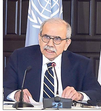
الرئيس نواف سلام