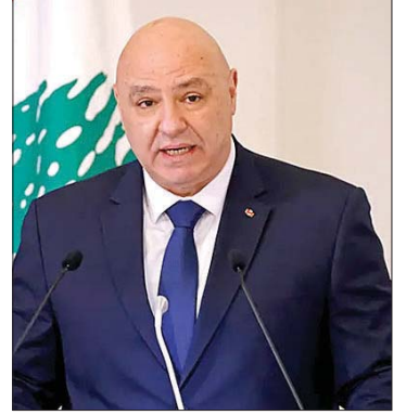
الرئيس جوزيف عون

فاعلة!!!!). ولكي لا أطيل أوافق على ما يلي: ١- يفهم بوقف إطلاق النار كامل وشامل دون قيد أو شرط برا وبحرا وجوا وبدون تجريف وهدم كل ما هو قائم . ٢- انسحاب حزب الله من جنوب الليطاني بالتوازي مع الانسحاب الإسرائيلي من المناطق التي احتلتها. باقي النص جائر لا يستحق الذكر به». واستقبل رئيس مجلس النواب نبيه بري في مقر الرئاسة الثانية في عين التينة نائب رئيس مجلس النواب الياس بوصعب، الذي قال: وجدت أن هناك جهداً يعمل عليه الرئيس بري سواء عبر التفاوض، أو من خلال التواصل الذي يتم معه للوصول إلى مرحلة نستطيع من خلالها الانتهاء من هذه الأزمة ومن هذه المرحلة الصعبة التي يمر بها لبنان.