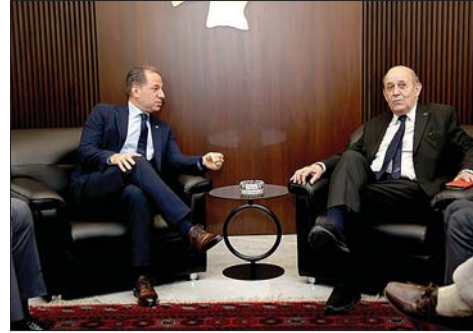
لقاء لودريان والجميل

اليوم الثاني على التوالي، يواصل الوفد الرئاسي الفرنسي الى لبنان جان ايف لودريان جولته على المسؤولين اللبنانيين.