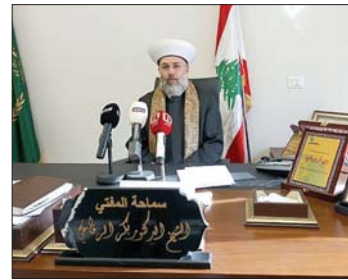
الشيخ بكر الرفاعي