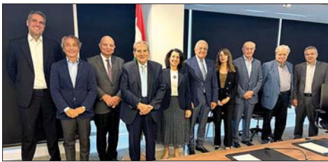
مجلس الأعمال اللبناني - اليوناني