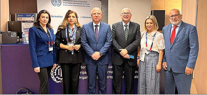
جمعية الصناعيين في جنيف