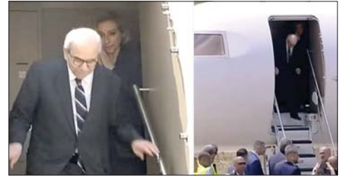
وصول الرئيس نواف سلام الى مطار القليعات

يشكل قرار إعادة تأهيل وتشغيل مطار الرئيس الشهيد رينيه معوض - القليعات محطة وطنية وإقليمية مفصلية في تاريخ لبنان الحديث، وخطة طال انتظارها لعقود طويلة من قبل أبناء الشمال واللبنانيين عموماً. فهذا المشروع لا يمثل مجرد تشغيل مرفق عام إضافي، بل يؤسس لمرحلة جديدة من التنمية المتوازنة ويعيد رسم الخريطة الاقتصادية والاستثمارية للبنان من بوابة الشمال.