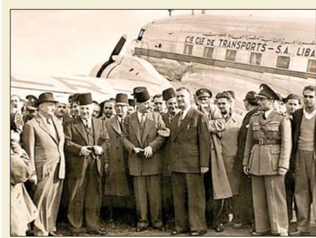
سنة 1949، طائرة شخصيات لبنانية رسمية (يبدو في الصورة الرئيس أحمد الأسعد ورياض الصلح وغيرهما) تحط في القليعات ليحضر افتتاح وحدة التفطير الثانية لشركة نفط العراق

مع مرور (77) عاماً... الحياة تعود إلى مطار القليعات في محطة تاريخية طال انتظارها، حيث أقامت وزارة الأشغال العامة والنقل حفل وضع حجر الأساس والإطلاق الرسمي للمرحلة التنفيذية من مشروع تطوير وتشغيل مطار الرئيس رينيه معوض - القليعات، برعاية وحضور رئيس مجلس الوزراء الدكتور نواف سلام ووزير الأشغال العامة والنقل فايز رسامي، إيداً ببدء الأعمال التنفيذية للمشروع الذي تتولى تطويره وتشغيله شركة Sky Lounge Services بعد فوزها بالمزايدة العمومية التي أطلقتها الوزارة. وكان في استقبال الرئيس سلام والوفد الرسمي المرافق، حشد من الشخصيات السياسية والدينية والاقتصادية والاجتماعية، يتقدمهم مفتي طرابلس والشمال الشيخ محمد طارق إمام ومفتي عكار الشيخ زيد بن محمد بكار زكريا، إلى جانب النواب والوزراء الحاليين والسابقين، ورؤساء الهيئات الاقتصادية، وفعاليات بلدية واختيارية وأهلية، فضلاً عن قادة وممثلي الأجهزة الأمنية والعسكرية والإدارية. وشهد الحفل حضور عدد من الوزراء والنواب والسفراء وممثلي الهيئات الاقتصادية والمؤسسات الدولية والجهات المعنية بقطاعي النقل والسياحة، إلى جانب شخصيات رسمية وعسكرية وإدارية واقتصادية، في مشهد عكس حجم الاهتمام الوطني بهذا المشروع الاستراتيجي، الذي يُنتظر أن يشكل رافعة إقتصادية واقتصادية للشمال وعكار ولبنان عموماً، وأن يعيد الحياة إلى أحد أهم المرافق الحيوية في البلاد.