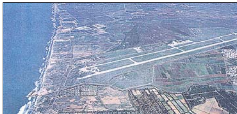
مطار القليعات صورة من الجو

مرفأ طرابلس يمتلك المقومات ليكون منصة إقليمية للنقل البحري والشحن التجاري، بينما يشكل المطار البوابة الجوية للمسافرين والبضائع، ويأتي معرض رشيد كرامي الدولي ليكون مركزاً للمعارض والمؤتمرات والأنشطة الاقتصادية الدولية. أما إعادة إحياء خط السكك الحديدية وربطه بالمطار والمرفأ، فستؤسس لممر اقتصادي