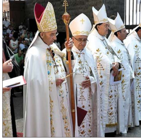
الراعي مترنساً القداوس

ترأس البطريرك الماروني الكاردينال مار بشارة بطرس الراعي قداس تكريس لبنان والانتشار لقب يسوع الأقدس وقلب مريم الطاهر في بازيليك سيدة لبنان - حريصا، وألقى عظة أكد فيها اننا «نريد دولة تنبض بالحق والعدالة والرحمة والكرامة الإنسانية ودولة تحمي أبناءها، وتداوي جراحهم، وتحتضن ضعفهم، وتفتح أمامهم أبواب الرجاء»، وقال: «لبنان صاحب حضور في حقل الرسالة. فهو أكثر من أرض وحدود، وأكثر من دولة ومؤسّسات، إنه رسالة حرية وكرامة وتعددية وعيش مشترك (...)» ولا يمكن أن يقوم لبنان بهذه الرسالة الفريدة، ما لم تعلنه الأمم المتحدة دولة حيادية بمفهومها الإيجابي النشط». ولفت الى ان «التكريس هو رسالة متواصلة من الإيمان والثقة والتجدد. إنه دعوة لأن تتجدد شعوبنا في الرجاء، وأن تستعيد أوطاننا رسالتها، وأن يبقى الإنسان في هذه المنطقة مؤمناً بأن الله حاضر في تاريخه، ومرافق لمسيرته، وعامل في قلب معاناته (...)». وتطرق الراعي الى الوضع الراهن، وقال: «فيما