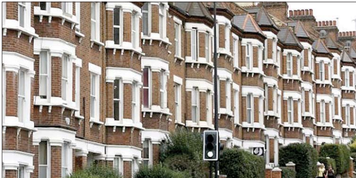
المنازل في بريطانيا

أسعار الفائدة في وقت لاحق من العام بدلاً من خفضها، في ظل استمرار الضغوط التضخمية المرتبطة بارتفاع أسعار الطاقة. ويتوقع المستثمرون حالياً احتمال رفع الفائدة بمقدار ربع نقطة مئوية مرة أو مرتين بحلول نهاية عام ٢٠٢٦، رغم أن فرص تحرك مماثل في اجتماع