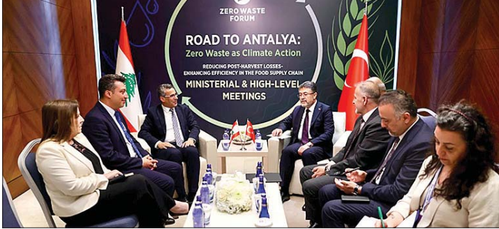
وزير الزراعة في مؤتمر Zero Waste Forum

على التعافي والصمود. وفي هذا الإطار، طلب دعماً عينياً يشمل الأسمدة الزراعية والأعلاف وأنظمة الري الحديثة والمعدات والآليات الزراعية، بما يساهم في مساندة المزارعين واستدامة الإنتاج الزراعي وتحسين الأمن الغذائي. وتناول اللقاء آفاق تطوير التعاون الزراعي بين لبنان وتركيا، حيث تم الاتفاق على المباشرة بإعداد اتفاقية تعاون زراعي ثنائية تشمل مجموعة من المجالات ذات الاهتمام المشترك، وفي مقدمتها حماية الغابات وإدارتها المستدامة والوقاية من حرائق الغابات والاستفادة من الخبرات التركية المتقدمة في هذا المجال، إضافة إلى تعزيز التعاون في قطاع الثروة السمكية وتربية الأسماك البحرية وتطوير مشاريع الاستزراع السمكي، بما يساهم في دعم الأمن الغذائي وتنمية الاقتصاد الريفي وخلق فرص جديدة للمجتمعات المحلية. وأكد الجانبان أهمية تعزيز الشراكة الزراعية بين البلدين وتوسيع مجالات التعاون الفني والعلمي وتبادل الخبرات والتقنيات الحديثة، بما يخدم التنمية الزراعية المستدامة ويعزز قدرة القطاع الزراعي على مواجهة التحديات البيئية والاقتصادية المتزايدة. وتأتي مشاركة الوزير هاني في هذا المنتدى الدولي في إطار جهود وزارة الزراعة اللبنانية لتعزيز التعاون الإقليمي والدولي، واستقطاب الدعم والشراكات اللازمة للنهوض بالقطاع الزراعي اللبناني، وتبني أفضل الممارسات العالمية في مجالات الاستدامة البيئية والإدارة الرشيدة للموارد الطبيعية.