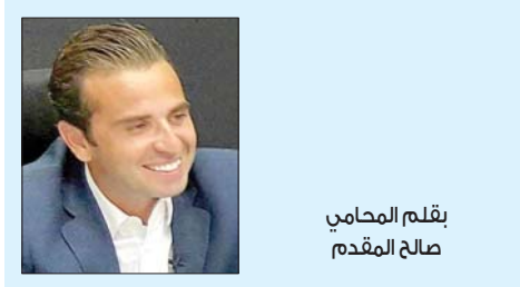
بقلم المحامي صالح المقدم

القادمين من الساحل السوري، ولا سيما من اللاذقية وطرطوس، وصولاً إلى محافظة حمص، حيث تشكل المسافة الزمنية إلى القليعات عاملاً تنافسياً مهماً مقارنة بمطارات أخرى في المنطقة.