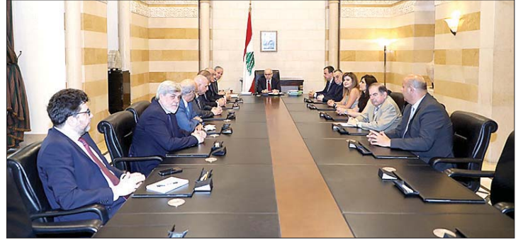
سلام ونقيب المهنة الحرة

عقد رئيس مجلس الوزراء الدكتور نواف سلام في السرايا الحكومية، اجتماعاً أمنياً تنسيقياً لمواكبة استئناف الصادرات إلى المملكة العربية السعودية، وشدد على "ضرورة الحفاظ على أعلى درجات اليقظة واتخاذ كل الإجراءات الوقائية المطلوبة، لصون الثقة التي أعيد بناؤها، بما يرسخ صدقية الدولة اللبنانية ويؤمن انسياب الصادرات إلى المملكة العربية السعودية". وأكد أن "أي إهمال أو تقصير في هذا المجال يشكل تهديداً للمصلحة الوطنية العليا"، وقال: "لن نقبل بالتهاون مع أي شكل من الأشكال". وكان سلام استقبل وفداً من نقابات المهنة الحرة. وخلال اللقاء، ألقى نقيب المحامين في بيروت عماد مرتينوس كلمة أكد فيها أن اللبنانيين مدعوون إلى الالتفاف حول المؤسسات الشرعية والعمل معاً لتجاوز المرحلة الدقيقة، داعياً إلى "إطلاق حوار وطني عاجل يوحد الجهود ويضع الجميع أمام مسؤولياتهم الوطنية".