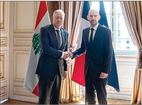
لقاء رجي وبارو

قدراته، بوصفه ركيزة أساسية التي ستعقب انتهاء مهمة قوات لمتنتم الموقف اللبناني على اليونيفيل، والعلاقات اللبنانية السورية». إذ أكد الجانب الفرنسي «أهمية المضي قُدماً وأعلن بارو «استعداد بلاده لتنظيم مؤتمر دولي لدعم المؤسسة العسكرية، نظرا للثقل الاستراتيجي لهذا الملف». والأمن وضبط الحدود والحد من ظاهرة التهريب».