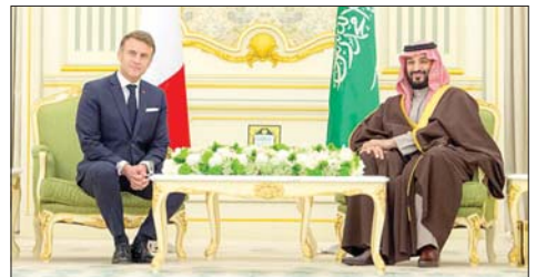
بن سلمان وماكرون

بعث ولي العهد السعودي محمد بن سلمان بن عبدالعزيز آل سعود برسالة شكر إلى الرئيس الفرنسي إيمانويل ماكرون، على الدعوة التي تلقاها للمشاركة في اجتماع وغداً عمل لقمة مجموعة السبع (G7)، الذي سيقام في مدينة إيفيان يوم ١٦ حزيران ٢٠٢٦. وذكرت "وكالة الأنباء السعودية-واس"، أن "الرسالة تضمنت اعتذار بن سلمان عن عدم تمكنه من المشاركة، لوجود ارتباطات مسبقة تحول دون ذلك".