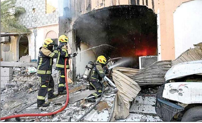
عمال اطفااء يعملون على اخماد حريق في موقع استهدف في إيران

إن "الجيش الأمريكي شن فجر الخميس، هجمات صاروخية استهدفت موقعا ترفيهيا ومجمعا إنتاجيا ومحيط ثكنة عسكرية في مناطق قرب كرج ونظر آباد (شمال غرب إيران)، إضافة إلى قاعدة محلية للحرس الثوري في قضاء بيشوا (شمال)". من جانبه، أكد الجيش الأردني في بيان إسقاط ٢٠ صاروخا أطلقت من إيران، بعد ساعات على إعلان الحرس الثوري الإيراني إطلاق صواريخ بالستية على مركز قيادة