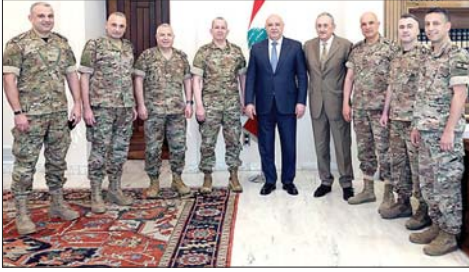
عون والوفد المفوض

بين الهجمات الأميركية الليلية على إيران وتداعياتها المحتملة تصعباً ام اتفاقاً، مستتبعاً بتهديد الرئيس دونالد ترامب بضررها بقوة قوية جداً هذه الليلة، وبين التصعيد الميداني جنوباً من طرفي الصراع، إسرائيل وحزب الله، توزع الاهتمام على الساحة اللبنانية التي تلقت من بين ظلام أوضاعها بصيص نور صدره المملكة العربية السعودية التي قررت بعد طول انتظار إعادة فتح أسواقها أمام الصادرات اللبنانية في مؤشر إلى استعادة جزء من ثقة مفقودة يؤمل ان تكتمل ببقية اجزائها. قرار تزامن مع عودة المبعوث السعودي الأمير يزيد بن فرحان إلى بيروت صباحاً في زيارة تهدف وفق المعلومات إلى تقديم الدعم للمؤسسات الشرعية اللبنانية وسيادة لبنان ووحدة أراضيه ورفاهية شعبه ومسار الإصلاح.