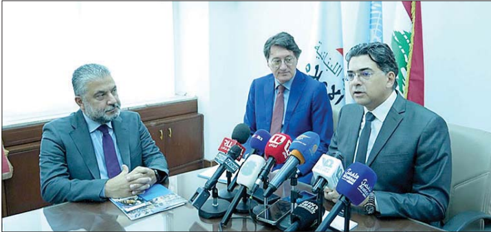
مرقص في مؤتمره الصحفي

المبادرة تشكل ثمرة أشهر طويلة من التعاون والتنسيق مع وزير الإعلام وفريقه، معرباً عن سعادته بـ"إطلاق 10 فيديوهات جديدة تهدف إلى تعزيز الوعي بأهمية التحقق من المعلومات قبل تداولها (...)" وفي ما يتعلق بتوقيف الصحفيين، أوضح مرقص رداً على سؤال أن مشروع قانون الإعلام الجديد بلغ مراحله النهائية، مؤكداً أن "الوزارة تعمل مع وزارة العدل على اعتماد آليات تحد من توقيف الصحفيين (...)".