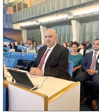
لحدود متحدثاً في الدورة