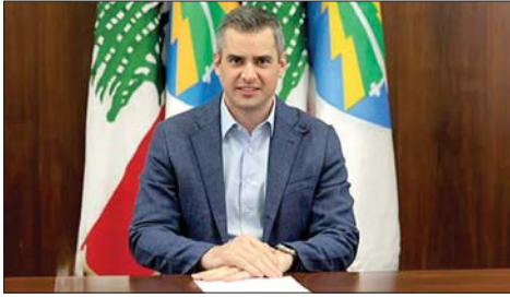
النائب طوني فرنجية

”مطلب محق، ومطلوب الا يفضل على مفاصل افراد وجماعات حتى يتم اقراره“، معتبراً أن ”المزايدات والمناكفات ومعها المزايدون والمناكفون هم من أبطلوا إقرار القانون“. وختم مستذكراً شهداء إهدن: ”أرادوا اغتيال وحدة لبنان فافتالوا رمزاً من رموز الوحدة الوطنية... طوني فرنجية على نهجه مستمرين وفي هذا الظرف بالتحديد نتمسك بوحدة لبنان من جنوبه إلى شماله ولا أحد يمكنه أن يلغي الآخر في لبنان، فكيف إذا كان هذا الآخر مكوناً بأكمله“.