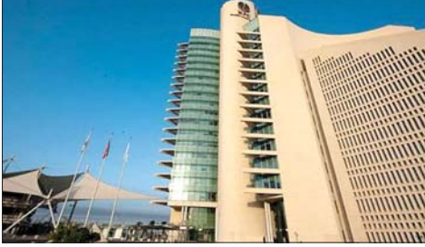
مؤسسة البترول الكويتية

عرضت مؤسسة البترول الكويتية منتجات ووقود جاهزة للشحن الفوري، لأول مرة منذ بدء حرب إيران، وفق ما نقلت «رويترز» عن أربعة مصادر مطلعة.