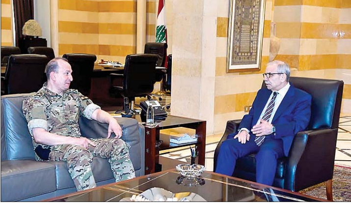
لقاء سلام وهيكل

حضور وزراء الصناعة جو عيسى الخوري، الاقتصاد والتجارة عامر البساط، والزراعة نزار هاني، مع ممثلين عن القطاعين الصناعي والزراعي، خصص لمواكبة استئناف الصادرات إلى المملكة العربية السعودية، حيث أطلعهم على التدابير الوقائية التي ستتخذ في هذا المجال.