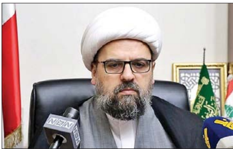
الشيخ احمد قبلان

من طهران بدا واضحاً أن السلطة اللبنانية ليست جزءاً من الأحداث ولا يمكنها التأثير بها، وهذا خطأ وطني فادح (...).“