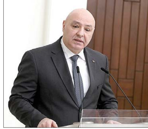
الرئيس جوزيف عون

إلى الوحدة الوطنية اليوم ليست شعاراً يُرفع في المناسبات، بل هي ضرورة وجودية تُبنى بالمصارحة، وتُعزز بالعدالة، وتتجذر بالإنصاف لكل مكونات هذا الشعب دون استثناء. أجدد اليوم، أمام أرواح ضحايا إهدن وأمام كل شهداء الحرب الأهلية من كل الطوائف