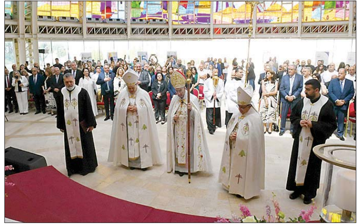
الراعي مترئساً القديس

هو مؤلم أن تموت النفوس البشرية بهذه السهولة، وأن يصبح الدم البشري مادة في نشرات الأخبار. من أجل من كل هذا؟ ولمن؟ وأي مكسب يمكن أن يبرر خسارة إنسان واحد؟“.