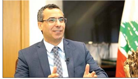
هاني خلال إلقاء كلمته

نظمت وزارة الزراعة، بالتعاون مع المجلس الوطني للبحوث العلمية، لقاءً وطنياً برعاية وحضور وزير الزراعة الدكتور نزار هاني، خصّص لعرض نتائج تقييم الأضرار والخسائر في القطاع الزراعي الناتجة من الحرب الأخيرة، ومناقشة آليات الاستجابة الطارئة ودعم المزارعين المتضررين، وذلك في مقر المجلس