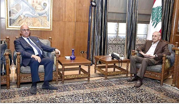
بري مستقبلاً نجم

تلقى الرئيس بري برقية تهنئة من الرئيس المصري عبدالفتاح السيسي جاء فيها: يسعدني أن أبعث إليكم بخالص التهاني وأطيب الأمنيات بمناسبة بدء العام الهجري الجديد. وأضاف: في ذكرى الهجرة النبوية الشريفة التي نهتدي بتعاليمها النبيلة، ندعو الله عز وجل أن يجعله عام خير ورخاء وأن يحمل الأمن والسلام لشعوب الأمة الإسلامية كافة، متمنياً للشعب اللبناني النابض من التقدم والازدهار.