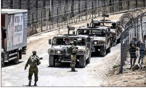
قوات اسرائيلية خلال دخولها الجنوب أثناء الحرب

النازحين العائدين الى قراهم في جنوب لبنان». وأعلنت وزارة الصحة اللبنانية ارتفاع حصيلة العدوان الإسرائيلي على لبنان منذ ٢ آذار الماضي إلى ٣٧٩٨ قتيلًا و١١ ألفًا و٧٨١ جريحًا.