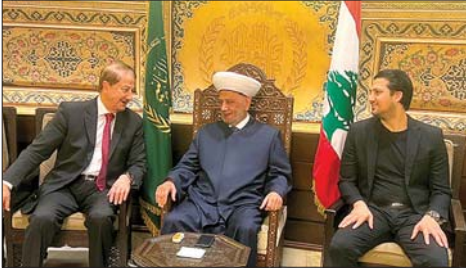
دريان مستقبلاً المرعبي

رأى مفتي الجمهورية اللبنانية الشيخ عبد اللطيف دريان أن "السلطات اختارت التفاوض للخروج من المأزق، إذ لا سبيل غيره لوقف القتل والتخريب والتدمير والتهاجر". وقال دريان في رسالة بمناسبة السنة الهجرية الجديدة: "إنها اللبنانيون: إن الدولة التي تحايل السلطات اللبنانية اليوم استعادة أركانها، وتطبيق دستورها