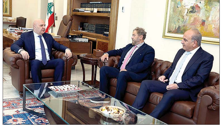
عون مستقبلاً افرام