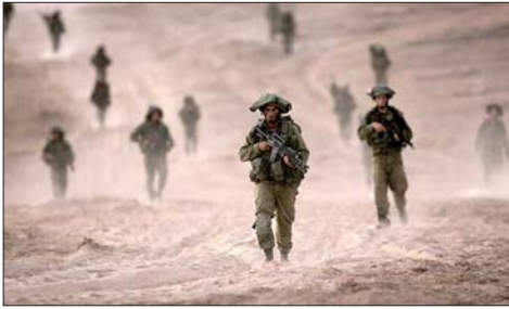
جنود الاحتلال في جنوب لبنان

الأصفر؟» في هذه الحالة، هل سيُسمح لسكان جنوب لبنان بالعودة إلى القرى التي تم إخلاؤها خلال القتال؟ وهل سيحصل هؤلاء السكان على تصريح لإحضار معدات ثقيلة معهم من أجل إعادة بناء البنى التحتية التي دُمرت؟. وأوضح أن «من وجهة نظر الجيش الإسرائيلي، من المهم فهم ما إذا كان الجيش سيتمكن من مهاجمة أي شخص مسلح يتم رصده في القرية؟ وبالمثل، يطرح السؤال حول ما إذا كان الجيش سيقيم مواقع ثابتة في المنطقة التي سيمسك بها (بالإضافة إلى النقاط