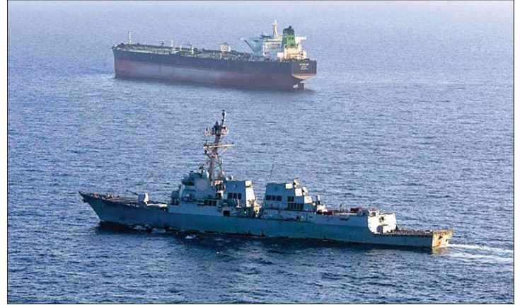
سفينة صربية أميركية ترافق حركة العبور في مضيق هرمز

المقيدة وتعويز الأضرار الناجمة عن الحرب يمثلان عنصرين أساسيين في التفاهم. وأضاف أن الإدارة الأميركية تعهدت باتخاذ الخطوات اللازمة في هذين الملفين.