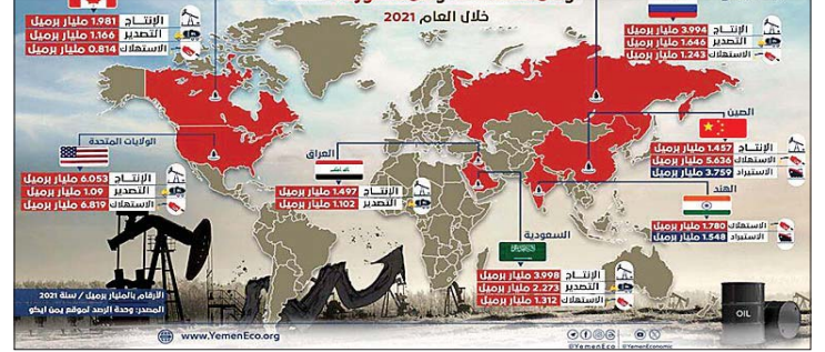
أخبار الدول المنتجة للنفط

رغم تراجع أسعار النفط والغاز، فإنه لن تنتهي مشكلة الأسعار المرتفعة للبنزين في ليلة وضحاها حتى بعد إعلان الولايات المتحدة وإيران مساء الأحد التوصل إلى اتفاق أولي ينهي الحرب بينهما، ويعد فتح مضيق هرمز في الخليج. ويتوقع خبراء الطاقة مرور عدة أشهر قبل أن تتمكن شركات الطاقة من العودة إلى العمل بالطاقة اللازمة لتلبية الطلب العالمي. وقالوا إن بقاء عمليات شحن وتكرير النفط العام، والشكوك حول أمن المرور عبر المضيق يعني أن التأثير الإيجابي للاتفاق لن يظهر على الفور. وفق تقرير وكالة «أسوشيتد برس» الأمريكية. يذكر أن الناقلات المحملة بالنفط الخام عالق في الخليج منذ أكثر من