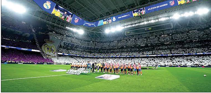
من ملاعب كأس العالم

يُنتظر أن تستفيد سلاسل الفنادق مثل «ماريوت» الأمريكية ومنصة «إير بي إن بي» الأمريكية من تدفق ملايين الزوار إلى المدن المضيفة، مع توقعات بوصول نسب إشغال الفنادق إلى ما بين ٩٥ و٩٠ في المائة وارتفاع أسعار الغرف بنحو ١٥ إلى ٢٠ في المائة. كما يُرجح أن تشهد شركات الدفع الإلكتروني مثل «فيزا» و«ماستركارد» الأمريكية زيادة في المعاملات العابرة للحدود مع تنقل المشجعين بين الدول الثلاث، أما قطاع المراهات الرياضية، فقد يحقق مكاسب كبيرة عبر شركات مثل «درافت كينغز» الأمريكية، في حين يُتوقع أن تستفيد شبكات البث التلفزيوني، ومنها «فوكس» و«تيليموندو» و«إم ٦» الفرنسية، من زيادة عدد المباريات وارتفاع نسب المشاهدة والإيرادات الإعلانية خلال البطولة.