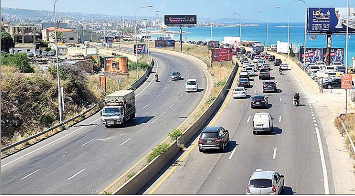
عائدون الى الجنوب

صدق الرئيس الأميركي دونالد ترامب في اعلانه قرب التوصل الى اتفاق مع إيران الاسبوع الماضي. مذكرة تفاهم أعلن عنها رئيس الوزراء الباكستاني شهباز شريف والرئيس الأميركي والجمهورية الإسلامية فوجرا امس ، تهدف إلى إنهاء الحرب الأميركية - الإيرانية ووقف العمليات العسكرية على عدة جبهات، بينها لبنان، بحسب الرواية الباكستانية. بيد ان لبنان الذي يتلقى الصفحات عن إيران لم يتبلغ حتى الساعة تفاصيل الاتفاق ومندرجاته، الا ان قاده سارعوا إلى الترحيب مع أن إسرائيل غير ملتزمة بالاتفاق حتى الساعة، كما يقول كبار المسؤولين فيها، ولن تنسحب من الجنوب الذي تتجه إليه الانظار. وقد بدأت قوافل النازحين بالعودة قافزة فوق الصناعات التي أسداها الجيش والثنائي الشعبي بوجوب التروي الى حين صدور بيان رسمي. وعلى وقع بيانات الترحيب الرئاسي لقاء قطري- سعودي يؤكد دعم لبنانية، بارك حزب الله في بيان "للجمهورية الإسلامية الإيرانية، قيادة وشعباً، الإنجاز الكبير بالتوصل إلى مذكرة التفاهم، مؤكدا ان لا عودة الى ما قبل 2 آذار.