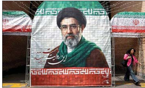
جدارية لخامنئي عند مدخل المؤسسات الحكومية في طهران

سيعاد فتحه في أعقاب توقيع الاتفاق الإيراني. ويعد المجلس الأعلى للأمن القومي أعلى هيئة لصنع القرار في إيران، ويعمل تحت إشراف المرشد الأعلى مجتبي خامنئي وقيادة الرئيس مسعود بزشكيان. من جهته، قال الرئيس الإيراني مسعود بزشكيان إنه لولا دعم المرشد الأعلى لما كان بإمكاننا الوصول إلى الإنجاز المتمثل