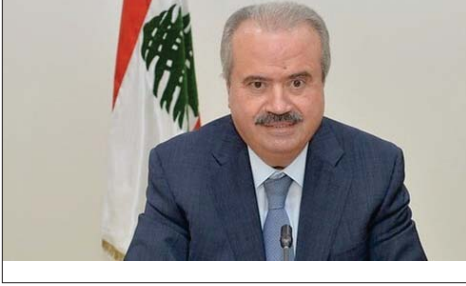
الوزير ياسين جابر