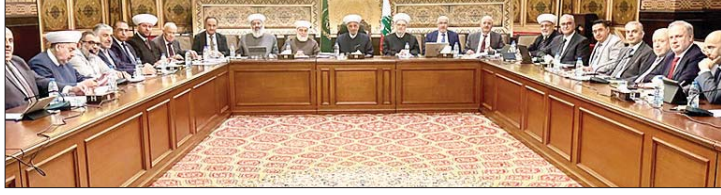
اجتماع المجلس الشرعي