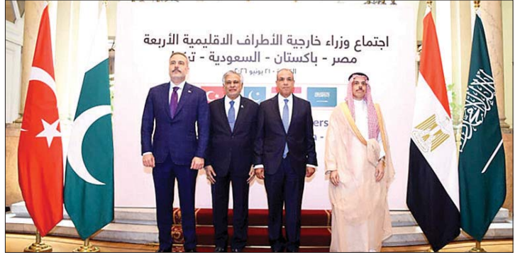
وزراء خارجية مصر وتركيا وباكستان والسعودية

شدد الوزراء على أنها "تظل في صميم الجهود الرامية إلى تحقيق سلام عادل وشامل ودائم في المنطقة"، مؤكداً أنها تشكل ركناً أساسياً لأي نظام إقليمي مستقر وآمن.