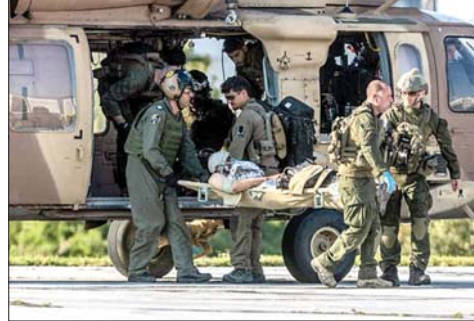
نقل جنود الاحتلال جرحاهم من لبنان

نقلت صحيفة «يسرائيل هيوم» الإسرائيلية، الأحد، عن مصدر مُقرب من الإدارة الأميركية أن واشنطن ستطلب من إسرائيل سحب قواتها من جنوب لبنان مسألة وقت لا أكثر، مشيرة إلى أن ذلك سيضع إسرائيل وتنتباهو في مأزق بالغ الصعوبة، في حين كشفت «القناة ١٢» الإسرائيلية عن اتصالات أميركية مع المعارضة الإسرائيلية، وسط أزمة ثقة بين البيت الأبيض وحكومة بنيامين نتنياهو.