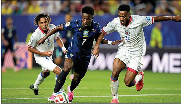
من مباراة البرازيل وهابيتي