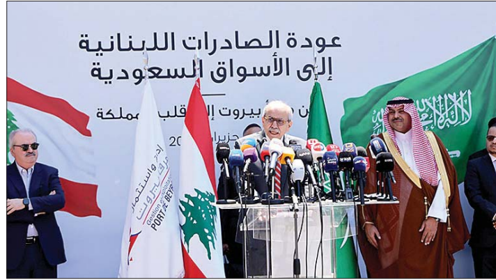
سلام يتحدث في احتفال المرفأ

من هنا، من هذا الرصيف، تنطلق أول شحنة من لبنان إلى قلب المملكة، بعد قرار رفع الحظر، حاملة معها إرادة اللبنانيين وآمالهم وثقتهم بالمستقبل. شكرًا لقيادة المملكة العربية السعودية وأهلًا بعودة مرفأ بيروت إلى قلب المملكة". وفي ختام الاحتفال، أطلقت الباهرة المتجهة إلى السعودية صافراتها في مشهد رمزي إيداناً بانطلاق أول شحنة من الصادرات اللبنانية من مرفأ بيروت إلى ميناء جدة الإسلامي.