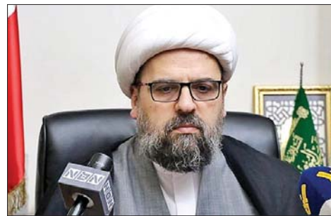
الشيخ احمد قبلان

رأى المفتي الجعفري الممتاز الشيخ أحمد قبلان، في بيان “أن لا شيء أخطر على لبنان من ضرب تراث الدولة اللبنانية وعقيدها وطابعها التكويني وسط لعبة أميركية صهيونية تريد ابتلاع البلد كهيكل ووظيفة ومصالح سياسية وأمنية (...)“، ولفت الى أن “خطورة القضية، تتعلق بتجريد لبنان من هويته الكيانية وقدراته الأمنية وما يلزم من شروط بقائه واستقلاله“، وقال: “والعدو الصهيوني يريد أن