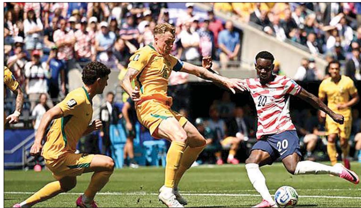
من مباراة الولايات المتحدة واستراليا

ضمنت الولايات المتحدة تأهلها إلى دور الـ٢٢ من نهائيات كأس العالم ٢٠٢٦ التي تستضيفها بالشراكة مع المكسيك وكندا، بعد فوزها على أستراليا ٠-٢ مساء الجمعة في المرحلة الثانية من المجموعة الرابعة.