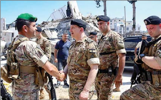
من جولة القائد

نرحب بأي جهد من أي جهة أتى للضغط على إسرائيل لوقف حربها العدوانية على لبنان».