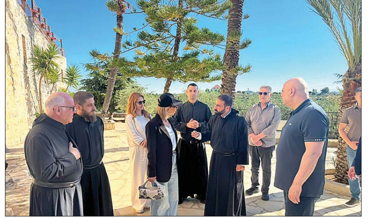
من جولة عون وعقيلته

زار رئيس الجمهورية العماد جوزيف عون والسيدة الأولى نعمت عون صباح امس دير كفيان للصلاة أمام القديس نعمة الله الحرديني القديسة رفا. والطوباوي الأخ إسطفان نعمه. ثم توجهوا إلى دير مار يوسف- جربتا حيث ضريح