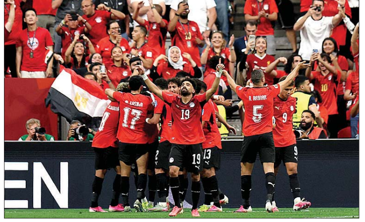
فرحة المصريين بالفوز التاريخي

كما أصبح أكبر لاعب مصري يسجل في المونديال، متفوقاً على أرقام سابقة، ورفع رصيده إلى 3 أهداف في تاريخ البطولة. وساهم صلاح به أهداف في تاريخ مشاركاته، ليصبح الأكثر تأثيراً تهديفياً في تاريخ مصر بالمونديال، كما رفع رصيده الدولي إلى 66 هدفاً. أرقام فريدة لافتة في ليلة تاريخية مصطفى زيكو أصبح أول لاعب مصري يسجل ويصنع في مباراة واحدة بكأس العالم. تميزه كره الانجاز بصناعة وتأثير مباشر بعد دخوله كبديل.