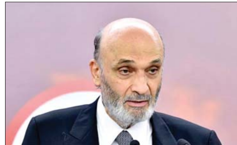
الدكتور سمير جعجع

وجه رئيس حزب "القوات اللبنانية" سمير جعجع رسالة إلى نائب رئيس الولايات المتحدة الأميركية جاي دي فانس، أعرب فيها عن "تقديره للتصريحات التي عبّر فيها عن اهتمامه بمسيحيي لبنان". وأكد بصفته رئيساً لحزب "القوات اللبنانية"، تقديره "للصداقة الصادقة والاهتمام العميق بمسيحيي لبنان، واسترداداً بجميع اللبنانيين". وأشار إلى أن "هذه المواقف تعكس اهتماماً بلبنان وبأوضاعه"، مؤكداً "أهمية العلاقات مع الجهات التي تدعم استقرار البلاد والحفاظ على سيادتها". وقال: "لقد شكّل المسيحيون اللبنانيون، عبر تاريخ لبنان الحديث، ويسيستمرون في تشكيل عنصر استقرار وافتتاح واعتدال وازدهار ثقافي وحضاري في هذا الشرق. وقد تميّز لبنان، بفضل تعدديته، وحرية العامة، ونظامه المنفتح، ودوره الثقافي والاقتصادي،