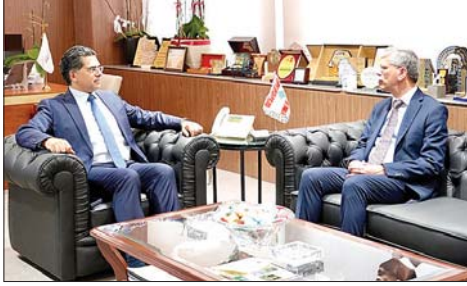
مرقص مستقبلاً سفير باكستان

زار السفير الباكستاني سلمان أطر، أمس كلا من وزير الإعلام المحامي د. بول مرقص ووزير الداخلية والبلديات أحمد الحجار، وعرض معهم للعلاقات الثنائية بين البلدين. كما تناول البحث الدور الذي تضطلع به باكستان في إطار المفاوضات الإيرانية - الأميركية، والتطورات الإقليمية الراهنة وانعكاساتها على لبنان والمنطقة. ولفت الوزير مرقص في تصريحه الى ان الزيارة "تأتي كعادتها في إطار الصداقة التي تربط البلدين، وقد جرى البحث في التطورات العامة لا سيما جهود بلاده لتأمين الإستقرار في المنطقة، وانعكاس ذلك على لبنان في ضوء تصريح رئيس الجمهورية العماد جوزاف عون اليوم، والترحيب بأي مساعدة من شأنها أن تنهي الحرب، بما في ذلك تحقيق وقف إطلاق النار على نحو مستدام، مع الحفاظ على الجهود التي تقوم بها الدولة اللبنانية من خلال المسار التفاوضي الذي يقوده الرئيس عون". وأوضح مرقص ان البحث تطرق الى إمكان التعاون الإعلامي مع باكستان، وستكون لنا إضافة في القادم من الأيام". بدوره، السفير الباكستاني، قال: "بحثنا في العلاقات المشتركة بين بلدنا وسبل تطويرها في مجال الإعلام، مضيفاً: "باكستان التي تؤمن بالسلام، ستكمل مساعيها لتحقيق السلام والاستقرار في المنطقة"، وقال: "طالما دعمت باكستان استقلال وسيادة لبنان على أراضيه، ونحن نقف الى جانب الشعب اللبناني وحكومته وسنبقى نقدم له الدعم بكل الوسائل المتاحة".