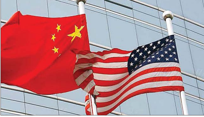
الصين تفرض عقوبات على شركات أميركية

أعلنت الصين، أمس الاثنين، فرض عقوبات على ١٠ شركات دفاع أميركية، في خطوة رديّة على تحرك أميركي حديث يمنع بعض شركات التكنولوجيا الصينية الكبرى من المشاركة في عقود وزارة الدفاع الأميركية.