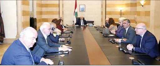
سلام مترأساً الاجتماع

والإعمار، حيث استعرض دولة الرئيس الحشد الدولي من أجل تحقيق هذه الغاية. كما استعرض المجتمعون آلية تثبيت وقف إطلاق النار، ومن جهة أخرى، عرضت الموضوعات المتعلقة باحتياجات العودة، ولا سيما لجهة تأمين الاتصالات إلى عدد من المناطق الجنوبية. كما واطمأن دولة الرئيس من الوزراء المعنيين على وصول الصادرات اللبنانية إلى وجهتها في المملكة العربية السعودية الشقيقة، ومرورها إلى دول خليجية شقيقة أخرى أيضاً. وأيضاً تباحث المجتمعون في التطورات العامة.