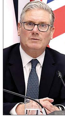
ستارمر يعلن استقالته

يتحرك المرشح لرئاسة الحكومة البريطانية، أندري بيرنهام، نحو «اوينغ ستريت» وسط حقل ألغام اقتصادي لا يحتمل الخطأ. ورغم الاستقرار النسبي الذي شهدته أسواق السندات البريطانية مؤخراً، فإن هذا الهدوء لا يعكس ثقة مطلقة بقدر ما هو استجابة إيجابية من الأسواق له «وثيقة التأمين» التي قدمها الزعيم المقبل؛ حيث يبادر بقطع وعود علنية بالالتزام بالقواعد المالية الصارمة التي أرسها وزيره الخزانة السابقة راشيل ريفز. هذا الالتزام الاستباقي، بالتوازي مع أرقام تضخم مواتية قللت من مخاوف المستثمرين بشأن تداعيات الحرب في إيران على تكاليف المعيشة، هو ما منح الأسواق جرعة مؤقتة من الطمأنينة.