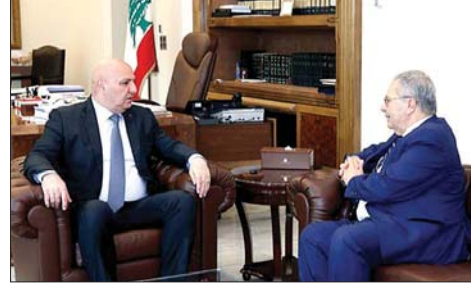
لقاء عون ومنزى

زار السفير الباكستاني سلمان أطر، أمس كلا من وزير الإعلام المحامي د. بول مرقص ووزير الداخلية والبلديات أحمد الحجار، وعرض معهم للعلاقات الثنائية بين البلدين. كما تناول البحث الدور الذي تضطلع به باكستان في إطار المفاوضات الإيرانية - الأميركية، والتطورات الإقليمية الراهنة وانعكاساتها على لبنان والمنطقة. ولفت الوزير مرقص في تصريحه الى ان الزيارة "تأتي كعادتها في إطار الصداقة التي تربط البلدين، وقد جرى البحث في التطورات العامة لا سيما جهود بلاده لتأمين الإستقرار في المنطقة، وانعكاس ذلك على لبنان في ضوء تصريح رئيس الجمهورية العماد جوزاف عون اليوم، والترحيب بأي مساعدة من شأنها أن تنهي الحرب، بما في ذلك تحقيق وقف إطلاق النار على نحو مستدام، مع الحفاظ على الجهود التي تقوم بها الدولة اللبنانية من خلال المسار التفاوضي الذي يقوده الرئيس عون". وأوضح مرقص ان البحث تطرق الى إمكان التعاون الإعلامي مع باكستان، وستكون لنا إضافة في القادم من الأيام". بدوره، السفير الباكستاني، قال: "بحثنا في العلاقات المشتركة بين بلدنا وسبل تطويرها في مجال الإعلام، مضيفاً: "باكستان التي تؤمن بالسلام، ستكمل مساعيها لتحقيق السلام والاستقرار في المنطقة"، وقال: "طالما دعمت باكستان استقلال وسيادة لبنان على أراضيه، ونحن نقف الى جانب الشعب اللبناني وحكومته وسنبقى نقدم له الدعم بكل الوسائل المتاحة".