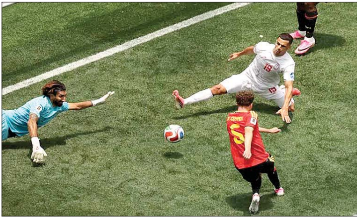
من مباراة بلجيكا وإيران

محمد صلاح يواصل تحطيم الأرقام واصل محمد صلاح كتابة التاريخ، ليصبح أكبر لاعب إفريقي يسجل ويصنع في مباراة واحدة بكأس العالم بعمر 34 عاماً.