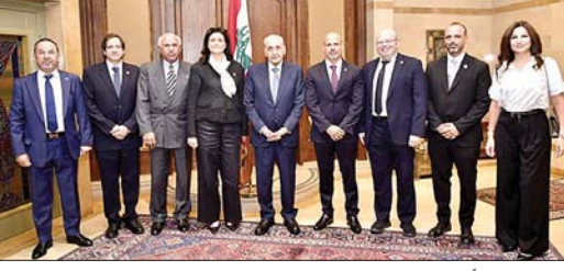
بري مستقبلاً وفد المقاصد

الذي قال بعد اللقاء: "تبعاً لزيارتنا لدولة الرئيس اليوم للاطمئنان على الأجواء العامة في البلد والمنطقة، ودائماً اللقاء مع دولة الرئيس غني واهتماماته أساسية وكبيرة على المستوى الوطني وعلى مستوى كل المنطقة".