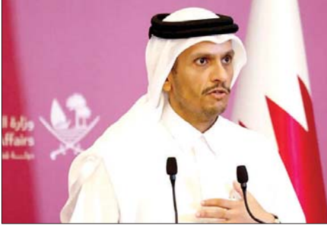
رئيس مجلس الوزراء القطري محمد بن عبد الرحمن آل ثاني

إلى جانب آلية لتجنب أي تصعيد في المنطقة ومعالجة أي حدث قبل وقوعه.