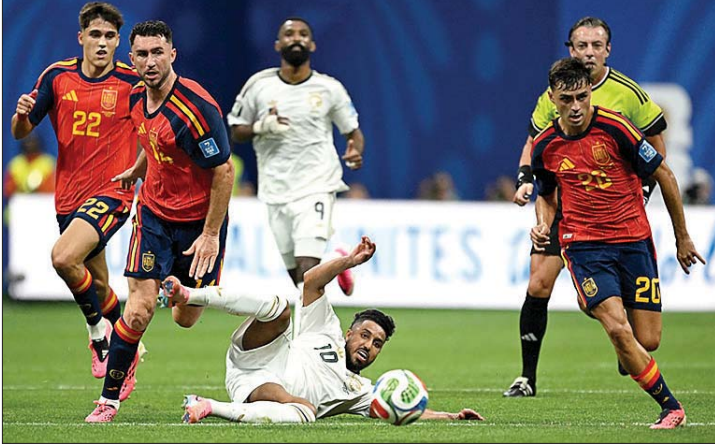
من مباراة إسبانيا والسعودية