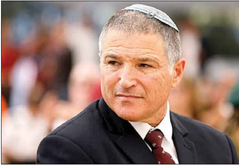
رئيس الشاباك دافيد زيني

وأضاف: "يرغب المواطنون في أن يروا تقدماً في النمو والاقتصادي، وتكاليف المعيشة، والخدمات العامة، والإسكان، وفرص للجيل القادم. لا يجب أن يحول التغيير السياسي الانتباه عن مسؤولية تحسين حياة الأفراد". وفي وقت سابق، أعلن رئيس الوزراء البريطاني كير ستارمر استقالته بعد أقل من عامين في منصبه، في ولاية اتسمت بانتكاسات سياسية وبشعبية متدنية جدا. وظهر ستارمر متأثراً حد البكاء وهو يتلو بيان استقالته أمام مقر رئاسة الوزراء في داوينغ ستريت، وقال إن "كل قرار اتخذته كان هدفاً وضعه البلد الذي أحبه أولاً. ولهذا السبب سأستقيل من قيادة حزب العمال". وأضاف أن عملية اختيار زعيم جديد لحزب العمال ستنتقل في تموز، وأنه سيبقى رئيساً للوزراء إلى أن يتم اختيار خلفه، على أن يتولى الأخير منصبه في أيلول.