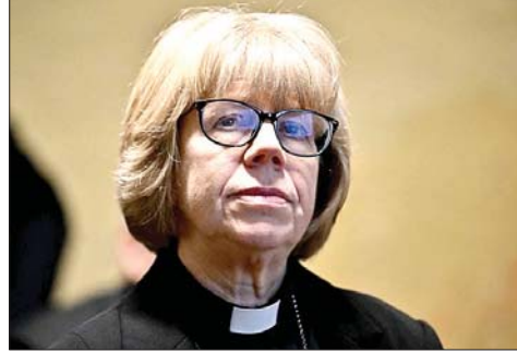
رئيسة الكنيسة الأنغليكانية ديم سارة

تعهدت رئيسة الكنيسة الأنغليكانية ديم سارة مولاي بمساعدة الفلسطينيين على تحقيق "الحرية التي يستحقونها". جاء هذا في خطبة دينية ألقها في الضفة الغربية، حيث تقوم برحلة حج إلى هناك.