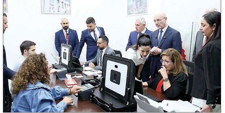
الحجار في السفارة اللبنانية في الكويت