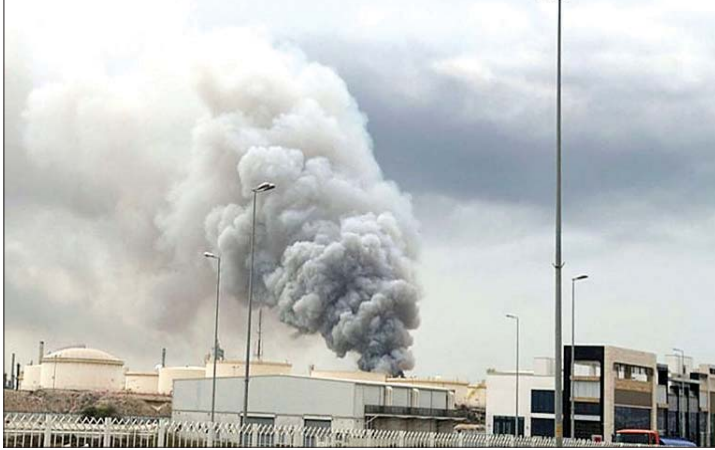
قصف اميركي على ايران

قال الرئيس الأمريكي دونالد ترامب، فجر الأحد، إن طائرات أميركية قصفت مواقع إيرانية لتخزين الصواريخ والطائرات المسيّرة، إضافة إلى محطات رادار ساحلية، مؤكداً أن الضربات جاءت رداً على ما وصفه بانتهاك طهران مجدداً لاتفاق وقف إطلاق النار. وأضاف ترامب، في منشور على منصفته تروث سوشال، أن الولايات المتحدة قد تصل إلى نقطة "لن تكون قادرة فيها على التصرف بعقلانية"، على حد تعبيره، مشيراً إلى أن واشنطن قد تُجرّب حينها على "إكمال المهمة عسكرياً". وتابع قائلاً إن من المرجح للغاية أن الإيرانيين "لن يتعلموا أبداً"، محذراً من أنه إذا اضطرت الولايات المتحدة إلى استكمال العملية العسكرية، "فلن يكون لجمهورية إيران الإسلامية وجود بعد ذلك"، بحسب ما ورد في منشوره. وجدد الرئيس الأمريكي -في وقت لاحق- تأكيداً أن الجمهورية الإسلامية الإيرانية "لن تمتلك أبداً سلاحاً نووياً". من جهتها، أدانت الخارجية الإيرانية الغارات الجوية