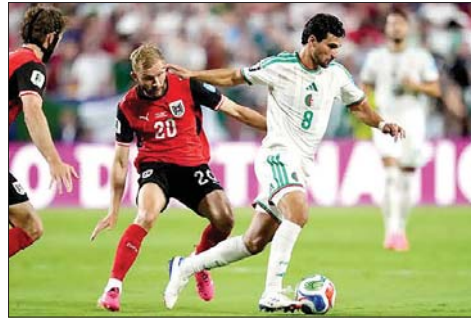
من مباراة الجزائر والنمسا

انتزع المنتخب السويسري صدارة المجموعة الثانية في كأس العالم 2026 بعد أن أسقط البلد المضيف كندا 1-2 في ختام دور المجموعات الأربعاء، لكن ذلك لم يكن يمنع الكنديين من التأهل عن المركز الثاني.