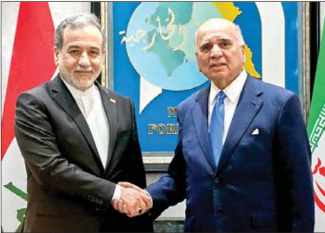
وزير الخارجية العراقي وايران

وصل وزير الخارجية الإيراني عباس عراقجي، صباح الأحد، إلى العاصمة العراقية بغداد في زيارة رسمية على رأس وفد دبلوماسي، وذلك في ظل توترات أمنية متصاعدة تشهدها المنطقة. وفي مؤتمر صحفي مشترك مع نظيره العراقي فؤاد حسين، أعرب عراقجي عن تقديره لمواقف بغداد في إدانة الاعتداء على بلاده، مؤكداً إصرار طهران على مواصلة التعاون الإستراتيجي مع الحكومة العراقية في المجالات الاقتصادية والأمنية. وشدد وزير الخارجية الإيراني على ضرورة ألا تخرج مذكرة التفاهم عن مسارها، مؤكداً أن "أول بند فيها هو وقف الحرب في كافة الجبهات، بما فيها لبنان"، ومطالباً بانسحاب القوات الإسرائيلية من الأراضي التي تحتلها في لبنان معتبراً أنها مسؤولية الحكومة الأمريكية. وأضاف أن مضيق هرمز تحت إدارة إيران وبعد إزالة العوائق ستعود الأمور لسابق عهدها، مشيراً إلى أنه لا مسؤولية لأي جهة في عمل المضيق وأي شيء غير ذلك يخالف مذكرة التفاهم مع واشنطن. من جهته، أكد وزير الخارجية