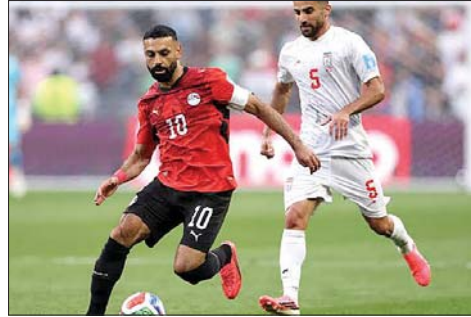
من مباراة مصر وإيران