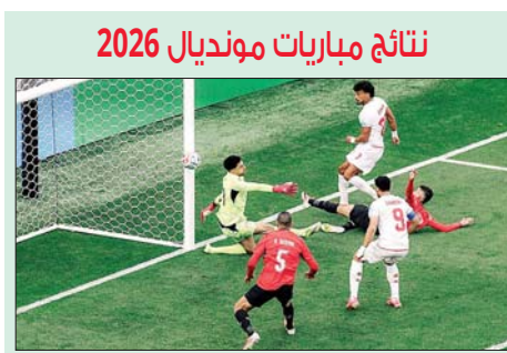
من مباراة مصر وإيران

اسبانيا - الأوروغواي: 1 - صفر السعودية - الرأس الأخضر: صفر - صفر بليجكا - نيوزيلندا: 0 - 1 انكلترا - بنما: 2 - صفر كرواتيا - غانا: 2 - 1 كولومبيا - البرتغال: صفر - صفر الكونغو الديمقراطيّة - أوزبكستان: 3 - 1 الارجنتين - الأردن: 3 - 1 الجزائر - النمسا: 3 - 3