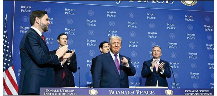
إعلان ترامب عن مجلس السلام

نشرت صحيفة "الغارديان" تقريراً أعده كيت براون وأرام روستون، قال فيه إن مجلس سلام غزة الذي يرأسه دونالد ترامب يخطط لمنح نفسه صفة قانونية وحصانة واسعة، حسبما تظهر وثائق. وموجب مسودة قرار حصلت عليها صحيفة "الغارديان"، فإن مجلس السلام الذي أعلن عنه ترامب بداية العام الحالي لإدارة غزة، يخطط لمنح نفسه حصانة قانونية واسعة النطاق، كما تسمح مسودة القرار للهيئة بالحصول على ممتلكات عامة في غزة "مجاناً". ويمنح القرار، المكون من أربع صفحات والمصنف بكونه "حساساً ولكن ليس سريراً"، حماية واسعة النطاق لجميع أعضاء هيئة السلام وجهازها الإداري ومكتب الممثل السامي، فضلاً عن التكنولوجيا الفلسطينية والقوات الدولية لتحقيق الاستقرار والمتعاقدين غير المقيمين الذين سيتم التعاقد معهم للعمل في غزة. وبحسب القرار، فإن الإجراءات القانونية التي ستمنح الجميع الحصانة تقدم بأنها تشمل "أي توقيف أو احتجاز أو إجراءات قانونية في المحاكم أو غيرها من الجهات في غزة". لكن من غير الواضح ما إذا كانت الوثيقة تسعى إلى إعفاء هيئة السلام والجهات التابعة لها من الملاحقة القضائية في المحاكم الدولية، بالإضافة إلى الدعاوى المحتملة في غزة. وتنص مسودة القرار الصادرة في حزيران ٢٠٢٦، على أن رئيس هيئة السلام، دونالد ترامب، سيكون له الحق في التنازل عن الحصانة القانونية لأي شخص، شريطة الحصول على موافقة أغلبية أعضاء هيئة السلام. ورغم تعهد الدول بتقديم مليارات الدولارات، فإن معظمها لم يحول