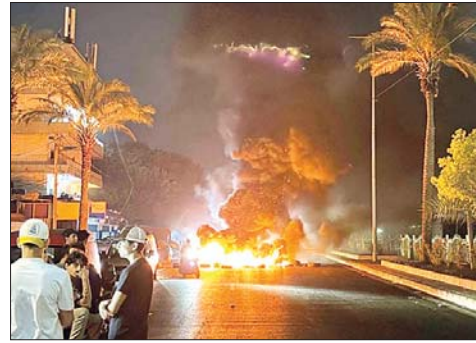
من القصف الايراني

أعلن الحرس الثوري الإيراني الأحد، عن شن ضربات استهدفت الكويت والبحرين رداً على هجمات أميركية طالت الأراضي الإيرانية، محذراً من أن أي عدوان أميركي جديد سيُقابل بـ"رد ساقط". وأفاد الحرس الثوري في بيان أنه استهدف "مخاني مواقع وبنى تحتية مهمة للجيش الأمريكي في قاعدة علي السالم بالكويت والأمسطل البحري الخامس في ميناء سلمان بالبحرين، وتم تدميره".