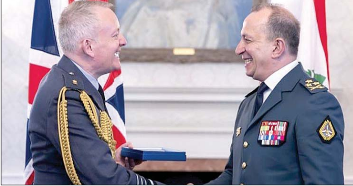
هيكل ونظيره البريطاني

زار قائد الجيش العماد رودولف هيكل بريطانيا، تلبية لدعوة رسمية من نظيره البريطاني رئيس أركان الدفاع Air Chief Marshal Sir Rich Knighton. في هذا الإطار، التقى العماد هيكل نظيره البريطاني، وتم البحث في سبل دعم الجيش وتعزيز التعاون بين الجانبين. وأعرب عن شكره لنظيره البريطاني على وقوفه إلى جانب المؤسسة العسكرية، واثمناً لدعم بريطانيا المستمر للجيش. كما التقى مستشار الأمن القومي Jonathan Powell، وعضو مجلس اللوردات - وزير الدولة لشؤون الدفاع Lord Vernon Coaker، وعضو مجلس النواب - نائب وزير الخارجية لشؤون الشرق الأوسط وشمال أفريقيا Hamish Falconer. خلال هذه اللقاءات، جرى عرض التحديات التي يواجهها الجيش في سياق مهام حفظ الأمن والاستقرار وحماية الحدود، إلى جانب مناقشة كيفية الوصول إلى وقف مستدام لإطلاق النار. في لبنان. كذلك زار العماد هيكل كلية ساندهيرست الملكية العسكرية، حيث التقى قائدها Maj Gen Nick Cowley، وجال في أقسامها، وأطلع على العملية التدريبية فيها. بعدها زار عدداً من الوحدات العسكرية الخاصة التي تتعاون مع الجيش. في سياق الزيارة، أقامت السفارة اللبنانية في بريطانيا فرح بري حفل استقبال على شرف العماد هيكل في السفارة للجالية اللبنانية.