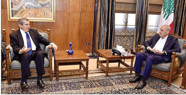
لقاء بري والفرزلي

الوطني أكرر الوفاق الوطني، وليس تحويله إلى أداة من أدوات تفجير الواقع الوطني، وهذا أمر أنا على ثقة كاملة أن كل قيادة الجيش، والقيادات في لبنان لا تريد أن نصل إلى هذا الحد، ونحن بإذن الله يجب أن نستبشر خيراً بالغد القريب إن شاء الله.