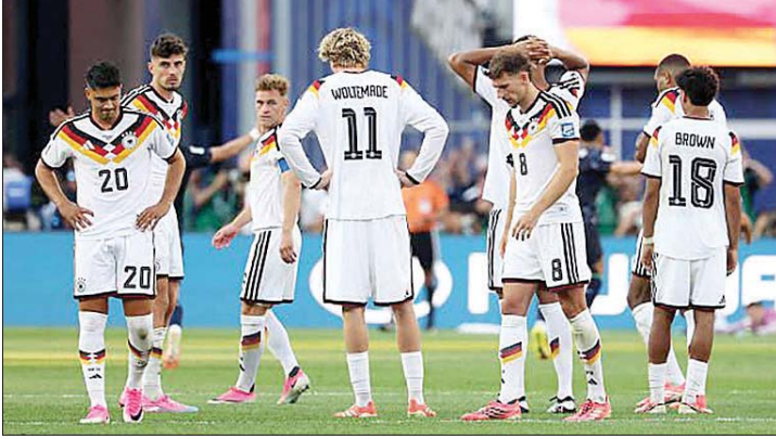
الحرز باد على وجوه لاعبي ألمانيا

بشكل كامل قبل عام ٢٠٢١؛ بسبب سلسلة متواصلة من المشكلات. وقبل ذلك بأسابيع، أُغلق أحد الجسور الرئيسية فوق نهر الراين بمدينة بون؛ العاصمة السابقة لألمانيا الغربية، بعدما عُذّر غير آمن للاستخدام.