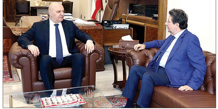
عون مستقبلاً كنعان