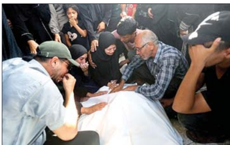
تشجيع شهيد فلسطيني

ونقلت «هيئة البث» مساء الثلاثاء، عن مصادر مطلعة قولها إن المرحلة التجريبية أُرجئت إلى حين التوصل إلى اتفاق بشأن آلية رقابة مشتركة بين الجيشين اللبناني والإسرائيلي لتولى الإشراف