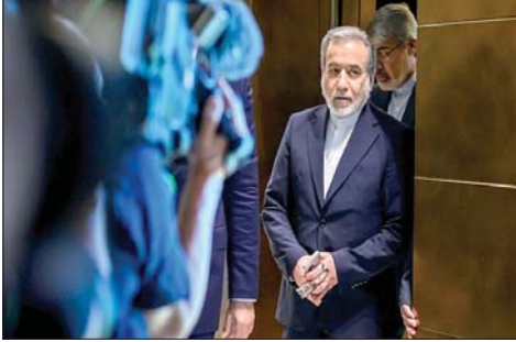
عراقجي في العراق

قال الرئيس الأمريكي دونالد ترامب الأربعاء إن الأمور بين الولايات المتحدة وإيران تسير على ما يرام، مضيفاً أن الاجتماعات في قطر سارت على نحو جيد. وقال ترامب للصحافيين قبل مغادرته في رحلة تسير على ما يرام. عقدوا اجتماعات جيدة جداً، وسرى ما سيحدث". وأضاف "تمضي بشكل جيد جداً". وتابع قائلاً إن إيران "قطعت شوطاً طويلاً... أعتقد أن الأمور على ما