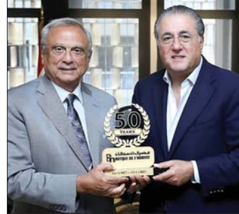
حبيب يقدم «اليوبيل» لشقير

باسم مصرف الإسكان اليوبيل الذهبي للمصرف، لمساهمته الفاعلة في دعم رسالته الوطنية.