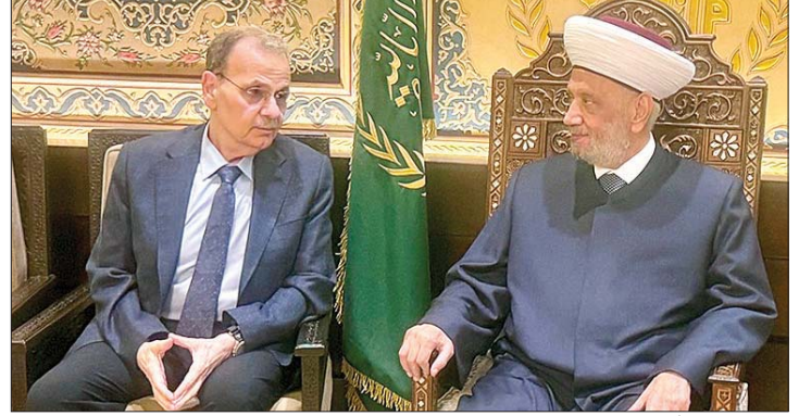
دريان مستقلاً البرزري