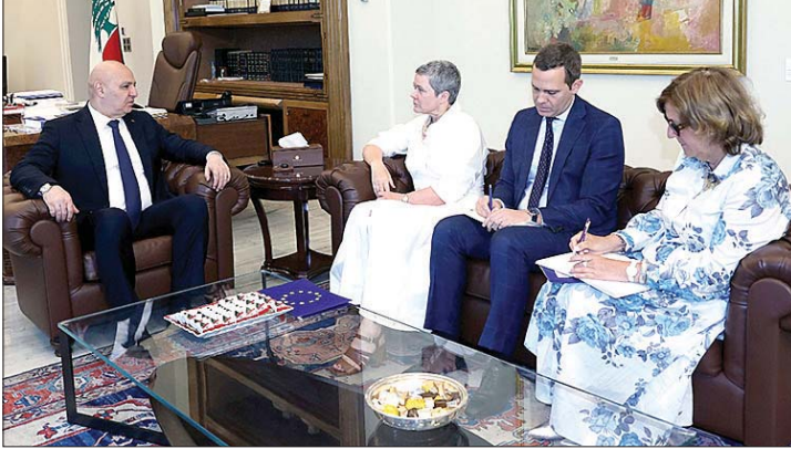
عون مستقبلاً السفيرة الأوروبية

يتصاعد جبل الانقسام السياسي ويتوسع الشرخ بين مؤيدي اطار الاتفاق بين لبنان واسرائيل الذين يشكلون غالبية الشعب اللبناني، ورافضيه وهم الاقلية الدافعة نحو اسقاطه بدعم ايراني، بينما يبقى الترقب والانتظار متسبدين المشهد حتى بلورة آلية الاشراف على تطبيقه وتشكيلها تهيبدا لانطلاق مسار تنفيذ المناطق النموذجية على الارض، علماً ان اسرائيل لا تنفك تؤكد انها لن تنسحب من لبنان حتى يتم تفكيك سلاح حزب الله.