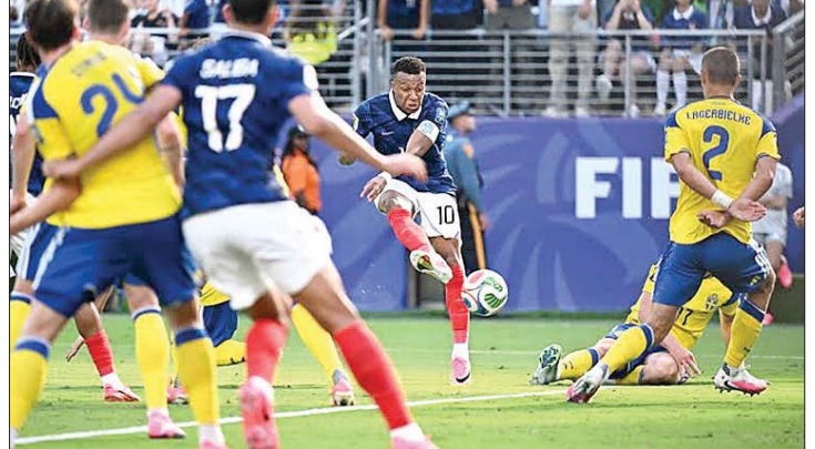
من مباراة فرنسا السويد

على الملعب عينه الأحد في منافسة على بطاقة ربع النهائي.