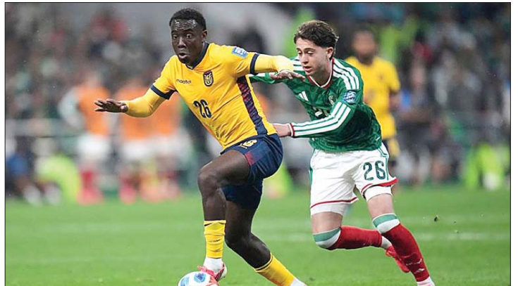
من مباراة المكسيك والأكوادور

الأساسية لفرنسا، بطلة ١٩٩٨ أيضاً، في حين شغل لوكا ديني الجهة اليسرى خلف برادلي باركولا. وكان صليبا، الذي عانى من آلام متكررة في الظهر خلال الأشهر الأخيرة، قد أريح الجمعة خلال المباراة الأخيرة ضمن المجموعة التاسعة ضد الزوج (٤-١). وشكل بذلك مرة أخرى ثنائية قلب الدفاع المعتادة إلى جانب دابو أوباميكانو.