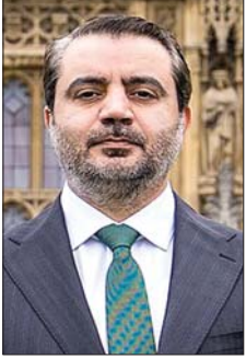
الوزير اسعد الشيباني

كشفت مصادر دبلوماسية سورية أن وزير الخارجية السوري أسعد الشيباني الذي سيجري زيارة رسمية إلى بيروت يوم الخميس، في إطار تحرك سياسي يهدف إلى فتح صفحة جديدة في العلاقات السورية-البنانية، سيشرح خلال لقاءاته مبادرة سياسية سورية تقوم على مساعدة الدولة اللبنانية في الوصول إلى حصر السلاح بيد الدولة عبر مسار سياسي توافقي، يجنب لبنان أي مواجهة داخلية أو انقسام أمني، انطلاقاً من قناعة دمشق بأن معالجة هذا الملف يجب أن تتم بالحوار والتفاهم الوطني، وليس عبر فرض وقائع قد تؤدي إلى اضطرابات داخلية. وأضافت المصادر أن اللقاء مع رئيس مجلس النواب نبيه بري سيكتسب أهمية خاصة، إذ سيتركز على سبل تخفيف الاحتقان الداخلي، وبحث إمكانية مساهمة سوريا، بالتنسيق مع شركاء عرب وإقليميين، في احتواء أي توترات قد ترافق المرحلة المقبلة، ومنع انزلاق لبنان إلى صدامات داخلية في ظل التحولات الإقليمية الجارية.