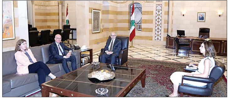
سلام مستقبلاً السفير الألماني

استقبل رئيس مجلس الوزراء نواف سلام سفيرة سويسرا في لبنان نيكول رُودر (Nicole Ruder) في زيارة بروتوكولية لمناسبة تعيينها. واستقبل الرئيس سلام سفير ألمانيا لدى لبنان كورت جورج شتوك-شتيلفريد Kurt Georg Stoeckl-Stillfried في زيارة وداعية لمناسبة انتهاء مهامه الدبلوماسية.