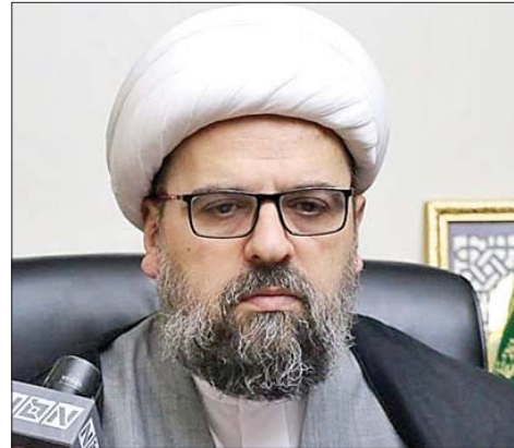
الشيخ أحمد قبلان

العربي والوطني (...))، وتغيير وظيفته الوطنية انتحار وقال: «لن نقبل بصهينة لبنان»، شامل، ولن يكون هذا الجيش وشدد على أن «الجيش اللبناني يبقى أكبر ضرورة للسلم الأهلي الطبيعية (...))».