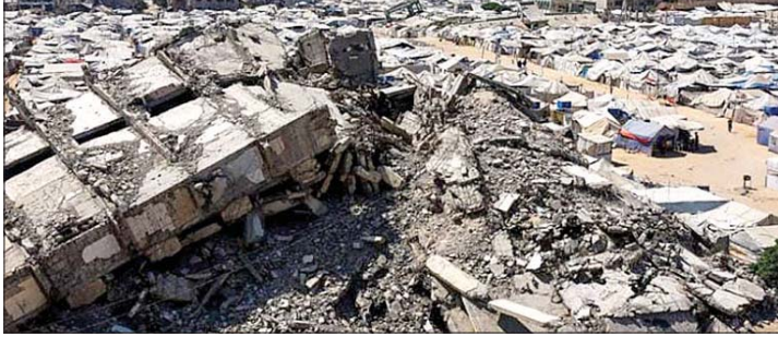
لا إعمار لغزة المحصرة

غير أن هذا التصريح يتعارض مع ما أوردته «هيئة البث» الإسرائيلية أواخر الشهر الماضي، إذ أفادت بأن تل أبيب زودت الجانب الأميركي بمعلومات استخباراتية مفصلة عن أنفاق تابعة لـ«حزب الله» في مرتفعات علي الطاهر جنوبي لبنان، سعياً للحصول على موافقة أميركية تتيح للجيش الإسرائيلي تنفيذ عمليات في المنطقة. وامس، عاد نتنياهو تكرر ان لا سلاح نووياً لإيران طالما بقي في رئاسة الوزراء.