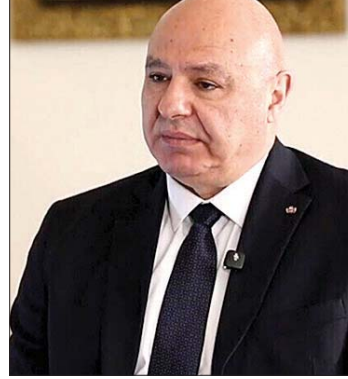
الرئيس جوزاف عون

والسيادة، نوكد اعترازنا بالعلاقات الأخوية التاريخية التي تجمع لبنان والجزائر، وحرصنا الثابت على تعزيزها وتطويرها في مختلف المجالات لما فيه خير البلدين والشعبين الشقيقين، راجين لفخامتكم موفور الصحة والعافية، وللجزائر دوام التقدم والازدهار».