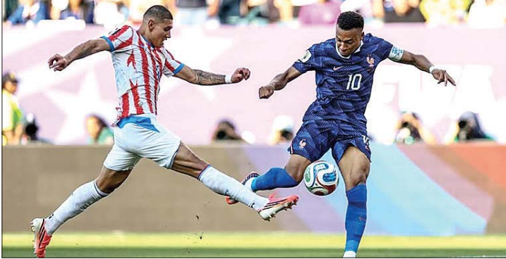
من مباراة فرنسا والباراغواي