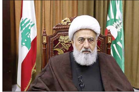
الشيخ علي الخطيب

التداول في شؤون لبنان والمنطقة وأفاق المرحلة المقبلة. وكان العلامة الخطيب زار مساء الجمعة مقر حركة أمل في طهران، والتقى رئيس مجمع اهل البيت اية الله رمضاني. وقدم في خلال اللقاء عرضا وافيا لنتائج العدوان الإسرائيلي على لبنان، مشيراً الى أن أهلنا قدموا نموذجاً اسطوريا للصلمود والصبر والوحدة التي أذهلت العالم، على الرغم من معاناة النزوح والتهجير والخسائر البشرية والمادية التي أحدثها العدوان.