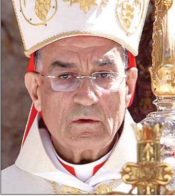
البطريرك بشارة الراعي

وهذه ليست قضية تخص المسيحيين وحدهم، بل قضية تتعلق برسالة لبنان كله، لأن هذا الوطن كان وسيبقى مساحة للحرية، وواحة للعيش المشترك، وفودجا للحوار بين الأديان والثقافات. فحين يحفظ لبنان، تحفظ معه هذه الرسالة، وحين تصان حرية وسيادته يبقى المسيحيون مع جميع شركائهم في الوطن، قادرين على متابعة رسالتهم التاريخية في خدمة الإنسان، والدفاع عن الكرامة البشرية والحرية والانفتاح (...).