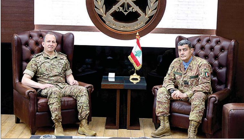
لقاء هيكل وقائد اليونيفيل

راميا وبيت ليف في قضاء بنت حبيل. وكان الجيش الإسرائيلي نفذ صباحاً غارة من مسيرة استهدفت بلدة المنصوري - قضاء صور، تسببت باصابة، واستهدف القصف المدفعي الإسرائيلي محيط منطقة أرنون بشكل متقطع بالتزامن مع رشقات رشاشة ثقيلة.