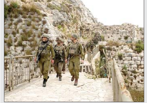
زامير من قلعة الشقيف

هدد رئيس الأركان الإسرائيلي إيال زامير، الأحد، بشن «هجوم سريع» ضد لبنان، في حال خرق اتفاق وقف إطلاق النار. جاء ذلك خلال تفقده قوات جيش الاحتلال الإسرائيلي في قلعة الشقيف المحتلة جنوبي لبنان، برفقة عدد من القادة العسكريين، وفق بيان صادر عن الجيش.