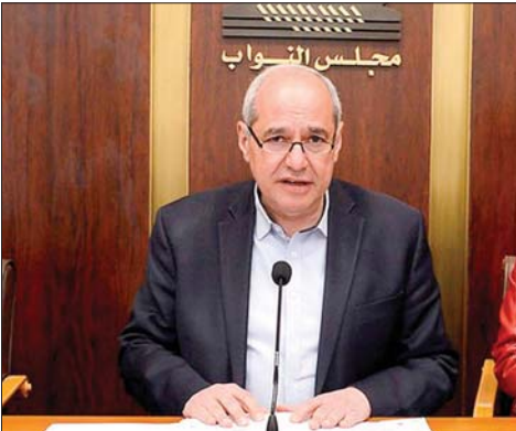
النائب ملحم خلف

للمحتل أي حق، ولا يترتب عليه أي أثر قانوني يمس بسيادة الدولة المحتلة أراضيها أو بوحدة أراضيها وسلامتها الإقليمية. ولا يجوز أن يتحوّل الاحتلال، تحت أي ذريعة، إلى مصدر لحقوق أو إلى وسيلة لفرض وقائع جديدة على الأرض، إذ إن القانون الدولي لا يعترف إلا بالحقوق المشروعة، لا بالأمر الواقع المفروض بالقوة».