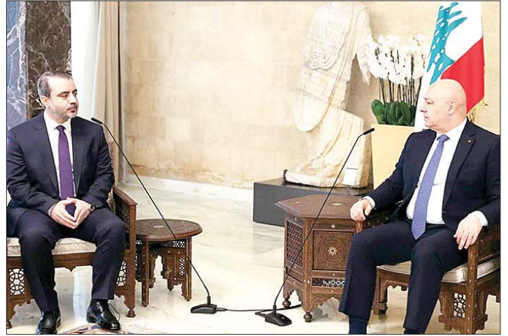
لقاء عون والشيباني

مناطقاً به توقيع اتفاقيات لم تكن في معظمها لصالح لبنان، وكأنها كانت تُفرض بطريقة إملائية على الحكومة اللبنانية والدولة التي خضعت طوال خمسة عشر عاماً للصداية السورية.