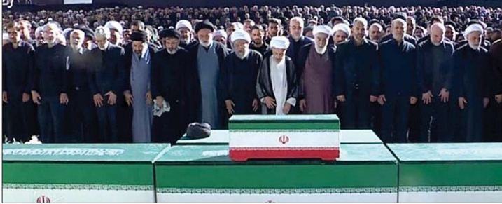
صلاة الجنازة على المرشد الإيراني

الثرى يوم الخميس، عقب موكب تشييع آخر في مدينة مشهد، قرب ضريح الإمام الرضا الذي يحظى بمكانة دينية كبيرة لدى الإيرانيين. إلى جانب الحشود الشعبية، ألقى عدد كبير من المسؤولين الإيرانيين والأجانب التحية على جثمان خامنئي الجمعة. ومن بين الوفود الأجنبية المشاركة أيضا وفدان من حزب الله اللبناني وحركة حماس.