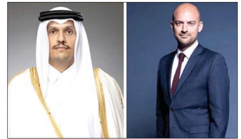
وزيرا خارجية فرنسا وقطر

أشارت وزارة الخارجية القطرية إلى أن رئيس الحكومة محمد بن عبد الرحمن بن جاسم آل ثاني تلقى اتصالا هاتفيا، من وزير الخارجية الفرنسي جان نويل بارو، وجرى خلال الاتصال، استعراض علاقات التعاون بين البلدين وسبل دعمها وتعزيزها، ومناقشة آخر المستجدات الإقليمية، لا سيما في لبنان والجهود الدبلوماسية المبذولة لتعزيز الأمن والاستقرار في المنطقة، بعد توقيع مذكرة التفاهم بين الولايات المتحدة الأميركية والجمهورية الإسلامية الإيرانية، بالإضافة إلى مناقشة عدد من الموضوعات ذات الاهتمام المشترك.