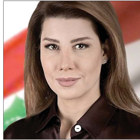
النائب بولا يعقوبيان

لرئيس الوزراء الإسرائيلي بنيامين نتنياهو تعويضاً عن الخسارة التي ألحقها به الاتفاق الأميركي الإيراني». وعن إيران، قالت يعقوبيان إن طهران تسعى إلى توفير طوق نجاة لحزب الله بما يتيح لها الاستمرار في استخدامه كورقة نفوذ، معتبرة أن أبرز ما أفرزته المفاوضات بين واشنطن وطهران هو فصل المسار اللبناني