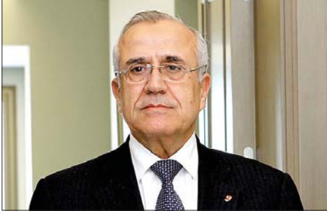
الرئيس ميشال سليمان

في بدايات كثير من مواسم الصيف، كل شيء بأنه أجمل بلد في العالم ليس فقط من جراء تنوع طبيعته وختم: «فلنعمل جميعاً على أن واعتدال مناخه بل أولاً بتنوع يبقى لبنان واحة للأمان والفرح، الثقافات فيه ومعالجه وعادات فهو يستحق أن يُعرف دائماً ورغم وتقاليده شعبه».