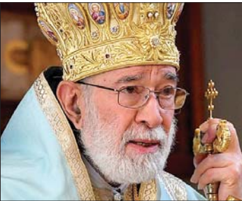
المطران الياس عودة

النفوس بالترتبة، ويترسخ بالعدل والوعي والإرادة. فإذا طهرت النفوس صلحت المجتمعات، وإذا صفت القلوب ازدهرت الأوطان، وإذا انتصر الإنسان على نفسه وتخلّى عن كبريائه وغيه يكون قد انتصر لوطنه. ومتى أشرقت شمس السلام في القلوب تبددت ظلمات الحقد والخوف والتبعية، ومتى عم السلام ربوع الوطن أزهرت الحياة أملاً، وتعاثقت الأيدي لبناء مستقبل تصبو إليه القلوب المخلصة، ويليق بالأجيال القادمة، مستقبل ترفع فيه رايات المحبة، وتصان فيه الكرامة، ويكون الوطن آمناً، شامخاً، موحداً ومستقلاً. دعاؤنا أن يتحرر الجميع من رباطات الشر، ويرتفعوا عن كل ما يعيق إحلال السلام في وطننا».