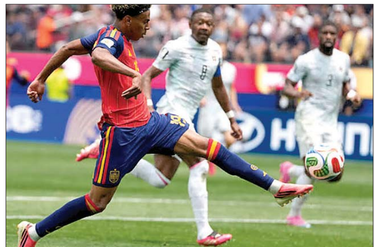
من مباراة اسبانيا والبرتغال

وانطلقت حماسة المباراة فعلياً قبل موعدها الرسمي المحدد، وذلك بعدما علّق الاتحاد الدولي لكرة القدم عقوبة إيقاف بحق النجم الأميركي فولارين بالوغون الذي تلقى بطاقة حمراء أمام البوسنة والهرسك (٢-٠). وهذا قرار أثار موجة من ردود الفعل المنتقدة، لا سيما بعد كشف الرئيس الأميركي دونالد ترامب أنه طلب من