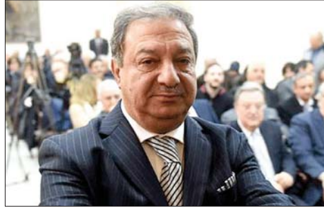
نقيب الصحافة عوني الكعكي

صدر عن نقيب الصحافة عوني الكعكي البيان الآتي: