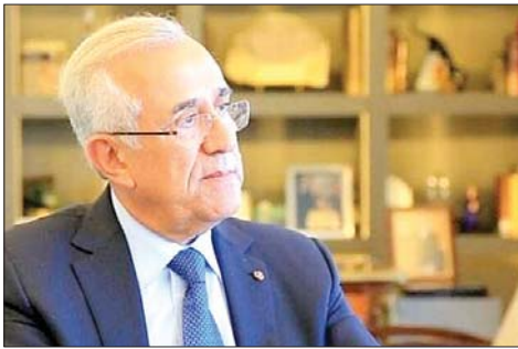
الرئيس ميشال سليمان

الجهات المزعومة، من احتلال (ممثلةً برئيس الجمهورية ورئيس مجلس الوزراء) في سعيها وإصرارها على وقف الحرب وإرساء السلام".