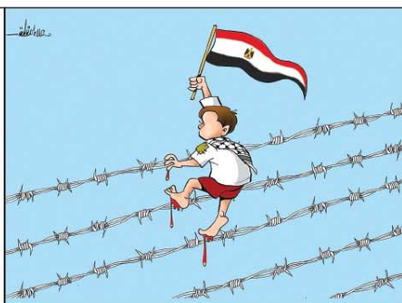
رسم علاء اللقطة (فلسطين) 2026