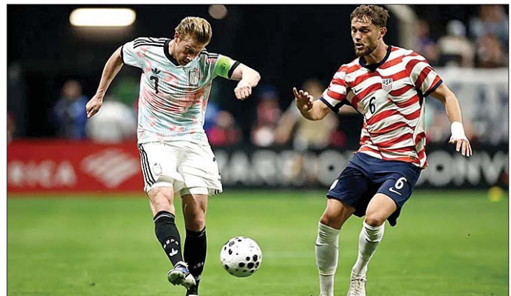
من مباراة بلجيكا والولايات المتحدة

رئيس "فيفا" جاني إنفانتينو مراجعة القرار شخصياً. وبعد تعليق إيقاف بالوغون، رفض "فيفا" استئناف بلجيكا، واصفا إياه بأنه "غير مقبول"، فيما قال الاتحاد البلجيكي إنه لم يتلق أي تفسير حول المسألة، وعبر مدرب منتخبه، الفرنسي رودي غارسيا، عن دهشته بالقرار بسخرية "الأول من نيسان".