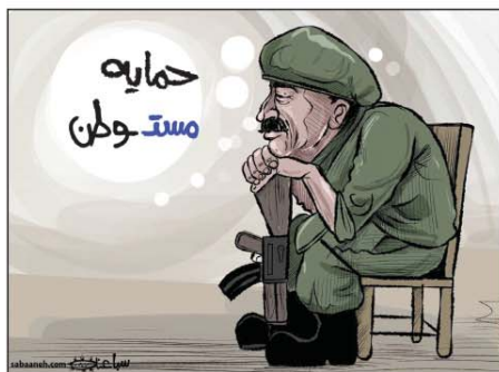
رسم محمد سباعنة (فلسطين) 2026