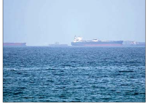
ناقلة نفط في مضيق هرمز

قال مصدر مطلع الثلاثاء إن ناقلة الغاز الطبيعي المسال القطرية (الرقبات) معرضة لخطر الانفجار بسبب حريق اندلع في غرفة المحركات. وأفادت مصادر بأن أضرارا لحقت بالناقلة القطرية وناقلة نفط خام ترفع العلم السعودي قرب مضيق هرمز بعدما أطلق الحرس الثوري الإيراني صواريخ على سفينتين في الممر المائي خلال الليل. وذكر أحد المصادر أن الناقلة كانت محملة بالغاز الطبيعي المسال وأرسلت نداءات استغاثة بعد تضرر جانبها الأيسر.