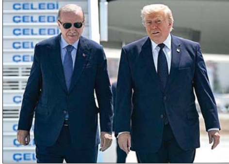
ترامب و اردوغان

لكن ترامب الذي لا يزال يشعر بالاستياء بعدما فرضت دول أوروبية قيوداً على استخدام القوات الأمريكية قواعدها لمهاجمة إيران، أمضى الفترة التي سبقت القمة في مهاجمة الحلفاء لعدم تحركهم بالسرعة الكافية التي ترضيه. ويطمح القادة الأوروبيون أقله إلى تجنب أي صدام أو خلاف حاد مع الرئيس الأمريكي المتقلب المزاج، لما قد يشكل ضربة أخرى لصداقة حلف «الناتو»، لا سيما بعدما شكك ترامب مراراً في التزام الولايات المتحدة بحماية حلفائها.