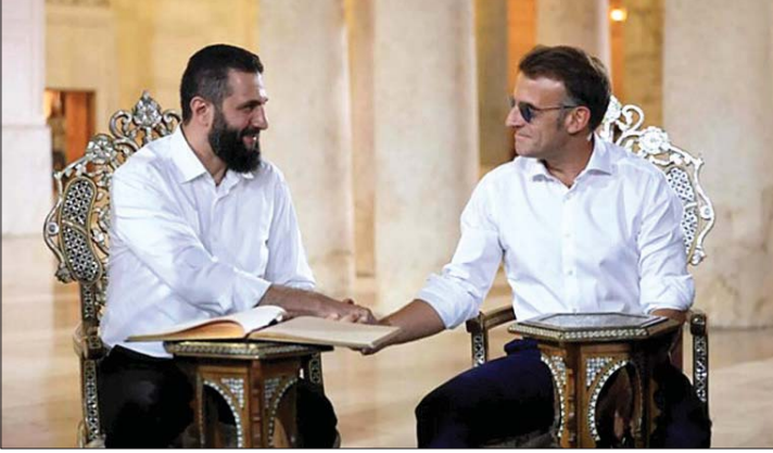
من قمة ماكرون والشرع في دمشق

أعرب الرئيس السوري أحمد الشرع والفرنسي إيمانويل ماكرون الثلاثاء عن تطلعهما لأن تصحح سوريا عقدة ربط إقليمية على طريق الممرات العالمية، وذلك بعدما دفع إغلاق مضيق هرمز خلال الحرب في الشرق الأوسط دولا عدة إلى البحث عن مسارات بديلة. وخلال "منتدى اقتصادي مخصص لإعادة إعمار سوريا والممرات الاستراتيجية" عقد في القصر الرئاسي بحضور ماكرون والوفد المرافق له، قال الشرع "بعد أزمة مضيق هرمز... أدرك العالم قيمة الممرات الأمانة والمستقرة هنا".