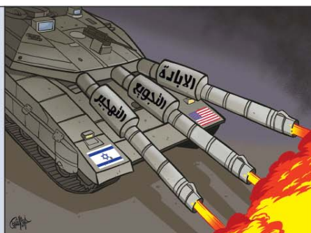
رسم فيري الشريف (ليبيا) 2026