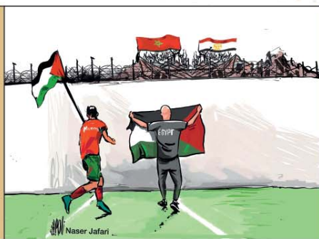
رسم ناصر الجعفري (الأردن) 2026