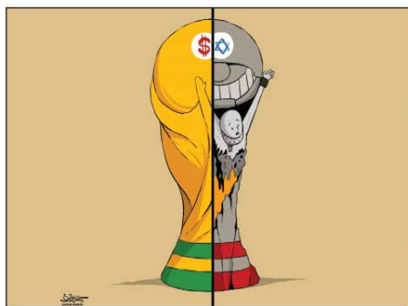
رسم كمال شرف (اليمن) 2026