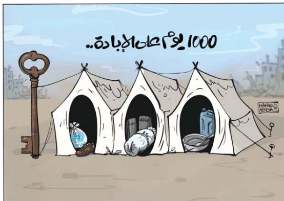
رسم محمود عباس (فلسطين) 2026