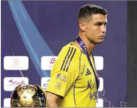
رونالدو الخاسر الأكبر

أحد أكثر المنتخبات تنوعاً باللعب العالم منذ نسخة ٢٠١٠. وحسب شبكة "أوبتا"، يعد هذا أعلى رقم بين جميع المنتخبات خلال هذه الفترة، متقدماً على الأرجنتين وبلجيكا وألمانيا وأوروغواي، التي حققت كل منها ٤ انتصارات بهذه النتيجة.