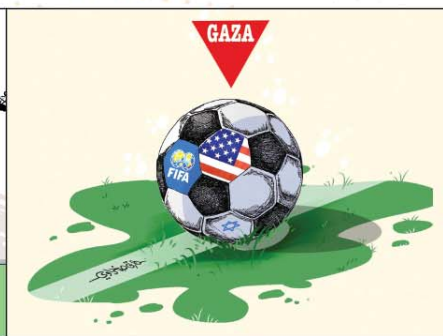
رسم طارق صخراوي (الجزائر) 2026