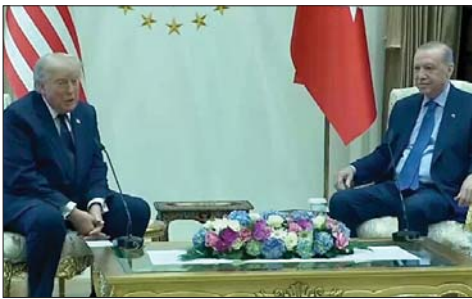
اردوغان و ترامب

كبيرة جداً من النقط». وأضاف: «تركيا اشترت طائرات أميركية وأعتقد أن علينا التزاماً بصيانة محركاتها». ورأى أنه «ينبغي أن تؤوّل السيطرة على غرينلاندا لأميركا لا إلى الدنمارك، وقد نسحب جميع جنودنا من أوروبا».