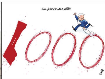
رسم فهد البدرادي (سوريا) 2026